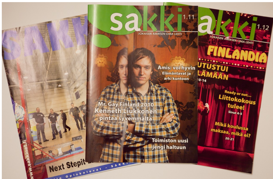
Vanhoja Sakki-lehden kansia.

Silloinen SAKKI ry:n pääsihteeri kysyi minulta, mitä meidän pitäisi tehdä lehdelle. Vaihtoehtoiksi jäivät joko uudistus tai julkaisun lopettaminen. Tilanteeseen tutustumisen jälkeen olin sitä mieltä, että meidän tulisi tehdä SAKKI ry:n jäsen- ja järjestölehdelle täydellinen lehtiudistus.