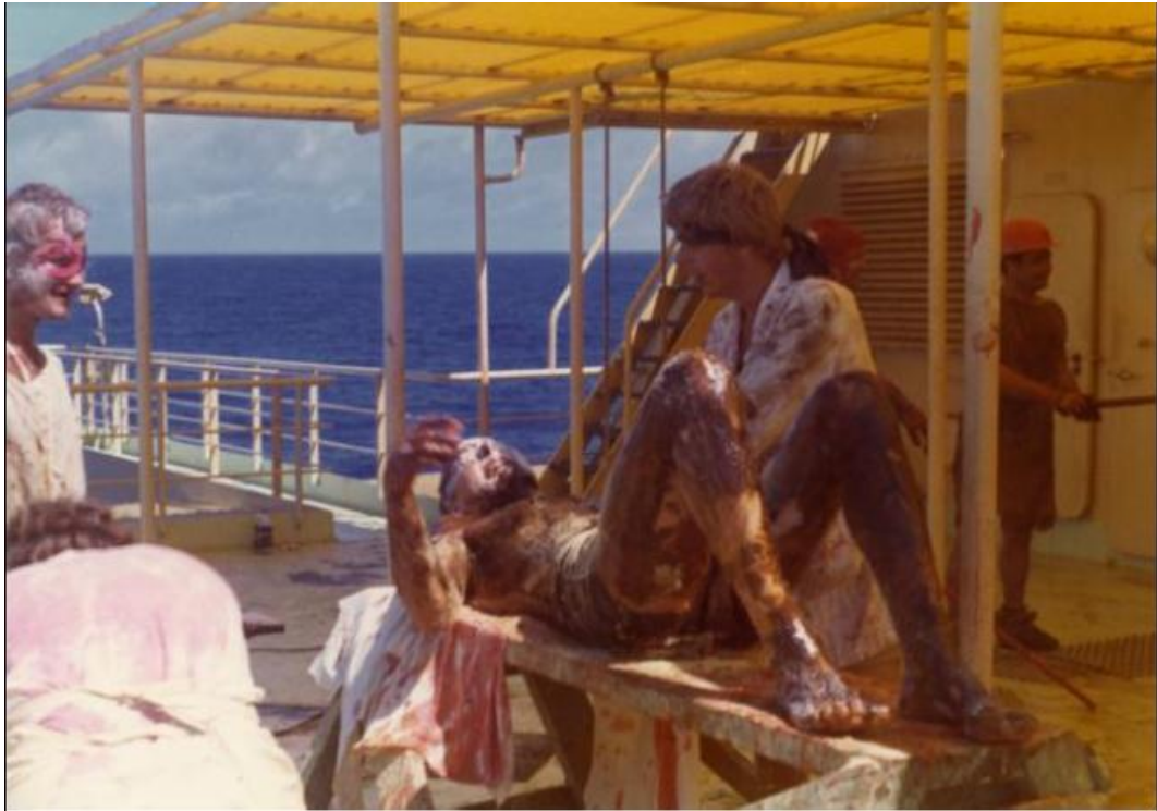
Kuva 2. Ensikertalaista tervataan MT Enskerillä 1973. (Aho 2014).

astuu Neptunuksen eteen puhutellen häntä Teidän Majesteettinaan pyytäen lupaa ylittää raja Neptunuksen valtakuntaan. Hänen tulee kertoa syntisten eli kastamattomien merimiesten lukumäärä ja esittää toivomus, että Neptunus ottaisi heidät täysivaltaisiksi alamaisiksi valtakuntaansa. Varsinaiset kastamenot alkavat Neptunuksen ja päällikön kahdenkeskisen keskustelun jälkeen.