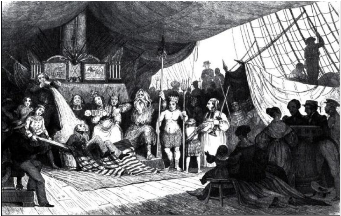
Kuva 1. Jules de Caudinin maalaus linjakasteesta rankalaisella sotalaiva Médusella vuonna 1816. (Aho 2014).