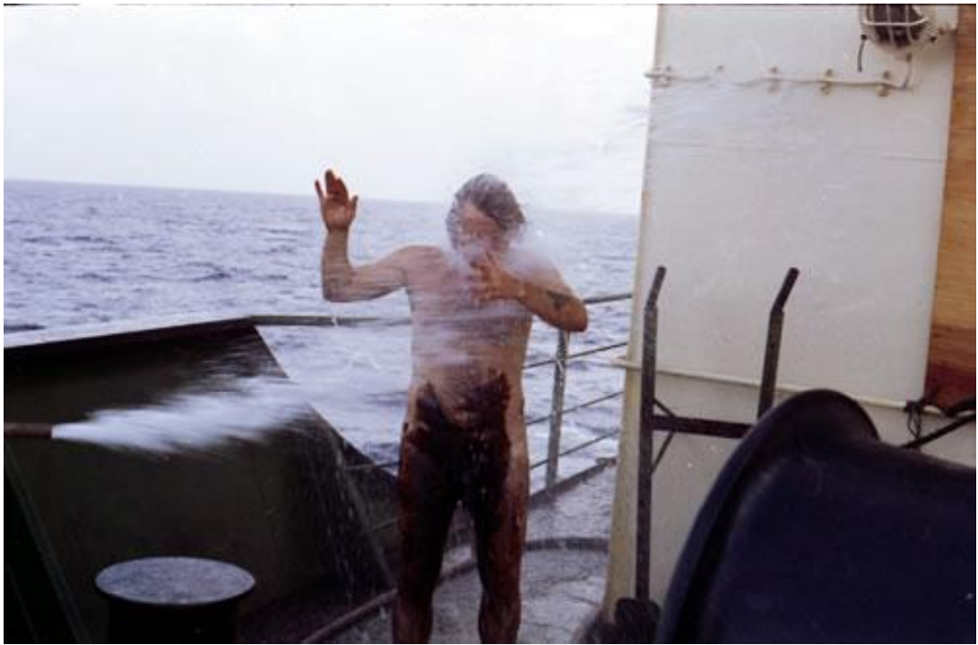
Kuva 4. Tervauksen jälkeinen pesu. (Äänimeri, 2014).