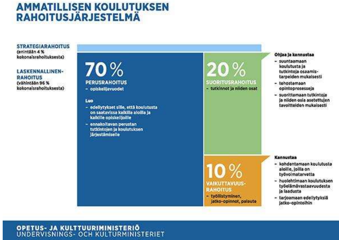
Kuva 2. Rahoitus prosentteina [7].

koulutuksen järjestäjät voivat tehdä hakemuksen strategiarahoitukseen, jota ministeriö myöntää harkintaan perustuen. [7]