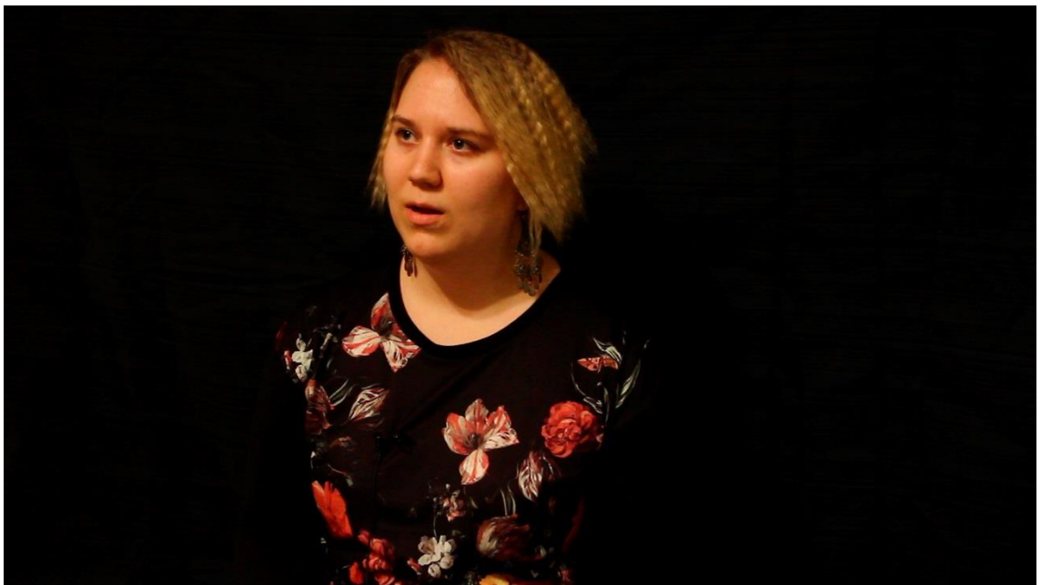
KUVA 7. Haastattelussa ensimmäinen kuvakoko on puolikuva, josta esimerkki tässä.