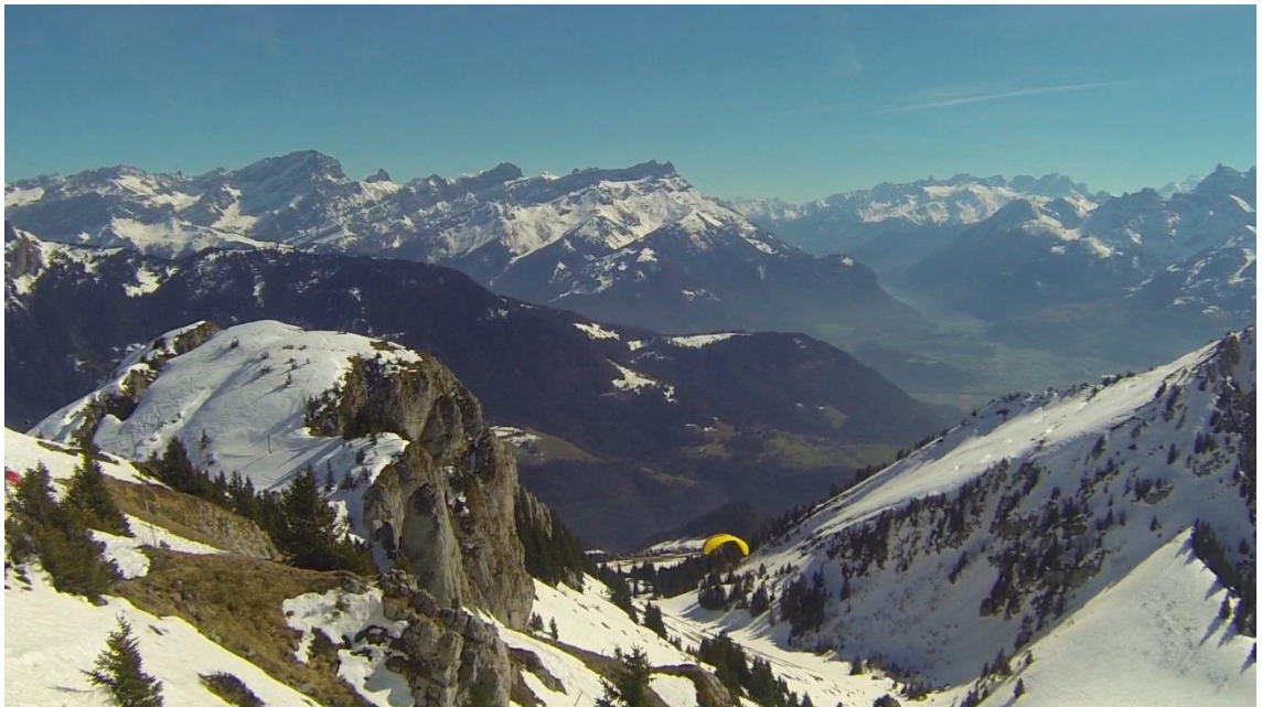
KUVA 5. Parhaimpia otoksia Sveitsistä.

Näitä kahta kuvaa verrattaessa huomaa miten suuri vaikutus on valinoillani ollut. Sveitsissä vuoret ja jylhät maisemat muodostavat huikeaa syvyysvaikutelmaa, kun taas haastattelun syvyys on hyvin yksiulotteinen. Toisessa värit ovat yksinkertaiset ja suhteellisen ärsykeettömät, kun taas toisessa on silmälle paljonkin ärsykettä.