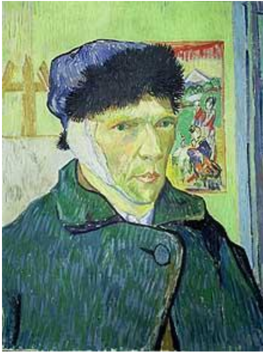
KUVA 1. Vincent van Goghin korvapuoli omakuva. (van Gogh 1889).