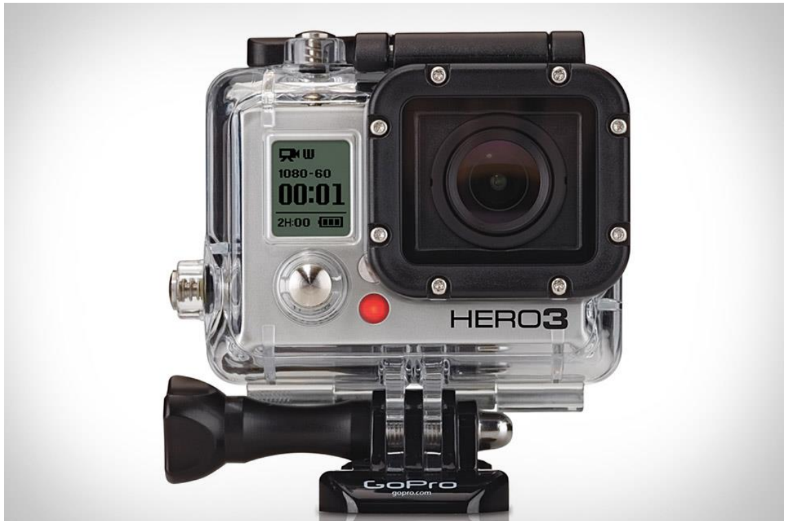
KUVA 9. GoPro hero 3+ actionkamera. Kamera on pieni ja näppärästi kiinnitettävissä erilaisiin alustoihin. Laskettelutilanteeseen sopiva väline sekä veden- ja roiskeen kestävä (Uncrate, 2014).

Haastattelun kuvasin Canon EOS 7D:llä ja äänen tallennukseen käytin erillistä ääninauhuria ja nappimikkiä. Nämä ovat sellaiset perustarpeet haastattelun kuvaamiseen. Valaisun pidin hyvin yksinkertaisena ja kattovalaisun lisäksi hyödynsin yhtä Led-spottivaloa. Lopputulosta katsellessa olen tyytyväinen siihen miltä haastattelutilanne videolla näyttää. Valo osuu juuri sopivasti hieman ylemmäs katsoessani silmiini jolloin niihin syntyy heijastus. Tämä heijastus saa silmäni tuikkimaan ja se tukee tarinaani hyvin lisäämällä ilmettä ja intoa kasvoilleni.