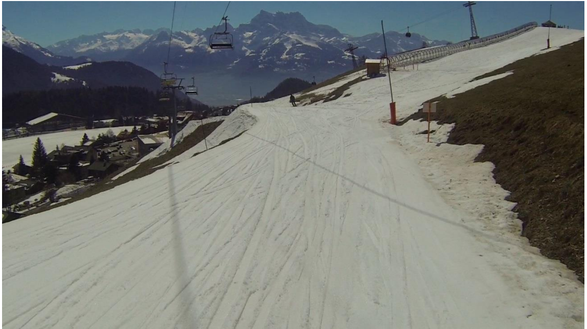
KUVA 6. Sveitsissä kuvatussa materiaalissa kuvakoot ovat laajoja ja kuvattuna henkilön näkökulmasta.