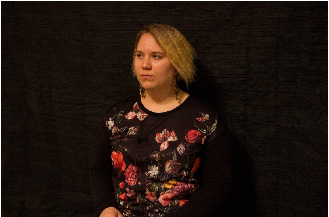
KUVA 4. Esimerkki haastattelutilanteeni asetelmasta.