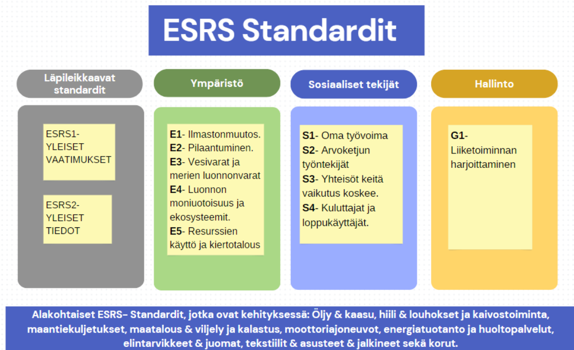
Kuva 7. Kuvaus ESRS- Standardeista, (Mukaiillen Tofuren, uudet ESRS- standardit, 2023)

vaikutuksiin. Kuvasta (kuva 7) voi nähdä eri ESRS osat ja mitä ne sisältävät. (Niemi, 2023, Käkikuu).