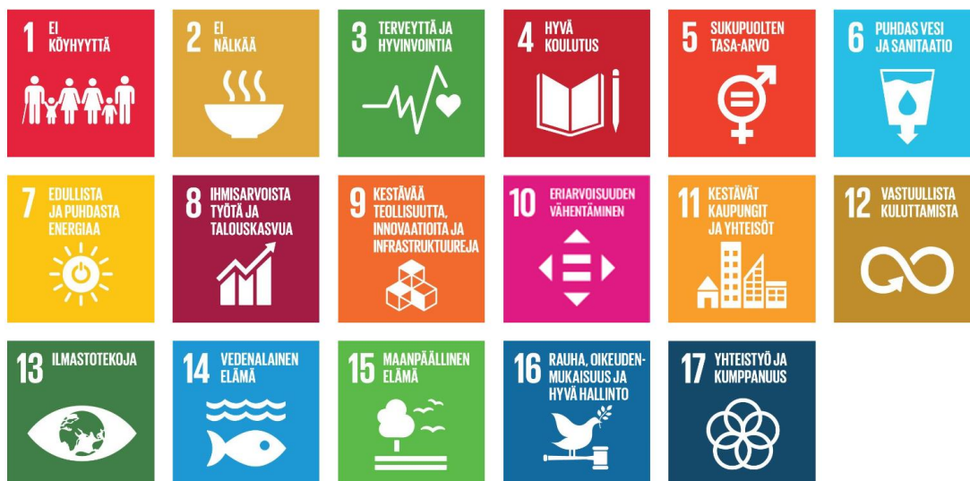
Kuva 5. YK:n kestävän kehityksen 17 tavoitetta (Suomen YK-liitto, kestävä kehitys).

YK:n kestävän kehityksen tavoitteita on yhteensä 17. Alatavoitteita on yhteensä 169.