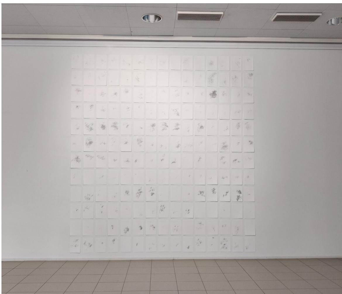
Kuva 10. Yleiskuva Imatran taidemuseolta teoksesta Piirrän, kunnes nukahdan

Oli jännittävää nähdä oma työ ensimmäistä kertaa kokonaisuudessaan ripustettuna (Kuva 10). Ensimmäisiä kuukausia olin levitellyt pöydälle ja katsonut sen hetkistä kokonaisuutta. Viimeiset kolme kuukautta kerrytin vain pinoja ja luotin prosessin tuomaan lopputulokseen. Peräkkäisten päivien arkeista pystyi löytämään hämmentävän paljon samankaltaisuuksia ja yhteyksiä. Jotkut arkit muistuttivat muodoltaan toisiaan ja joidenkin papereiden piirroset kuin jatkuivat seuraavassa.