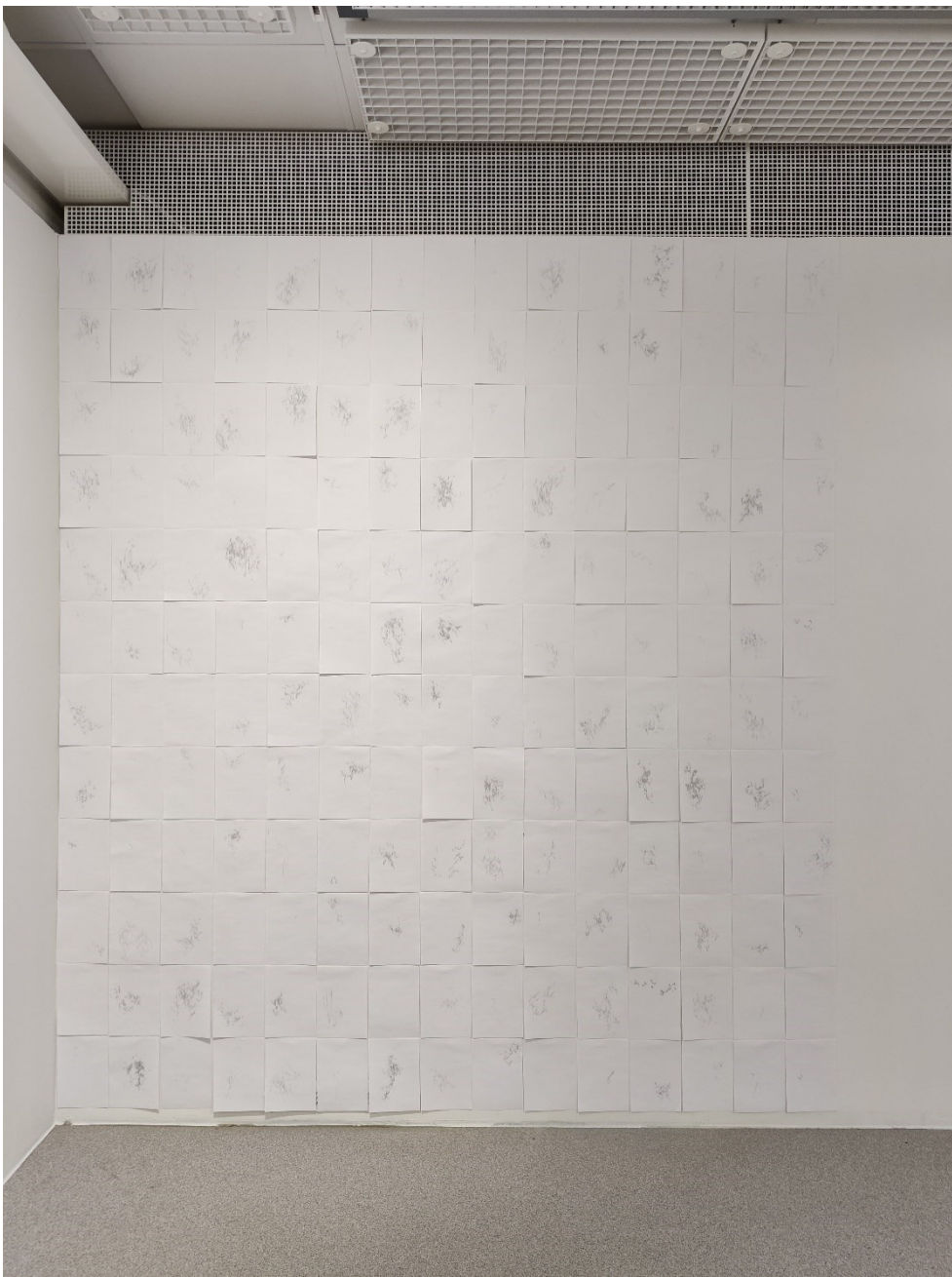
Kuva 6. Testiripustus pienillä väleillä, 260 cm korkea seinä