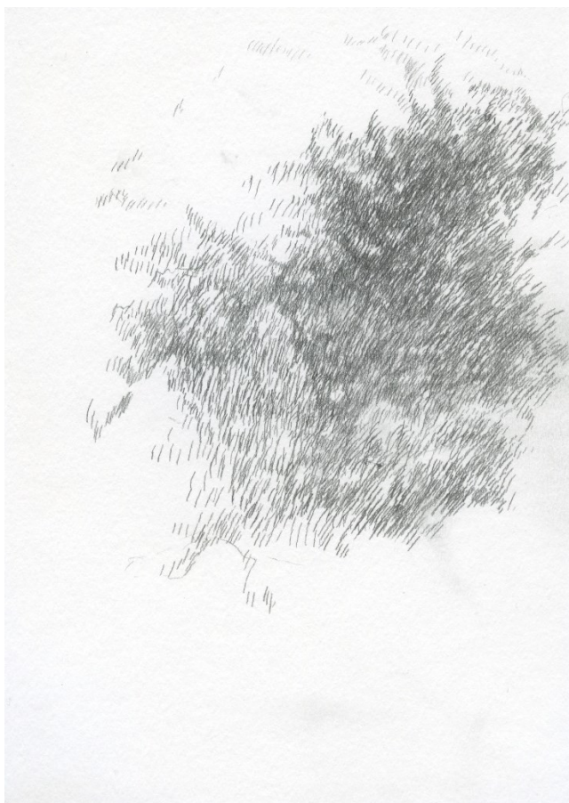
Kuva 4. 12.lokakuuta, tummin piirros puolen vuoden ajalta

Kun menen nukkumaan, olen pimeässä huoneessa. Paperi sängyllä näyttäytyy vaaleampana lakanaa vasten. Näen käteni liikkeen ja pystyn tuntemaan, kuinka lyijykynä jättää jälkeä paperiin. Mutta paperiin piirtyvää kuvaa en pysty havaitsemaan. Tunne on hämmennävä. Koska valossa, oli se sitten päivänvaloa tai keinotekoista, valkoiseen paperiin lyijykynällä tehdyn jäljen pystyy havaitsemaan helposti. Jopa hyvin hennon jäljen. Pimeässä piirtyvä kuva on mahdollista havaita vasta silloin, kun viiva on kohdistunut samaan kohtaan kauan. Kuvassa 4 ensimmäinen piirros, jonka kohdalla aloin näkemään piirrosjälkeä pimeässä tummana möykkynä. Kokonaisuuden muiden paperien rinnalla tämä erottuu edelleen kaikkein tummimpana.