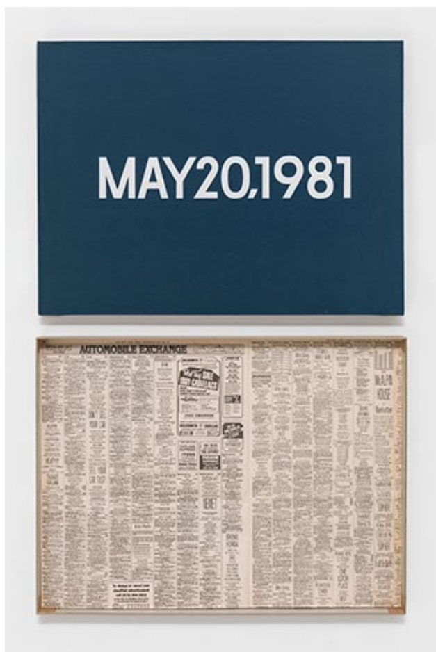
Kuva 3. On Kawara, May 20.1981 ("Wednesday"), 1981

Date Paintings tai Today Series on kokonaisuus, jonka On Kawara aloitti 4. tammikuuta 1966. 40 vuoden ajan Kawara maalasi joka päivä maalauksen, jossa monokromaattiselle, eli yksiväriselle, pohjalle maalataan kyseisen päivän päivämäärä. Se miten ja millä kielellä päivämäärä ilmaistaan, riippui maasta, missä Kawara milloinkin oli. Jos maassa ei ole käytössä latinalaisia aakkosia, käytti hän kielenä esperantoa. Mikäli maalaus ei ole valmis 24 tunnin sisällä kyseisenä päivänä, se tuhoetaan. Kuvassa 3 nähtävissä Kawaran maalaus, sekä sen säilytystä varten valmistettu rasia, johon maalaus säilötään yhdessä päivän sanomalehdestä otetun leikkeen kanssa. (Woo 2010, 63.)