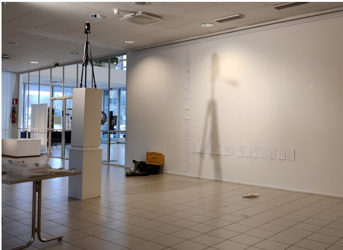
Kuva 7. Yleiskuva ripustuksen alkuvaiheista

Teos tulee olemaan noin 285 cm korkea ja 267 cm leveä. Papereiden määränä tämä tarkoittaa 12 paperia pystyrivissä ja 15 paperia vaakarivissä. Jaoin paperit 15 paperin nippuihin vaakarivien mukaan ja numeroin rivit 1–12 ja merkitsin niihin vielä varmuuden vuoksi nipun sisältämät päivämäärät (Kuva 8). Esimerkiksi nipusta numero 1 löytyy paperit aikaväliltä 1.9. – 15.9.2023. Tällä tavalla ajattelin pystyvani tekemään joko kokonaisen vaakarivin kerrallaan tai vastaavasti etenemällä ylhäältä alas ottamalla jokaisesta pinosta aina päällimmäisen paperin.