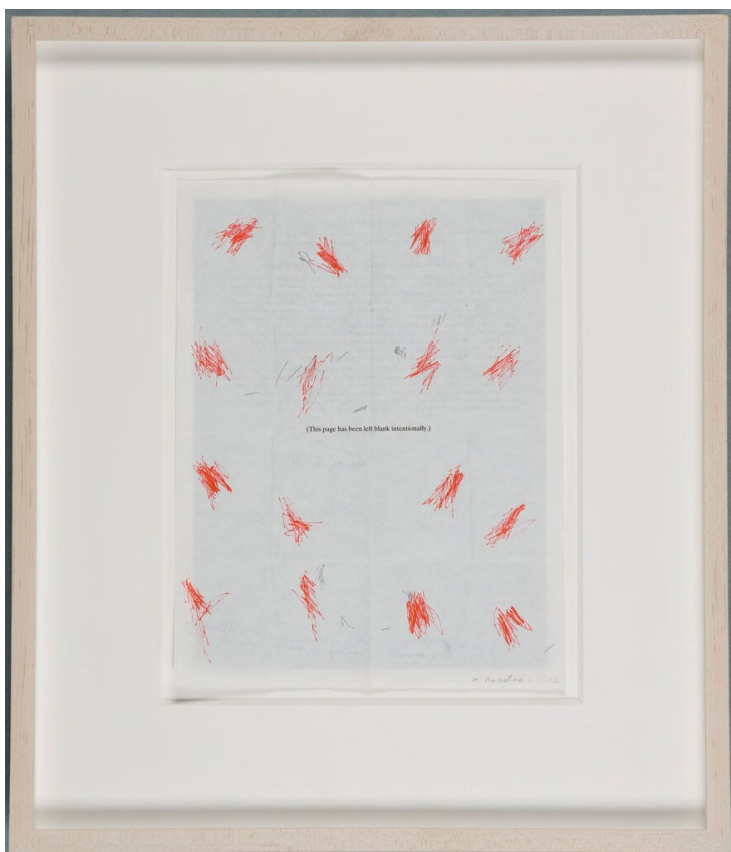
Kuva 1. William Anastasi Untitled (Pocket Drawing), 2006. (Harvard Art Museums)

William Anastasi hyödyntää blind drawing -menetelmiä pyrkiessään ohittamaan omaa tietoa toimijuuttaan taiteen tekijänä (Boucher 2006, 140). Hän on piirtänyt silmät sidottuina studiollaan, mutta vienyt luomisprosessinsa myös ihmisten pariin. Hän on esimerkiksi taitellut paperin taskuun sopivaksi, ja pitänyt lyijykynää taskussa paperia vasten. Kun hän päättää sivun olevan valmis, hän taitteli paperin uudelleen ja toistaa tätä niin kauan, että jokaiseen taitelluista alueista on piirretty. (MoMA) Kuvassa 1 on yksi Anastasin taskupiirroksista auki levitettynä ja kehystettynä.