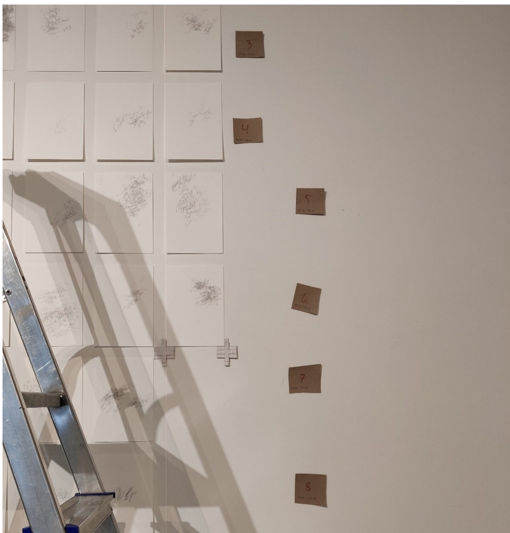
Kuva 9. Vaihekuva ripustuksesta

joilla merkitsin myös pöydällä olevia paperipinoja. Tällä tavalla pystyin varmistamaan vielä tikkailla, että paperin takana oleva päivämäärä täsmää rivin sisältämiin päivämääriin ilman epäröintejä. Ripustuksen vaiheita havainnollistetaan kuvassa 9.