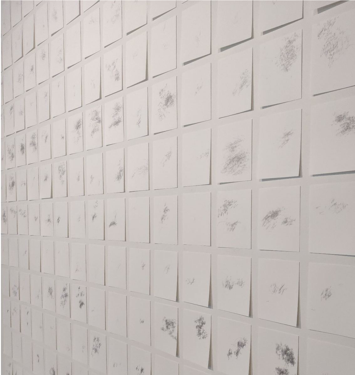
Kuva 11. Lähempää kuvattuna teos Piirrän, kunnes nukahdan