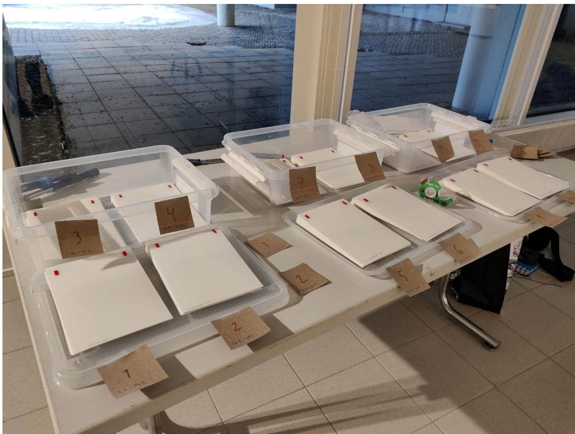
Kuva 8. Paperit pinoissa vaakarivien mukaan

Ennen museolle menoa olin ajatellut papereiden olevan hyvin lähellä toisiaan. Mahdollisimman pienillä etäisyyksillä ilman, että ne olisivat kiinni toisissaan. Ripustusta edeltäneellä viikolla kyseenalaistin ajatuksen ja lähdin kokeilemaan suurempia välejä. Päädyin kasvatamaan papereiden väliä maltilliseen yhteen senttimetriin ja sen mukaan tein ripustuksen avuksi ristejä ruutupaperin ruutujen mukaan, jotka liimasin vielä paksummalle kartongille.