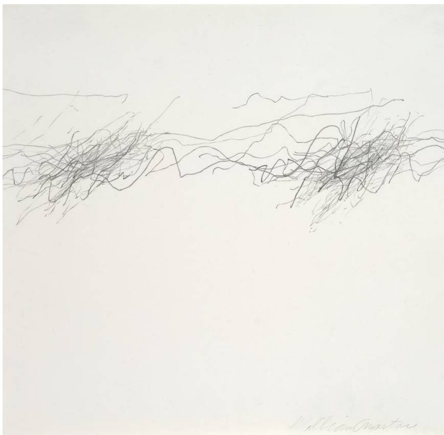
Kuva 2. William Anastasi Untitled (Subway Drawings), 1990 (Harvard Art Museums)

William Anastasi aloitti vuonna 1977 Subway-sarjansa, jossa piirrookset syntyvät metromatkojen aikana. Anastasi istui metroon piirustuslaturiin, paperin ja kahden kynän kanssa. Anastasi asettaa kätensä 90 asteen kulmaan paperin päälle, pitää käsiään paikallaan ja antaa liikkuvan metron liikehdinnän luoda jäljen paperille (Kuva 2). Lopputulosta ei määrää näköhavainto, vaan metromatkaan kulunut aika ja sen aikana tapahtuvat liikkeet. (Butler 1999, 97.) Piirtäminen sai alkunsa metromatkoista, joissa Anastasi matkasi pelaamaan shakkia ystävänsä kanssa (Boucher 2006, 140).