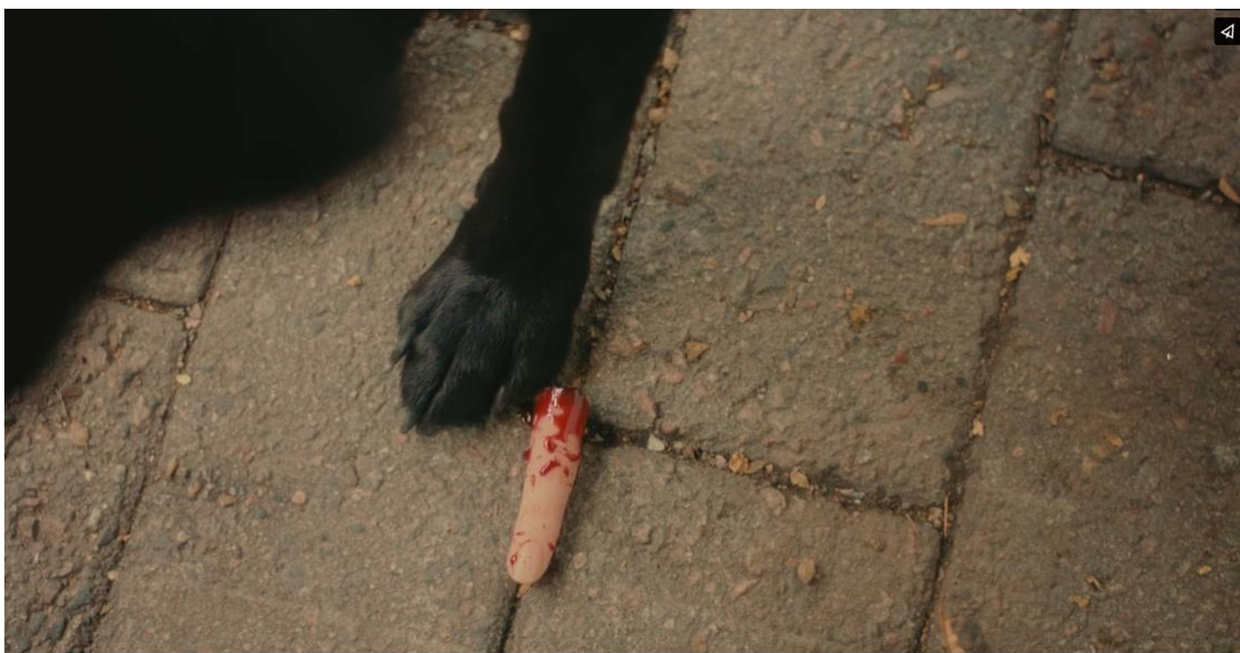
Kuva 8. Koira tuo Vaulan sormen symbolisena eleenä. Kuvakaappaus lyhytelokuvasta Pitkät kynnet (2024).

iltapäivän tapahtumia, joten halusin elokuvakokemuksen olevan myös sen tuntuinen. Vanhuksen tapaturmainen kuolema nukkuvalla esikaupunkialueella vaikuttaa alueen asukkaille normaalilta, vaikka siskosten näkökulmasta se on ollut täynnä jännitystä ja vaarallisia tilanteita. Lähdin pohtimaan, kuinka tämän tunteen voisi synnyttää elokuvaan, ja koin avuksi ajatella elokuvaa introna jollekin suuremmalle. Elokuvan tapahtuma on lähtölaukaus jollekin siskosten elämässä. Sen voi nähdä merkinä lapsuuden loppumiselle tai ensimmäiselle isolle salaisuudelle. Kun ajattelin loppua, ajattelin tosiasiasa, mitä tapahtuisi pitkän elokuvan toisessa näytöksessä. Siinä, jota ei tähän elokuvaan kuitenkaan kuvattaisi. Kyseiseen metodiin koin sopivaksi avoimen lopun symbolisella eleellä. Koira tuo sisaruksille Vaulan sormen, jonka voi kokea kuvastavan sisaruksille jäävää syyllisyyden ja salaisuuden taakkaa. Tästä elokuvan on mahdollista jatkaa esimerkiksi seuraamaan, kuinka tapahtuman vaikutukset näkyvät siskoksissa heidän aikuistuttuaan. Ovatko he pitäneet salaisuuden, ja jos ovat, mitä se heille on tehnyt? Ovatko he vielä läheisiä? Minkälaisille urapoluille he ovat lähteneet sittemmin? Vieläkö eläimet ovat tärkeässä asemassa?