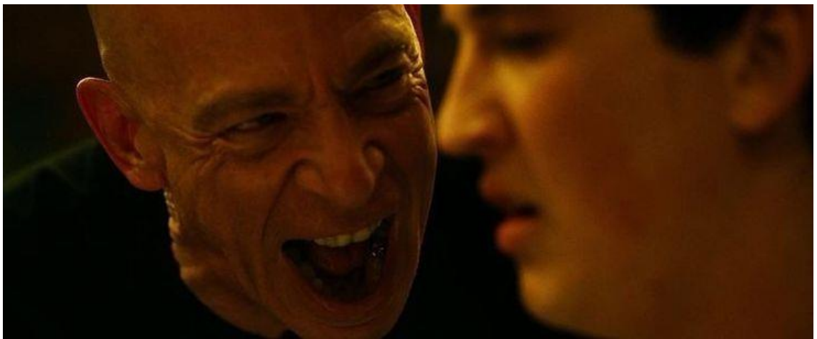
Kuva 2. Terrence Fletcher ei ole edelleenkään tyytyväinen Andrew Neimanin komppiin. Kuvakaappaus elokuvasta Whiplash (2014).