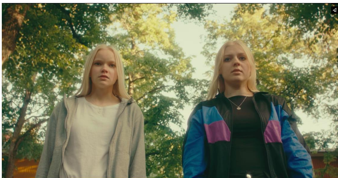
Kuva 9. Sisarusten Pajun ja Pinjan tulevaisuus herättää kysymyksiä. Kuvakaappaus lyhytelokuvasta Pitkät kynnet (2024).