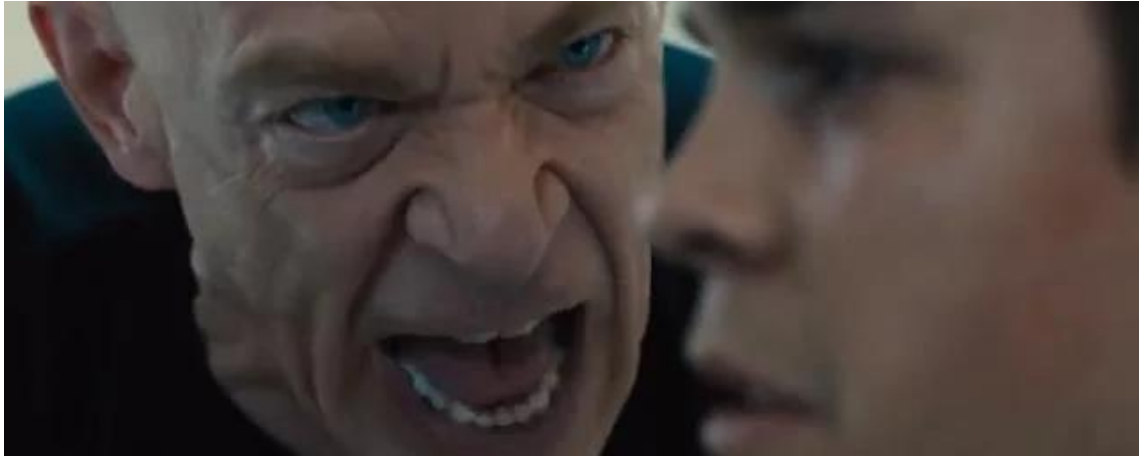
Kuva 1. Terrence Fletcher ei ole tyytyväinen Andrew Neimanin komppiin. Kuvakaappaus lyhytelokuvasta Whiplash (2013).

kirjaimellisesti nähdään hänen huutavasta suustaan lentävä sylki. Näyttelijäntyö pysyy Fletcherin osalta raivokkaana ja säälimättömänä, eikä sitä ole lähdetty muuttamaan.