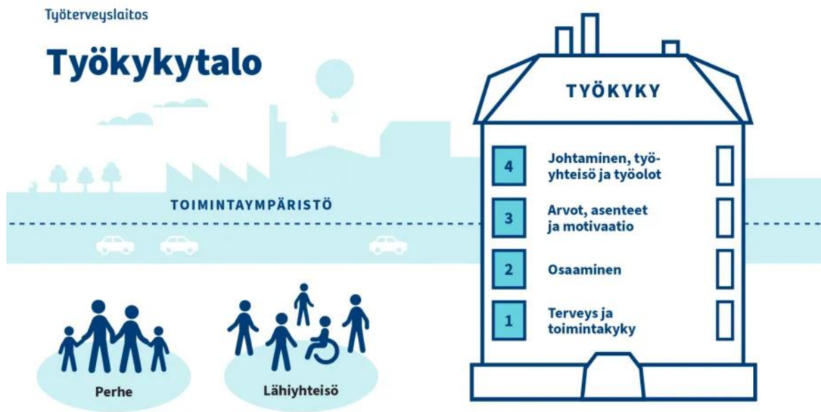
Kuva 1. Työkyky-talomalli. (Työterveyslaitos)