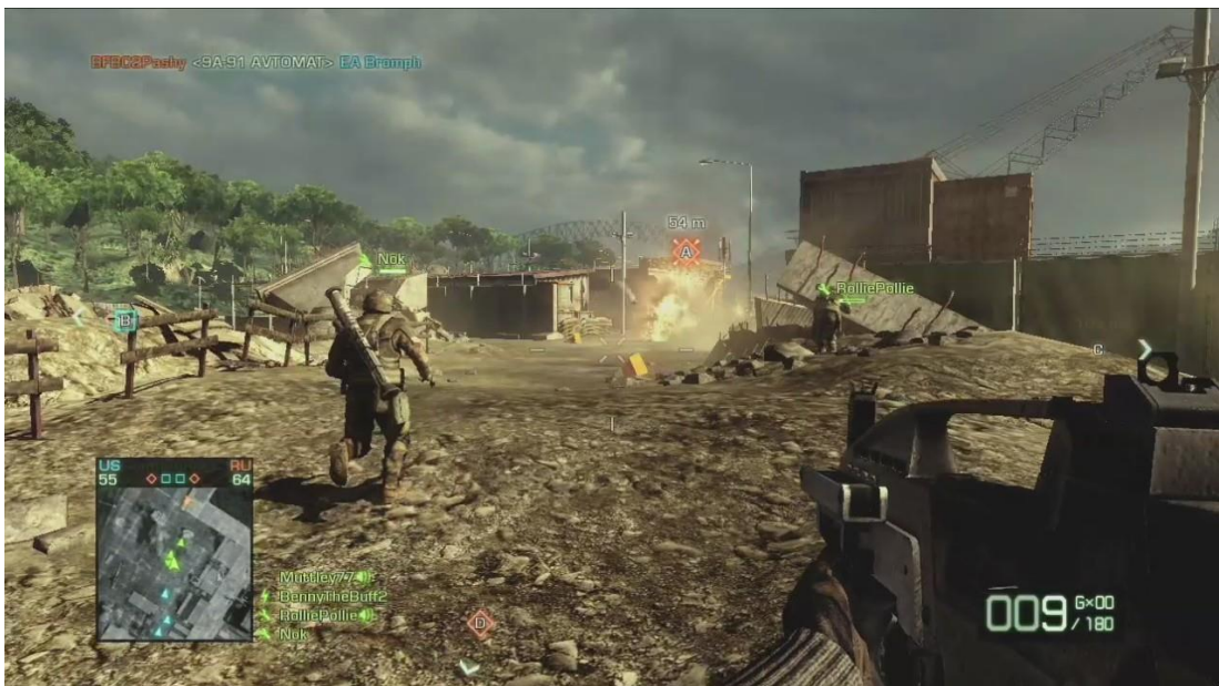
Kuva 6. Ensimmäisen persoonan perspektiivi.

Kiinteällä perspektiivillä tarkoitetaan kolmiulotteista pelimaailmaa, jossa taustat ovat ennalta renderöityjä taustakuvia joiden päälle peli renderöi reaalitajassa objekteja. Nämä objektit voivat olla esimerkiksi pelaajahahmo tai asioita joiden kanssa pelaaja voi olla vuorovaikutuksessa. Pelaaja ei siis itse voi hallita kameraa vaan näkymät ovat ennalta määrättyjä. Kiinteää perspektiiviä käytetään eniten rooli- ja seikkailupeleissä.