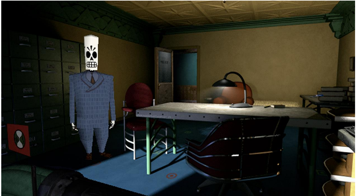
Kuva 5. Kiinteä perspektiivi.

Kiinteällä perspektiivillä tarkoitetaan kolmiulotteista pelimaailmaa, jossa taustat ovat ennalta renderöityjä taustakuvia joiden päälle peli renderöi reaalitajassa objekteja. Nämä objektit voivat olla esimerkiksi pelaajahahmo tai asioita joiden kanssa pelaaja voi olla vuorovaikutuksessa. Pelaaja ei siis itse voi hallita kameraa vaan näkymät ovat ennalta määrättyjä. Kiinteää perspektiiviä käytetään eniten rooli- ja seikkailupeleissä.