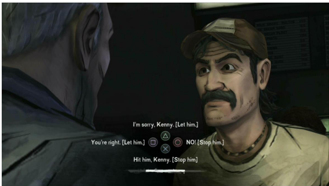
Kuva 2. Valintasarake-osuus pelistä The Walking Dead.

Kolmas osio The Walking Deadin pelimekaniikasta on toimintakohtauksissa käytettävä reagointi-osuus. Esimerkkitalanteessa zombi saattaa hyökätä Leen kimppuun, jolloin pelaajan on painettava pelin ilmoittamaa nappia tietyssä aikarajassa. Jos pelaaja onnistuu, Lee potkaisee zombin pois päältä. Jos hän epäonnistuu, zombi puree Leetä ja pelaajan on yritettävä uudestaan.