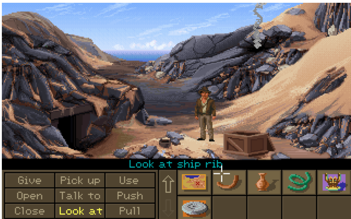
Kuva 1. Indiana Jones and the Fate of Atlantis. Seikkailupeli.

Seikkailupelit ovat videopelien alagenre, jossa pelaaja ottaa protagonistin roolin interaktiivisessa tarinassa. Tyypillisesti seikkailupelit koostuvat lokaatioitten tutkimisesta ja pulmista joita pelaaja selvittää edetäkseen tarinassa.