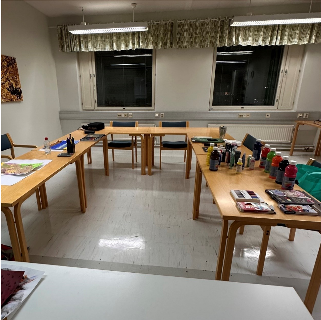
Kuva 1. Ryhmätyötila.

Ryhmäprosessia varten hankittiin riittävät ja laadukkaat materiaalit sekä taide- tarvikkeet ennen ensimmäistä tapaamista. Ryhmään osallistuvilla oli käytös- sään jokaisella tapaamisella erilaisia vesivärejä, maaleja, kyniä, tusseja ja lii- tuja, joita he saivat käyttää mielensä mukaan ilman määrällisiä rajoituksia. Ku- ten kuvataideterapiassa, myös kuvataideterapeuttisessa toiminnassa taide- materiaalien tulee olla korkealaatuisia. Taidetoiminnan harjoittaminen hyvin huolletuilla ja tarkkaan valikoiduilla materiaaleilla viestii kunnioituksesta osal- listujaa kohtaan sekä hänen omaa henkilökohtaista prosessiansa kohtaan. (Leijala-Marttila & Huttula, 2011, s.185.) Näkemykseni mukaan missä tahansa terapeuttisessa toiminnassa ympäristön tulisi olla mahdollisimman seesteinen ja hyvin pidetty, koska tämä luo automaattisesti osallistujalle tunteen siitä, että