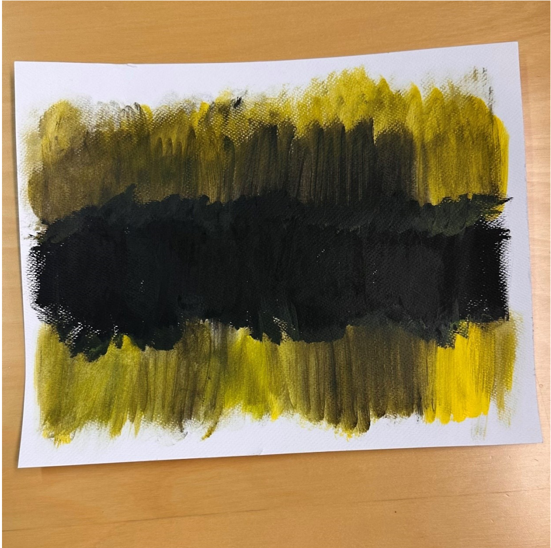
Kuva 6. Ristiriitaiset ajatukset.

Tuokion toisen kuvallisen työn teemana oli itsemyötätunto. Tarkoituksena oli tehdä kuva, joka voisi olla huonolla hetkellä kuin halaus itselle. Ryhmäläisille annettiin tällä kertaa mahdollisuus tehdä kuva pienelle sydämenmuotoiselle maalaus pohjalle, jonka saa taulun tavoin ripustettua vaikkapa seinälle. Molemmat ryhmäläiset valitsivat käyttää maalaus pohjaa.