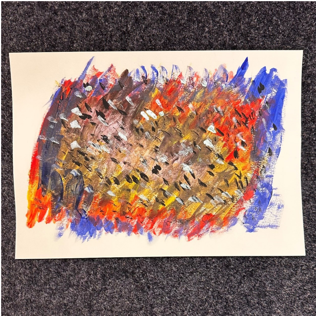
Kuva 2. "Sekahedelmäsoppa".