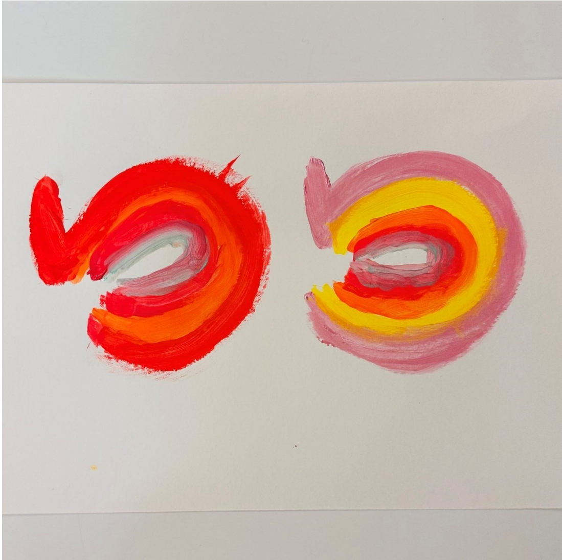
Kuva 8. Omat vahvuudet.

Edellisellä tapaamisella intoa puhkunut ryhmäläinen oli jälleen tuokion loppuksi silminnähdessä riemuissaan ja inspiroitunut. Naurultakaan ei säästyty, kun hänellä tuli kuvastaan jälleen niin hienoja oivalluksia.