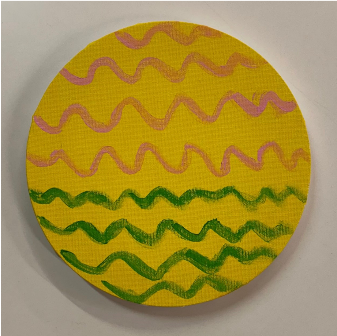
Kuva 11. Kuvaviesti tulevaisuudesta.

Päivän kuvallisen työn ohjeena oli tehdä itselle "kuvaviesti tulevaisuudesta". Ryhmäläisille annettiin jälleen mahdollisuus halutessaan käyttää työhön pientä maalaus pohjaa. Molemmat päättivät jälleen käyttää mahdollisuuden.