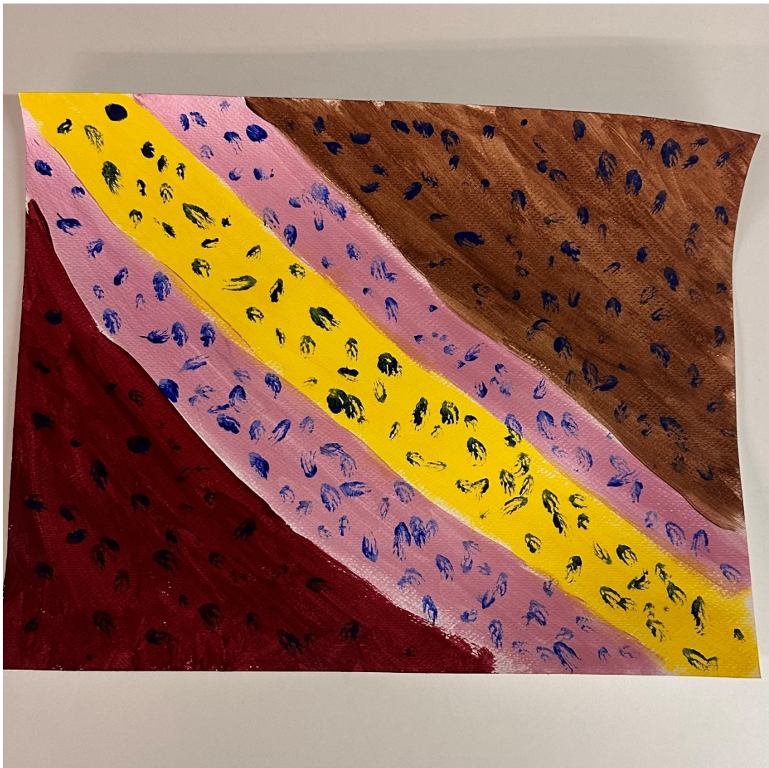
Kuva 9. Ennakkoluuloja, iloa ja valoa.

Todellisuudessa kuitenkin jokainen kanssaihminen näkee meidät todennäköisesti eri tavalla. On tärkeää päästää irti negatiivisesti omaan minäkuvaan vaikuttavista oman pään sisäisistä näkemyksistä. Kuvallisen työskentelyn jälkeen keskusteluosuudessa toinen ryhmäläinen kertoi omasta kuvastaan, joka kuvasi hyvin sitä, miten paljon eri asioita me olemme eri ihmisille. Kuvassa hän kertoo olevan ennakkoluuloja, iloa sekä valoa. (Kuva 9) Hän kertoi myös kuvaan liittyvän esimerkin siitä, kuinka joskus työpaikalla oli tehty harjoitus, jossa piti kirjoittaa positiivisia asioita toistensa selkiin kiinnitettyihin papereihin. Hänen eräs läheisin työkaveri oli kirjoittanut hänen lappuunsa että ”yksi maailman hauskimista ihmisistä”, kun taas etäisempi kollega oli kirjoittanut hänen olevan ”asiallinen”.