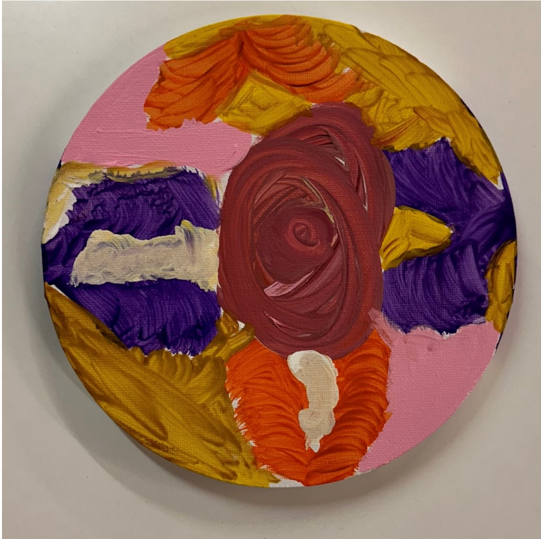
Kuva 12. Kuvaviesti tulevaisuudesta.

Kymmenes, eli viimeinen tapaaminen, alkoi siten, että pyysin ryhmäläisiä muodostamaan kaikista omista prosessin aikana syntyneistä kuvistaan jonon pöydille kronologisessa aikajärjestyksessä. Tämän jälkeen pyysin heitä katsomaan ja pohtimaan omaa Mun mieli -matkaa ja sitä, mitä ajatuksia ja tunteita se nostaa. Hetken pohdinnan jälkeen pyysin heitä tekemään vielä viimeisen kuvan – kuvan tästä kuljetusta matkasta kiitokseksi itselle.