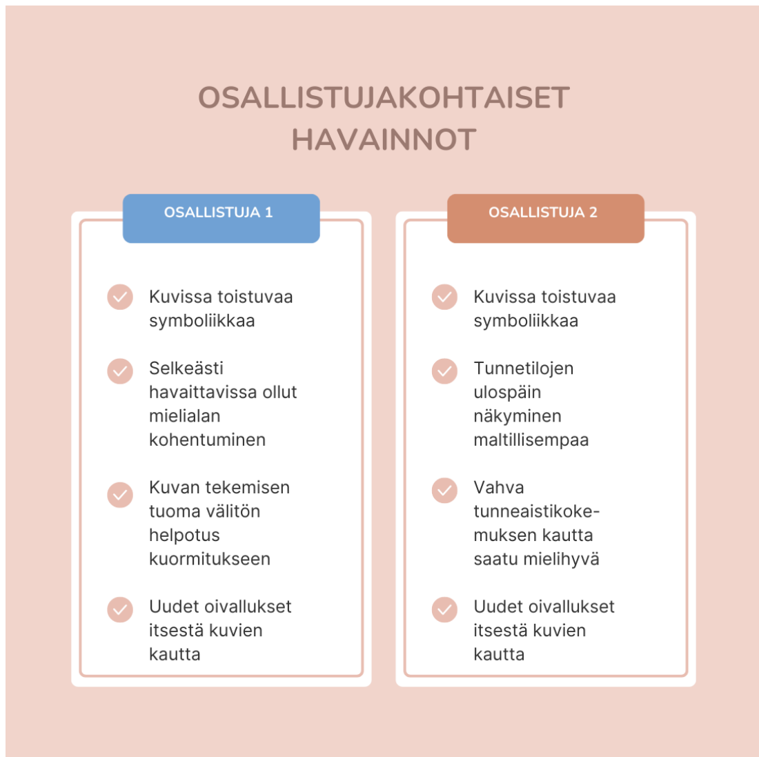
Kuva 13. Havaintojen vertailu.

Aineiston analysoinnin yhteydessä yhdeksi jopa hieman odottamattomaksi kulmakiveksi nousi itse ryhmän merkitys prosessissa. Tiedossa oli toki etukäteen ryhmätyöskentelyn mahdolliset hyötyvaikutukset, mutta koen tämän olevan myös osittain kiinni tuurista. Tuurilla tarkoitan tässä yhteydessä sitä, että toimivatko henkilökemiat yhteen ryhmään sattumalta osallistuvien kesken – toki tässä ryhmässä osallistujien sopivuus varmistettiin vielä alkuhaastattelulla.