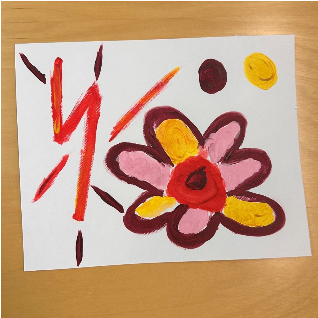
Kuva 5. Supervoimien symbolit.