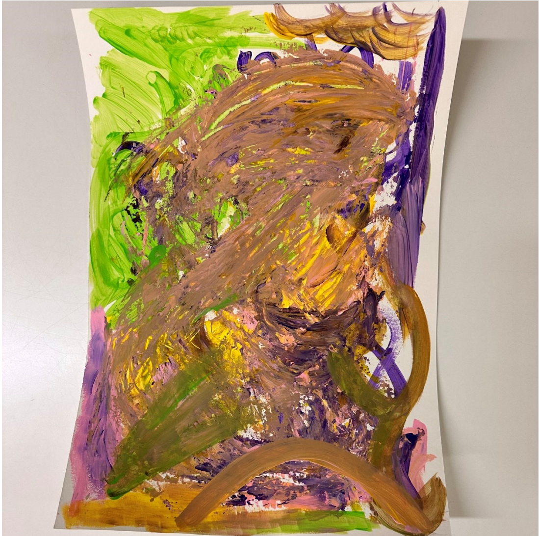
Kuva 10. Lupaus itselle.