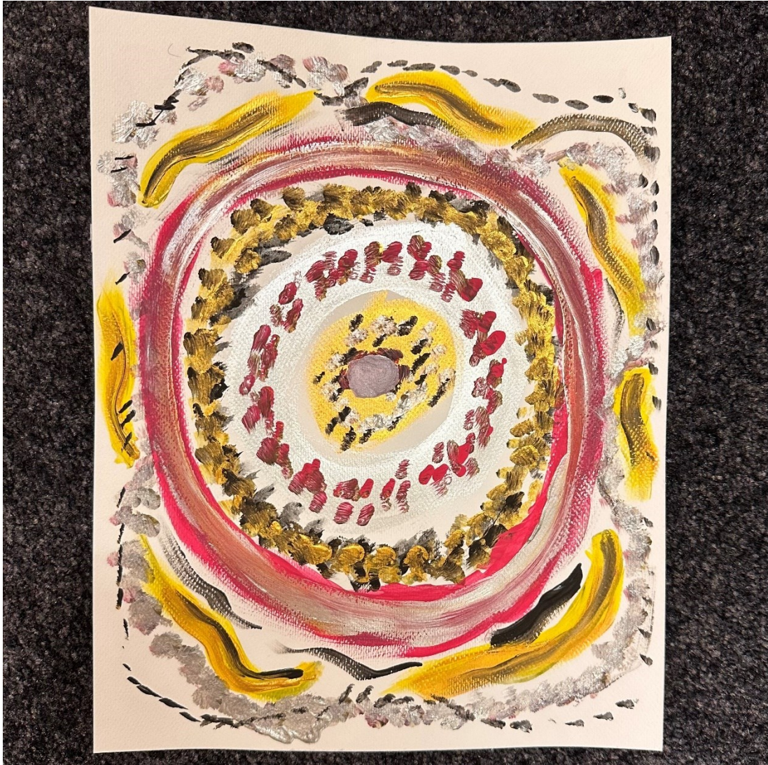
Kuva 4. Minä ja tunteet.

Tapaamisen varsinaisen teeman pohjalta tehdystä kuvasta osallistuja kertoi, että kuva ilmentää tietynlaisia suojaavia kerroksia sekä erilaisia tunteita. (Kuva 4) Osallistujalla on ollut tunneilmaisun kanssa aikaisemmin elämässä haasteita, jonka vuoksi hän on systemaattisesti työskennellyt asian kanssa. Hänen suurin haasteensa on ollut, että hän patoaa tunteita sisälleen, ja jossain vaiheessa ne ryöppyävät ulos hallitsemattomasti ja tunneryöppy on saattanut kohdistua jopa täysin väärään henkilöön. Ryhmäläinen kertoo kuitenkin, että nykyään kun hän tiedostaa asian, osaa hän kertoa ajatuksista ja tunteistaan ajoissa. Lopuksi osallistuja kertoi vielä, että kokee tuokion helpottaneen hänen oloaan merkittävästi. Hän myös totesi, että tämän kaltainen toiminta on oiva ”ensiapu” vaikeisiin tunteisiin, mutta kotona työskentelyyn ryhtyminen on haastavaa.