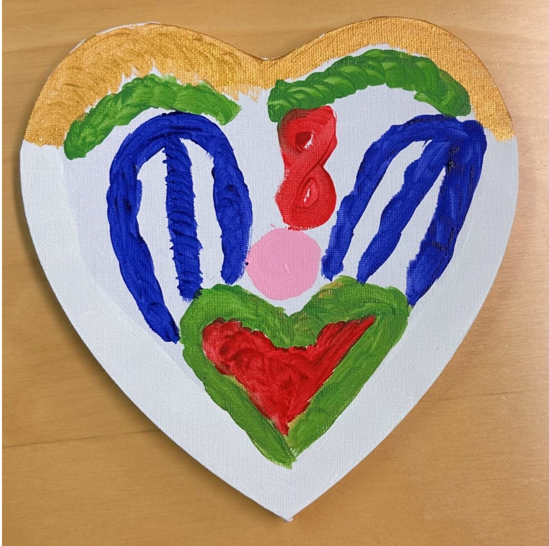
Kuva 7. "Naamari".

monistakin tilanteista voi selvitä. Havaittiin ryhmäläisen olevan aidosti hämmästyneen innostunut siitä, että kuvaan tuli sen enempää yrittämättä jotakin niin tärkeää.