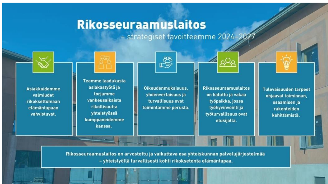
Kuvio 2: Rikosseuraamuslaitoksen strategiset tavoitteet 2024-2027 (Rikosseuraamuslaitos 2024b).

Rikosseuraamuslaitoksen uusi strategia on luotu vuosille 2024-2027. Strategiset tavoitteet on kiteytetty yhdelle sivulle mahtuviksi ja kaikille Rikosseuraamuslaitoksen yksiköille suunnatuiksi. Strategia on rakennettu Rikosseuraamuslaitoksen arvojen ja vision pohjalta. Kaiken toiminnan perustana on oikeudenmukaisuus, yhdenvertaisuus ja turvallisuus. Tulevien vuosien strategisiin tavoitteisiin on kirjattu asiakkaiden valmiuksien vahvistaminen rikoksettomaan elämäntapaan sekä laadukkaan asiakastyön toteuttaminen ja vankeusaikaisen rikollisuuden torjuminen yhdessä yhteistyökumppaneiden kanssa. Strategisiksi tavoitteiksi on määritelty myös, että Rikosseuraamuslaitos on haluttu ja vakaa työpaikka, työhyvinvointiin ja työturvallisuuteen panostetaan, sekä se, että tulevaisuuden tarpeet ohjaavat Rikosseuraamuslaitoksen toiminnan, osaamisen ja rakenteiden kehittämistä. (Rikosseuraamuslaitos 2024b.)