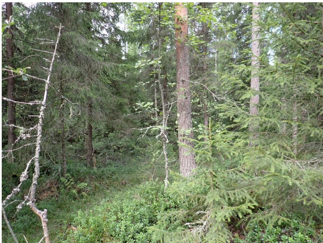
Kuva 17. Koeala 1/61/51/8

usein muun muassa puuston latvusto ei näy kunnolla kuvista ja yleisesti metsikön kokonaisuuden hahmottaminen on vaikeampaa kuvasta kuin maastossa kuvan rajautuessa tietylle alueelle. Tämän vuoksi ei puuston kokonaisvaltaista teknistä laatua, tasaista tiheyttä tai tuhoja pysty kuvista riittävän tarkasti arvioimaan. Koealan eri koinen sekapuusto on myös yksi kuva-arviointia hankaloittavista tekijöistä.