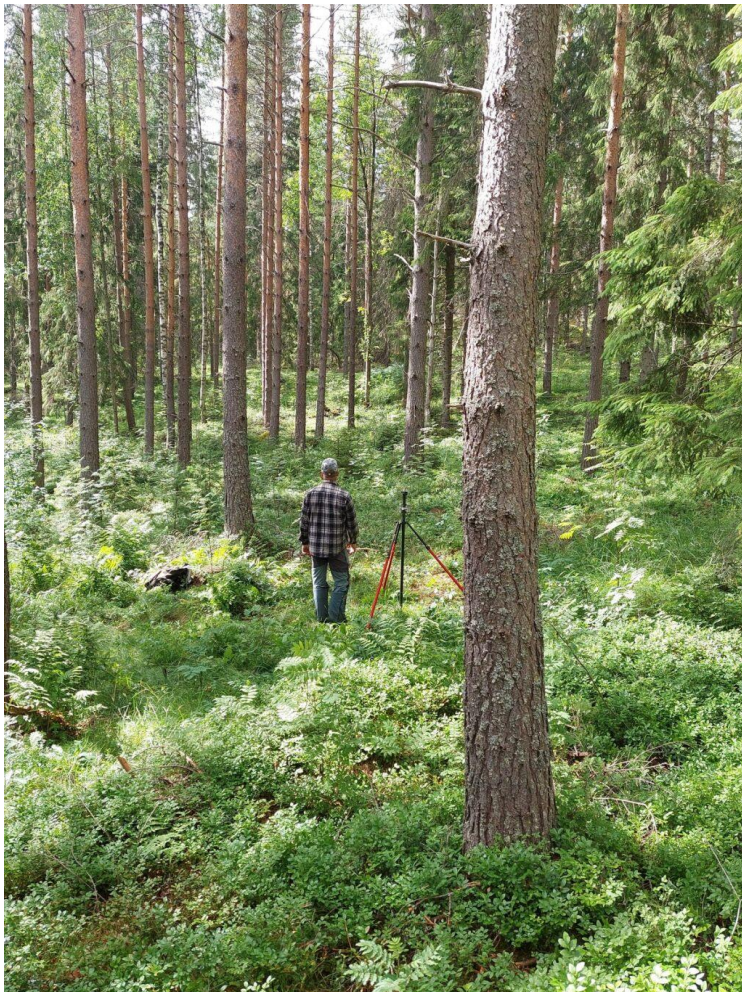
Kuva 10. Koeala 2/36/49/1 (Luonnonvarakeskus)

Vaikka kuvat koealalta on otettu pystysuunnassa, ei eroavaisuuksia ole huomattavasti. Usein pystykuvissa koealaa ei pysty arvioimaan laajasti kapean perspektiivin takia etenkin, jos kuvassa esiintyy paljon sekapuustoisuutta tai muita kuvan tulkitsemista hankaloittavia näköesteitä, kuten oksia, suuria kiviä tai puskia. Pystykuva kuitenkin toimii arvioinneissa hyvin, jos kuvastaa arvioidaan puustoa.