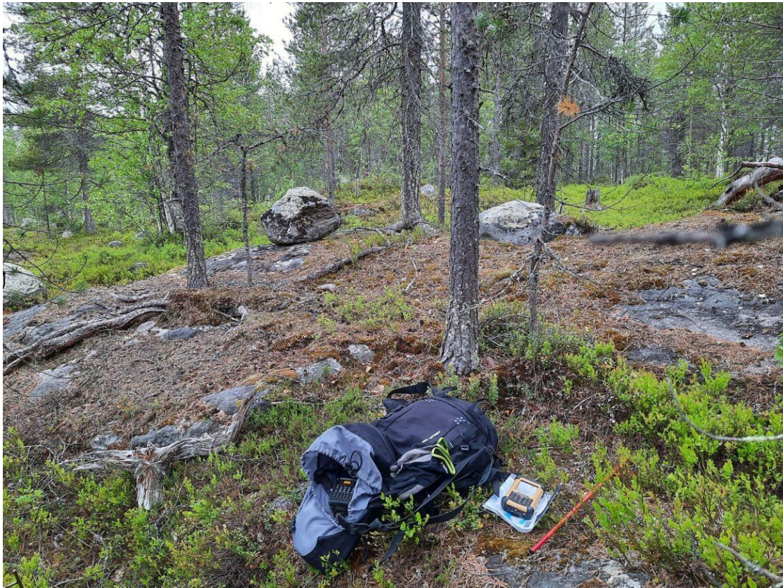
Kuva 5. Koeala 4/111/33/10

Koealan 4/111/33/10 (kuva 5.) kasvupaikan päätyyppi on kuvan 4. esimerkin tavoin kangas. Kuvassa 5. on tunnistettavissa kankaalle tyypillistä kasvillisuutta ja tärkeimpänä kasvupaikan päätyypin tunnistamisen kannalta koealan maaperä on kallioista ja kuivaa, jolloin kyseessä ei voi olla korpi eikä räme. Kuvan 4. koealan valokuva on hyvänlaatuinen ja otettu ohjeistuksen mukaisesti, jolloin kenttäkerroksen näkyvyys on hyvä ja selkeä. (Ohje biodiversiteettimuuttajat VMI-koealoilla) Tällaisilta koealoilta kasvupaikan päätyyppi on tunnistettavissa, toisin kuin esimerkikuvassa 3. Eroavuuksia kuva-arvioiden ja maastoarvioiden välillä tällä koealalla esiintyy metsikön laadussa, joka on maastoarvioinnissa tyydyttävä (2) ja kuva-arvioinnissa välttävä (3) sekä luonnontilaisuuden osalta puuston rakenteessa, joka on maastoarvioinneissa selvästi muuttunut (2) ja kuva-arviossa jonkin verran muuttunut (1).