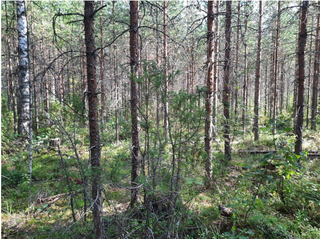
Kuva 25. Koeala 1/33/82/3 (Luonnonvarakeskus)

Luonnontilaisuuden arvioiminen koealan valokuvista onnistuu parhaiten selkeissä ta- lousmetsiköissä (kuva 25.), joissa esiintyy pääasiassa samaa puulajia tasaikäisenä kauttaaltaan. Luonnontilaisuuden arvioinnin kannalta olennaisia huomattavia asioita koealojen valokuvista ovat muun muassa kannot ja korjuutähteet sekä lahoppuuston puute, joita koealan 1/33/82/3 esimerkkikuvassa voi huomata. Puuston rakennetta arvioidaan selvästi muuttuneeksi, jos puusto on tilajärjestykseltään tasainen ja puula- jijakaumaltaan yksipuolinen. Ihmisen toimintaan arvioitaessa kiinnitetään huomiota tehtyihin hakkuisiin. (VMI:n maastotyön ohjeet 2022, ryhmänjohtajat) Tällä koealalla sekä maasto-, että kuva-arvioinneissa nämä arvioidaan selvästi muuttuneiksi (2).