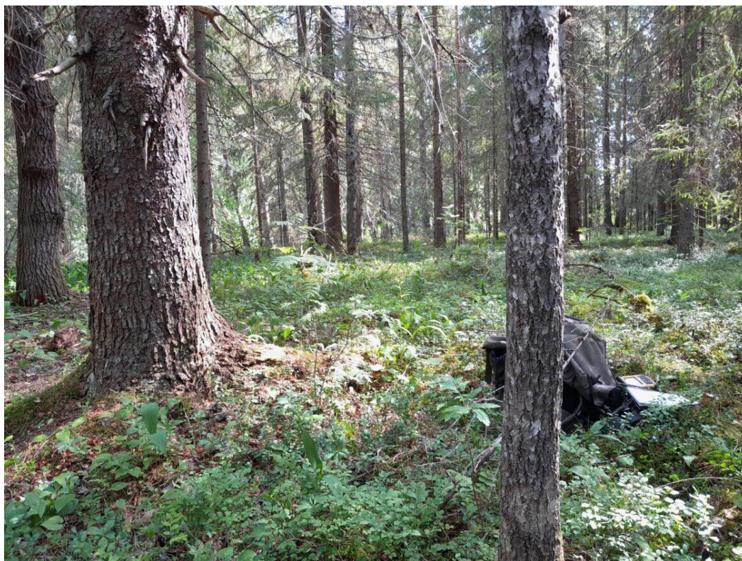
Kuva 2. Koeala 3/584/56/11 (Luonnonvarakeskus)

Maaluokan ollessa metsämaa, sen tunnistaminen onnistuu kuvasta (kuva 2.) hyvin kuvan ollessa selkeä ja siitä on nähtävissä puuston määrä sekä järeys, joka on metsämaalle maaluokan arvioinnissa oleellista. Kenttäkerroksen kasvillisuuden voi myös erottaa kuvasta, joka auttaa kuva-arvioinnissa ja maaluokan tunnistamisessa siten, että kasvupaikan olosuhteet ovat otolliset puuston kasvamiselle.