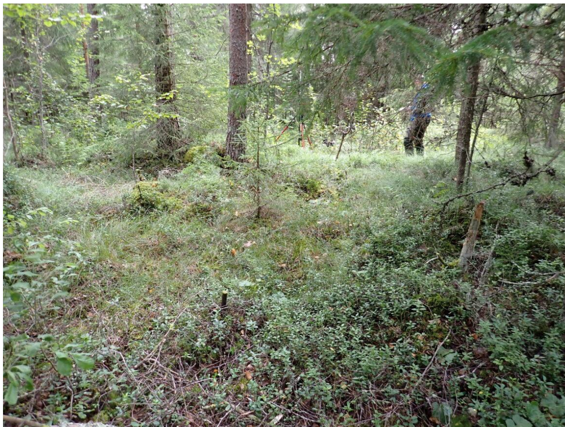
Kuva 18. Koeala 1/61/51/8 (Luonnonvarakeskus)

Koeala (kuva 18.) itsessään on hankala tulkittava sekapuustoisuuden ja puuston erikäisrakenteisuuden takia sekä koealan toinen esimerkkikuva on tekniseltä laadultaan heikompi kuin kuva 17, koska se on otettu hieman alaviistoon, jolloin laatua arvioitavat tekijät puustossa ei ole selkeästi havaittavissa valokuvista.