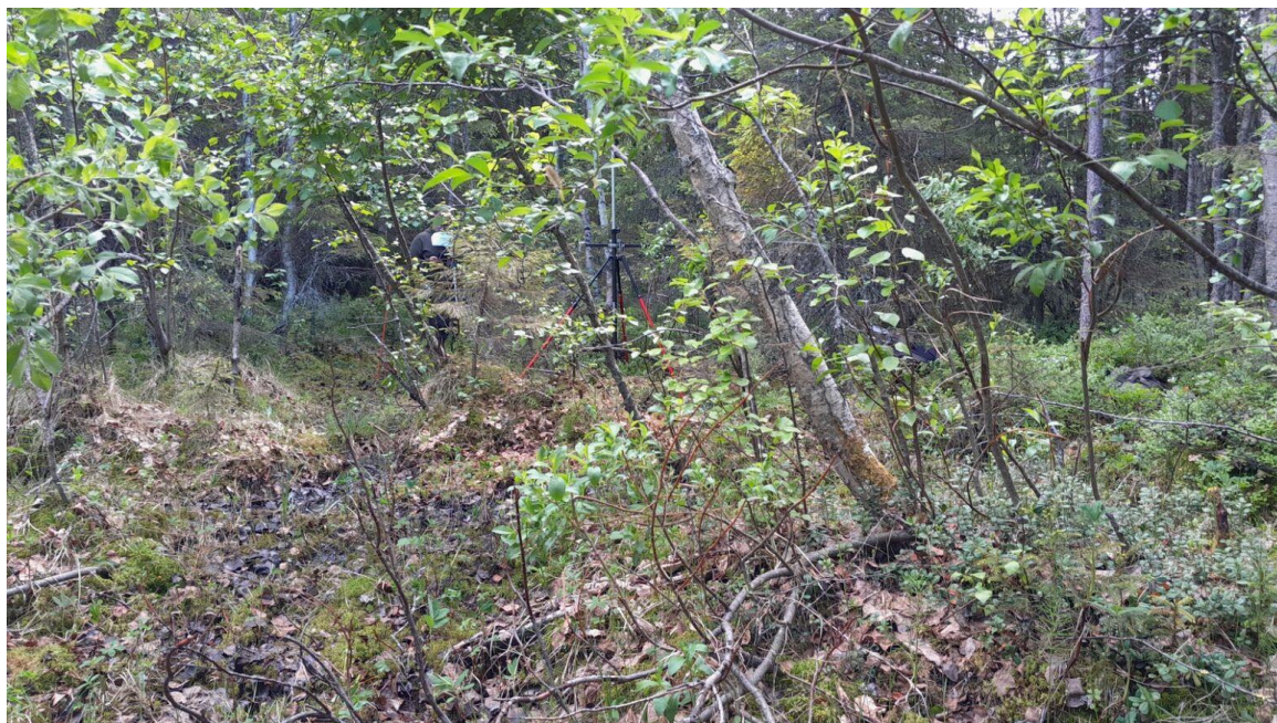
Kuva 24. Koeala 4/103/14/8 (Luonnonvarakeskus)

Luonnontilaisuuden arviointi epäselkeiltä koealoilta (kuva 24.) on haastavaa, koska silloin puuston rakennetta, lahoppuustoa tai ihmisen toimintaa ei pysty kunnolla kuvista erottamaan. Haasteita luonnontilaisuuden arvioimiselle esiintyy esimerkkikuvan koealalla nimenomaan näkyvyyden vuoksi, kun koealalla kasvaa tiheään kasvustoa. Koealalla kuva-arvio luonnontilaisuudelle puuston rakenteen osalta on jonkin verran muuttunut (1), kun taas maastoarvioinnissa puuston rakenne arvioidaan selvästi muuttuneeksi (2) ja lahoppuujatkumo arvioidaan maasto- ja kuva-arvioinnissa samaksi, selvästi muuttuneeksi. Ihmisen toiminnan osalta ilmenee eroavaisuus arvioinnissa, kun se on maastoarvioinnissa selvästi muuttunut ja kuva-arvioinnissa jonkin verran muuttunut.