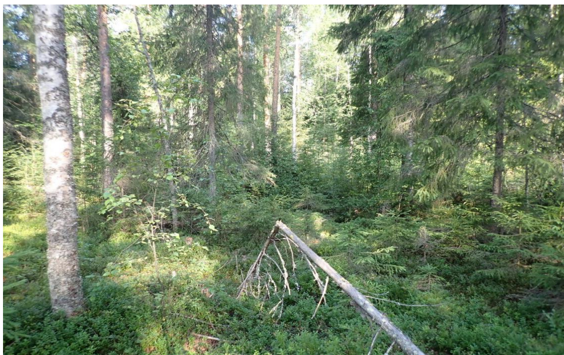
Kuva 19. Koeala 2/35/46/2 (Luonnonvarakeskus)

Tämän koealan kuvasta ei pysty hahmottamaan puuston kokoa tai tiheyttä kokonaisvaltaisesti ja osittain ylivalottuneet kohdat kuvassa eivät ole tarpeeksi tarkkoja metsikön puuston rakenteen havainnoimiseen. Vaikka koealalta tarkasteltuja kuvia on neljä kappaletta, on kuvan syvyyden ja täten puuston koon arvioiminen ja hakkuun ajankohdan arvioiminen haastavaa.