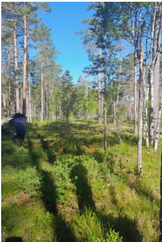
Kuva 22. Koeala 2/42/32/6

Kuva arvioitavalta koealalta (kuva 22.) on otettu pystysuunnassa, eikä kuvasta erotu kunnolla lahoppuut, ajourat tai kannot, jotka ovat maastossa paremmin tunnistettavissa. Kuvan ollessa rakeinen sitä suurennettaessa, se esiintyy haasteena kuvatulkin suorittamiselle. Hyvänlaatuisessa kuvassa ei esiinny pikseleitä sitä suurennettaessa (Saavutettavasti.fi, 2023). Lisäksi koealan metsikön epätasaisuus ja aukkoisuus ovat luonnontilaisuutta arvioitaessa haasteena niiden metsikölle tuomien rakennepiirteiden vuoksi.