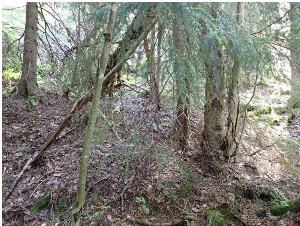
Kuva 13. Koeala 2/10/51/4 (Luonnonvarakeskus)

Muita eroavaisuuksia koealalla maasto- ja kuva-arvioiden välillä ilmenee hakkuuehdotuksessa, joka on maastoarvioinnissa uudistamishakkuu keinollisesti (7), kun taas kuva-arvioinnissa hakkuuehdotusta ei ole, jolloin hakkuun kiireellisyysskin eroaa sen ollessa maastoarvioinnissa ensimmäinen 5-vuotiskausi (2) ja kuva-arvioinnissa ehdotusta ei ole ollenkaan. Luonnontilaisuuden osalta puuston rakenne on maastoarvioinnissa jonkin verran muuttunut (1), kun taas kuva-arvioinnissa kohde arvioidaan selvästi muuttuneeksi (2).