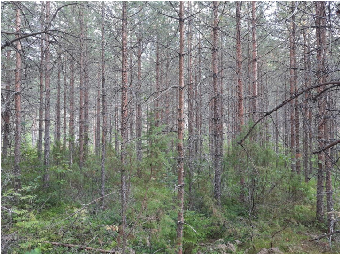
Kuva 12. Koeala 1/33/82/3 (Luonnonvarakeskus)

Kehitysluokan arviointi kuvasta helpoimmaksi osoittautuu sellaisissa nuorissa kasvatusmetsiköissä ja taimikkovaiheen metsiköissä, joissa kuvista on hyvin havaittavissa puuston koko ja latvusto kokonaisuudessaan.