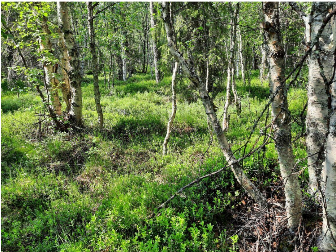
Kuva 7. Koeala 4/115/35/1

Eri kasvupaikoissa voi myös olla samanlaisia piirteitä keskenään, kuten kuivahkon ja tuoreen kankaan kasvupaikkatyypeissä, jolloin kuvien tulkinta hankaloituu. (kuva 7.) Pieniä eroja kasvupaikkaluokitusten välillä ei kuvien avulla pysty tunnistamaan kovinkaan helposti, jotka sen sijaan maastossa erottuisivat mahdollisesti selkeämmin.