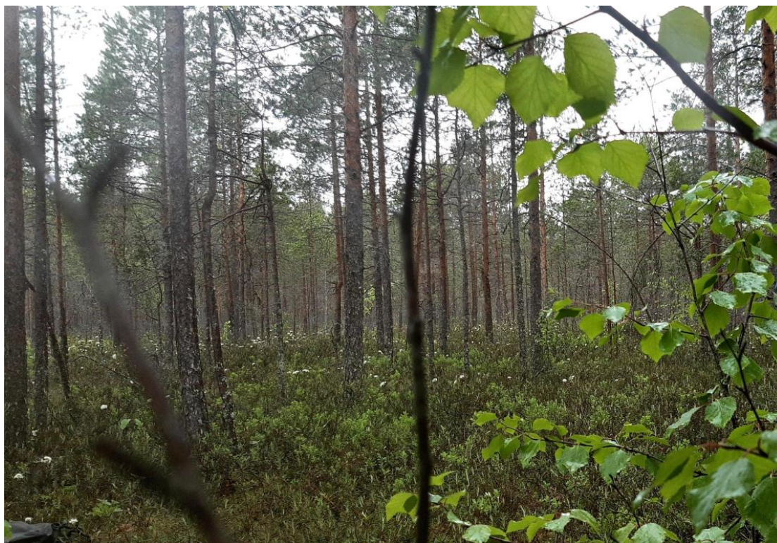
Kuva 14. Koeala 1/60/53/2

Pääpuulajin arvioinneissa koko aineistossa eroavaisuuksia ilmenee kuva-arvioiden ja maastoarvioiden välillä kymmenessä prosentissa koealoista. Ero maasto- ja kuva-arvioiden välillä ei täten ole kovin suuri, joka kertoo siitä, että pääpuulaji on tunnistettavissa suurimmassa osassa koealojen valokuvista.