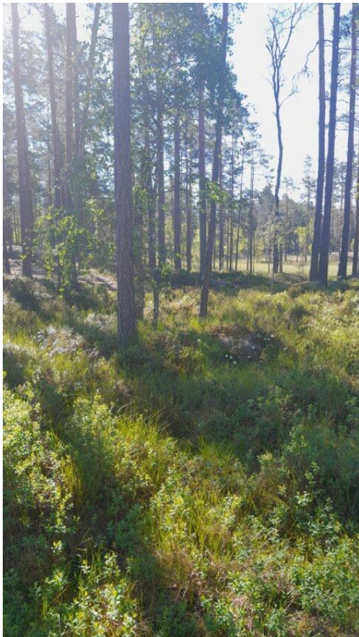
Kuva 23. Koeala 2/42/32/6 (Luonnonvarakeskus)

Koealan toisesta esimerkkikuvasta (kuva 23.) on havaittavissa vaihettumisvyöhykettä kangasmaan ja turvemaan välillä. Kuvasta on hankala tulkita luonnontilaisuuteen vaikuttavia tekijöitä, koska puusto on myös osittain ylivalottunut. Tämän koealan valokuvista on myös hankala erottaa rajaa jonkin verran muuttuneen ja luonnontilaisen kaltaisen välillä, koska valokuvissa esiintyvät luonnontilaiset piirteet ovat suhteellisen kaukaa kuvattuna, eikä pystysuunnassa otettujen kuvien resoluutio ole niin hyvä kuin vaakatasossa otettujen kuvien resoluutio, jolloin kuvia suurennettaessa ne ovat epätarkkoja. (Saavutettavasti.fi, 2023).