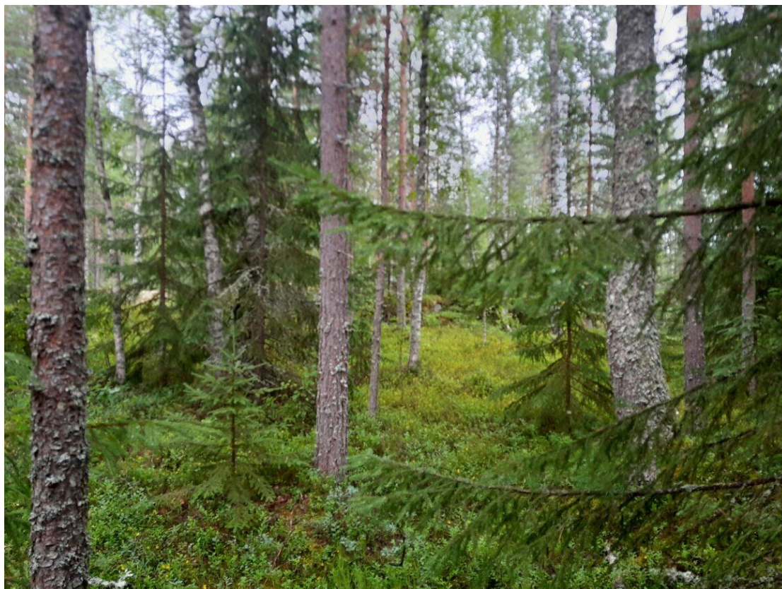
Kuva 15. Koeala 1/40/28/5

kasvavaa puustoa. Tällaiset näkökentän alueella olevat esteet ovat maasto-olosuhteissa tehtävissä arvioinneissa mahdollista kiertää tai siirtää näkökentän alueelta sivuun, jolloin pääpuulajin määrittäminen mahdollisesti helpottuu. Koealalla 1/40/28/5 arvioinneissa ilmenee eroavaisuus pääpuulajissa, sen ollessa maastoarvioinnissa hieskoivu ja kuva-arvioinnissa mänty. Koealan valokuvan epätarkkuus myös osaltaan hankaloittaa kuva-arviointia muiden arvioitavien tunnusten osalta.