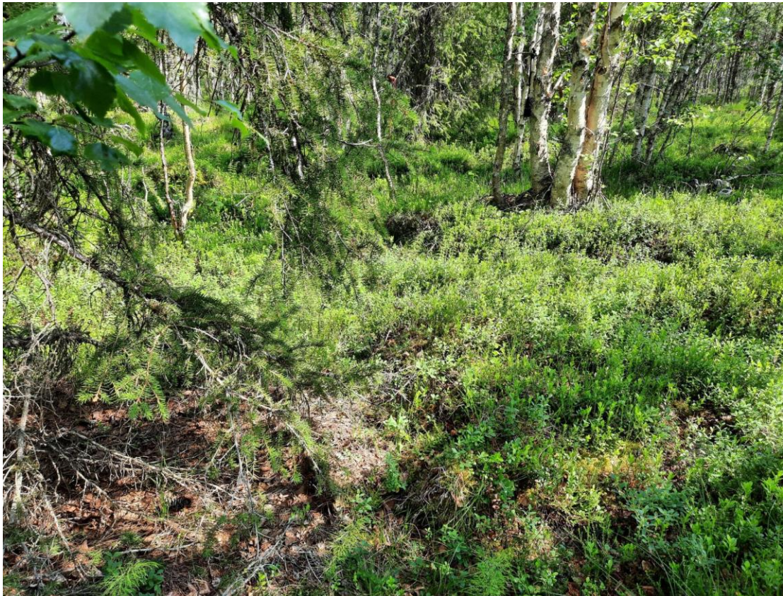
Kuva 6. Koeala 4/115/35/1 (Luonnonvarakeskus)

Kuvan tarkkuus ei ole riittävän hyvä siihen, että siitä voisi tunnistaa pienimpiä kasvilajeja. Kuvat tällaista käyttöä varten tulisi olla otettu pelkästään avainlajiston läheltä, jolloin niiden erottaminen kuvasta olisi mahdollista.