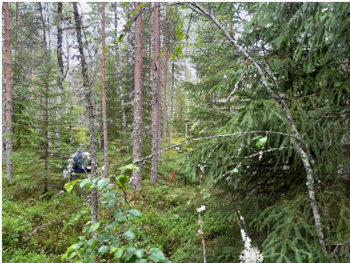
Kuva 16. Koeala 1/40/28/5 (Luonnonvarakeskus)

Pääpuulajin lisäksi koealalla muita eroavaisuuksia maasto- ja kuva-arvioiden välillä esiintyy jaksojen lukumäärän arvioinneissa, sen ollessa maastoarvioinnissa kaksijaksoinen ja kuva-arvioinnissa yksijaksoinen, metsikön laadussa, joka on maastoarvioinnissa välttävä (3) ja kuva-arvioinnissa tyydyttävä (2) sekä hakkuuehdotuksessa, joka on maastoarvioinnissa muu harvennushakkuu (4), kun taas kuva-arvioinnissa kohteelle ei ole ehdotettu hakkuuta ollenkaan seuraavalla 10-vuotiskaudelle. Hakkuuehdotuksen ollessa eri maasto- ja kuva-arvioinnissa, myös hakkuun kiireellisyyden arvioinnit eroavat keskenään.