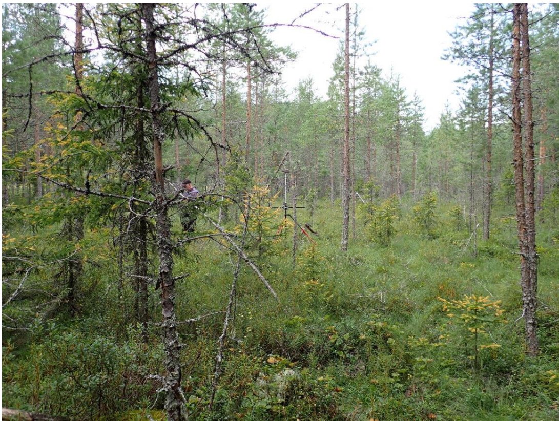
Kuva 3. Koeala 1/61/51/7 (Luonnonvarakeskus)

Hankaluus maaluokan tunnistamisessa koealojen valokuvista ilmenee rajatapauksessa, jossa puuston kasvu ei ole tunnistettavissa selkeästi metsämaan ja kitumaan välillä. (kuva 3.) Maaluokan arvioinneissa ainoa eroavaisuus maasto- ja kuva-arvioiden välillä on koealalla 1/61/51/7, jolla maastoarvio on kitumaa ja kuva-arvio on metsämaa. Metsä- ja kitumaan raja on koealalla melko häilyvä, koska koealan puuston ikää ja kasvua on vaikea valokuvalta tulkita tällaisessa rajatapauksessa. Koealan puusto voisi hyvin olla tulkittavissa nuoreksi puustoksi, joka sijaitsee metsämaalla ja on harvassa kasvava, kuten kuva-arvioinnissa arvioidaan.