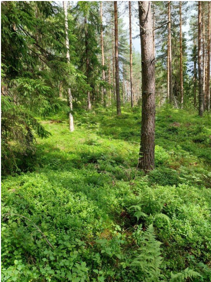
Kuva 9. Koeala 2/36/49/1 (Luonnonvarakeskus)

Koealalla 2/36/49/1 muita eroavaisuuksia arvioinneissa ilmenee metsikön laadussa, joka on maastoarvioinnissa hyvä (1) ja kuva-arvioinnissa tyydyttävä (2), hakkuuehdotuksessa, joka on maastoarvioinnissa harvennushakkuu (4), kun taas kuva-arvioinnissa kohteelle ei ole esitetty hakkuuta seuraavalla 10-vuotiskaudelle. Täten myös hakkuun kiireellisyyden arvioinneissa ilmenee eroavaisuus, kun maastoarvioinnissa hakkuu on ehdotettu toteutettavaksi seuraavan 5-vuotiskauden aikana (2) ja kuva-arvioinnissa kiireellisyyttä ei ole ollenkaan.