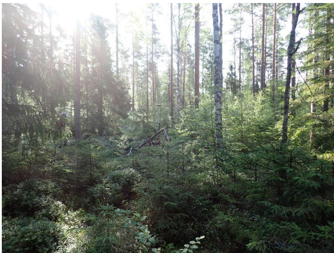
Kuva 20. Koeala 2/35/46/2

Koealan kuvasta (kuva 20.) voidaan huomata epätasaisuutta kasvatettavan puuston tiheydessä, joka osaltaan on vaikuttava tekijä sille, ettei hakkuuehdotusta kuva-arviossa ole ollenkaan seuraavalle kymmenelle vuodelle.