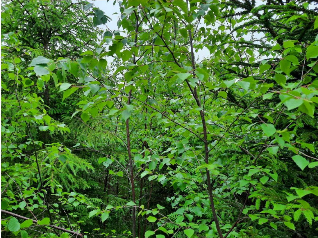
Kuva 8. Koeala 2/36/94/2

Kasvupaikan tunnistamisessa haasteena ilmenee myös koealat, joilla kenttäkerroksesta ei erota kasveja ollenkaan. (kuva 8.) Tällaisilta koealojen valokuvilta kasvupaikan arvioiminen on voi käytännössä onnistua vain arvaamalla, joka ei anna lopputuloksen kannalta kovinkaan tarkkaa tulosta.