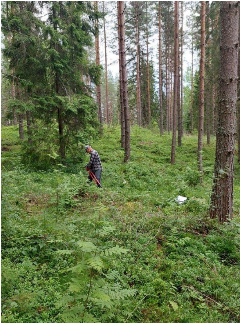
Kuva 11. Koeala 2/36/49/1 (Luonnonvarakeskus)

Koealan 2/36/49/1 toinen esimerkkikuva (kuva 11.) on ensimmäisen esimerkkikuvan tavoin selkeä ja siitä on nähtävissä vallitseva puusto ja sen tasainen ikärakenne, jolloin jaksojen lukumäärä on arvioitavissa valokuvalta. Valokuva on laadultaan hyvän ollessa tarkka ja luonnollisesti valottunut. (Magix.com, n.d.)