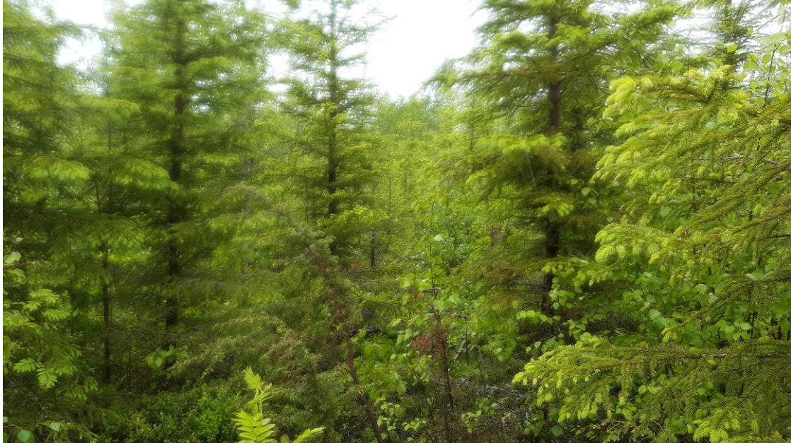
Kuva 4. Koeala 1/60/53/3 (Luonnonvarakeskus)

mättä kovin selkeitä, on myös mahdollista arvioida maastotunnuksia tarkasti. Kenttäkerroksessa esiintyy kankaille tyypillisiä lajeja, kuten mustikkaa ja katajaa eikä aluskasvillisuudesta yli 75 prosenttia ole suokasvillisuutta. (VMI:n maastotyön ohjeet 2022, ryhmänjohtajat.)