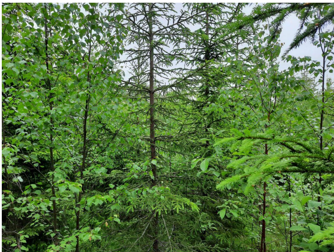
Kuva 21. Koeala 2/36/94/2

Hakkuuehdotus ja hakkuun kiireellisyyden arviointi osoittautuu helpoimmaksi taimikkovaiheen metsiköistä. Koealan valokuvasta (kuva 21.) on havaittavissa metsänhoidollinen tarve, joka tämän ikäisessä puustossa on taimikonhoito. Kiireellisyys on arvioitavissa taimikkovaiheen metsiköistä hyvin, kun kuvasta voidaan havaita kasvatettavien taimien vieressä kasvava lehtipuusto ja sen tiheys. Taimikkovaiheen puustosta saadaan myös tulkittua koealalla kasvavan puuston läpimitta, kun taas myöhempien kehitysvaiheiden puustosta se on hankalampaa, kuten kuvasta 20. voidaan huomata.