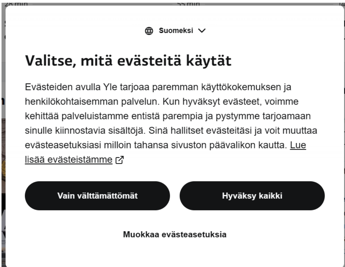
Kuva 3: Evästeikkuna Ylen verkkosivuilla.

GDPR:n mukaisesta evästeikkunasta tulee olla yhtä helppoa hyväksyä evästeiden käyttö kuin kieltäytyä niistä (Kyberturvallisuuskeskus 2021). Evästeikkunassa olevien ”Hyväksy kaikki” ja ”En hyväksy” tai ”Hyväksy vain pakolliset evästeet” painikkeiden tulee olla samanlaisia. Painikkeiden ei tulisi erota kooltaan, asettelultaan tai väreiltään toisistaan. Evästeikkunassa tulisi olla myös mahdollisuus asetuksien kautta vaikuttaa hyväksyttäviin evästeisiin. (Tietosuojakeskus 2024.) Esimerkiksi Ylen verkkosivuilla eteen tulee evästeikkuna, jossa on vaihtoehtoina ”Hyväksy kaikki” ja ”Vain välttämättömät”. Halutessaan sivulla kävijä voi myös valita, mitä evästeitä hyväksyy ja mitä hylkää ”Muokkaa evästeasetuksia” -painikkeen takaa. Evästeikkunassa kerrotaan kerättävien tietojen käyttötarkoitus ja annetaan käyttäjälle selkeä vaihtoehto sekä mahdollisuus lukea linkin takaa lisää Ylen käyttämistä evästeistä.