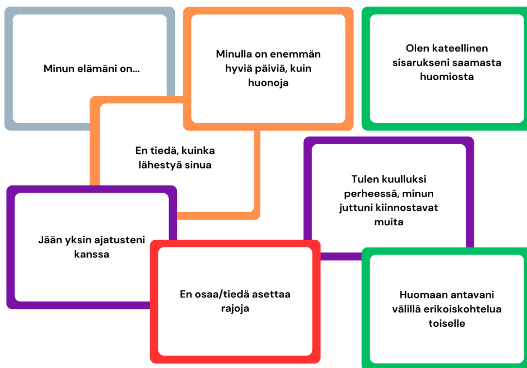
Kuva 1: Esimerkkejä keskustelukorteista.

olla haastavaa keskustella itse ääneen. Korteissa oli erillinen kokoelma avoimia lauseita, erilaisia väittämiä ja toteamia sekä kysymyksiä.