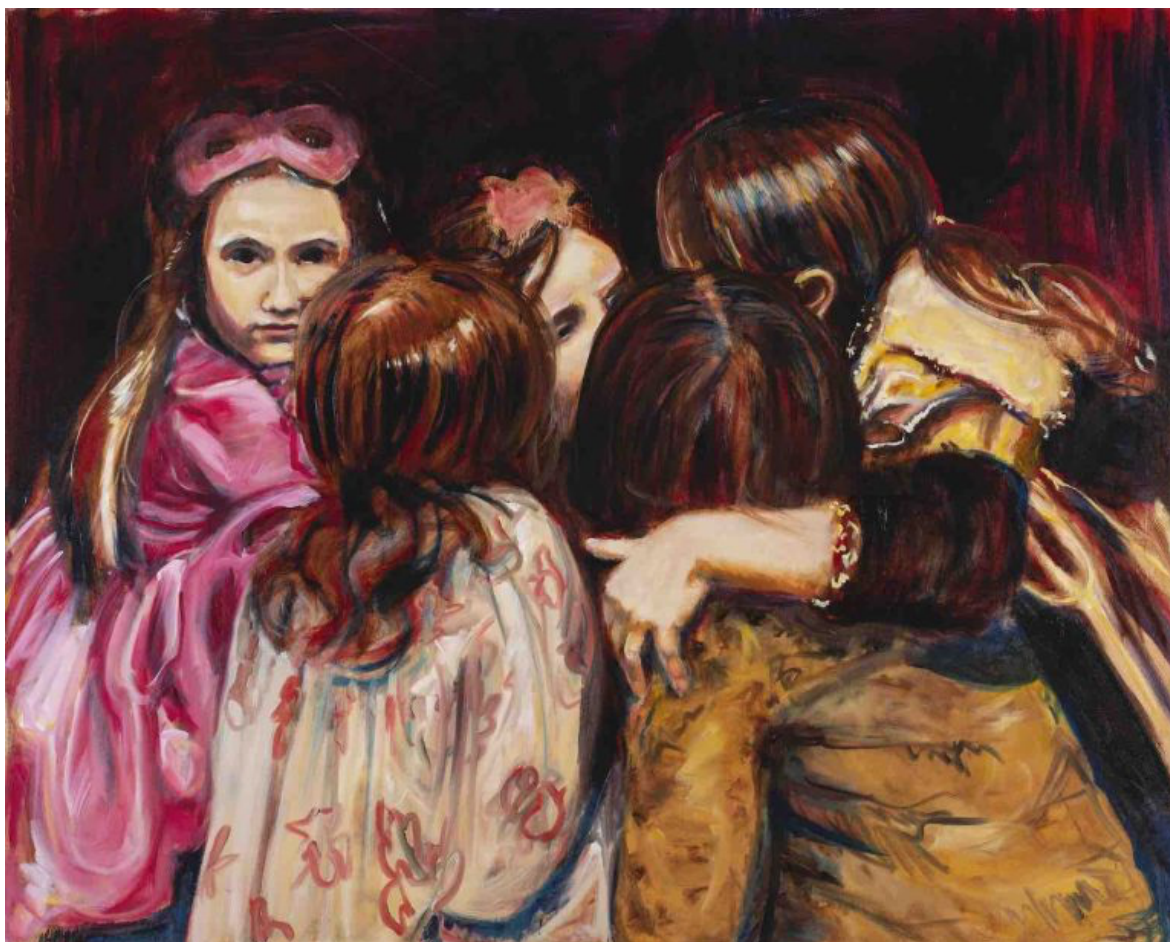
Kuva 1. Ferrouge, Huddle, 2016, öljyvärимаalaus kankaalle (Hernandez b)

Suomalaisista moderneista kuvataiteilijoista tyttöyttä on käsitellyt kuvataiteilija ja sarjakuva-piirtäjä Riina Tanskanen. Tanskanen tunnetaan Tympeät Tytöt -instagram-tilin luoja (Kuva 2). Tilin taideteoksia täydentävät Tanskasen kirjoittamat miniesseet kuvien ohessa. Tympeät tytöt merkitsee Tanskaselle yleisistä kokemuksista kertomista, eikä tarkoitus ole edustaa taiteilijaa itseään tai muutakaan tiettyä henkilöä. (Onali 2023.) Teoksissa käsitellään feministisestä näkökulmasta tyttöyttä 2020-luvulla, johon kuuluu mm. ulkonäköpaineita, väheksyntää ja epätasa-arvoa. Tanskanen käsittelee teoksissaan lisäksi seksuaalisuutta ja yhteiskunnallisia ongelmia kuten rasismia (Sarjakuvafestivaalit).