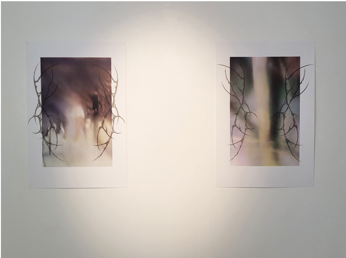
Kuva 11. Valmiit teokset ripustuksen jälkeen