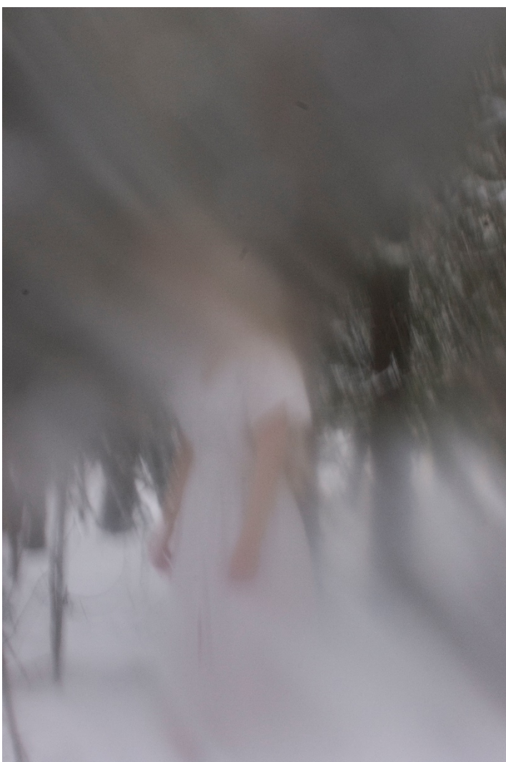
Kuva 4. Luonnoskuva

Valkoinen on perinteisesti symboloinut viattomuutta ja puhtautta, ja uskonnollisessa näkökulmassa se yhdistetään jumaliin ja taivaaseen (Riihimäen Taidemuseo a). Mieleeni tuli ajatus käyttää kaikissa kuvissa lähtökohtaisesti samoja värejä, jotta kuvat sointuvat yhteen. Alkuperäisessä ideassani tyttö/nainen oli uhrin asemassa, ja ohjaajani heitti minulle ajatuksen kuvata tyttö/nainen myös sellaisessa asetelmassa, josta ei käy selkeästi ilmi onko tämä uhri ja kohde vai sittenkin jotain muuta. Tämä ajatus sopi hyvin yhteen myös inspiraationa käyttämieni kauhuelokuvien kanssa. Valkoisen värin rinnalle aloin yhä vahvemmin kuvitella punaista väriä. Punainen on nähty vaaran värinä ja se on lisäksi yhdistetty kristinuskossa paholaiseen (Riihimäen Taidemuseo b). Punainen on toki myös veren väri, jonka koin puolestaan liittyvän kuukautisiin sekä väkivaltaan.