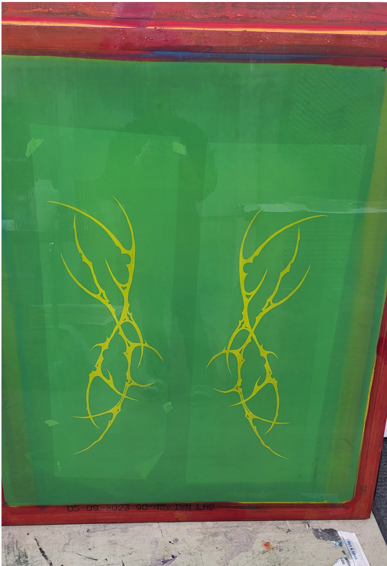
Kuva 8. Kuviot valotettuna seulaan

Halusin kuvioiden sointuvan kuvien värimaailmaan ja suunnitelmani oli siksi vedostaa tavallisella mustalla. Vedosten päällä musta väri tuntui kuitenkin liian vahvalta ja kuvaa häiritsevältä (Kuva 9), joten lisäsin mustan sekaan reilusti printing mediumia, jolloin sain mustasta tarpeeksi läpikuultavan. Läpikuultava musta ei ollut yhtä vahva, ja kuviot tuntuivat näin tulevan paremmin osaksi kuvaa (Kuva 10).