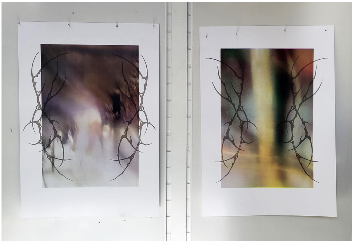
Kuva 10. Testejä kuvioista läpikuultavalla mustalla

Halusin nimetä teokseni ajatuksella ja niin, että nimet merkitsivät jotakin. Kokosin listaa kaikista mahdollisista nimistä, joita mieleeni tuli. Minua viehätti ajatus toisen teoksen nimeämisestä jollakin numerosarjalla ja toisen jollakin pidemmällä lauseella. En halunnut nimetä teoksia liian selkeästi niin, että ne kertoisivat kuvista tai aiheesta liikaa. Halusin jättää tulkinnanvaraa.