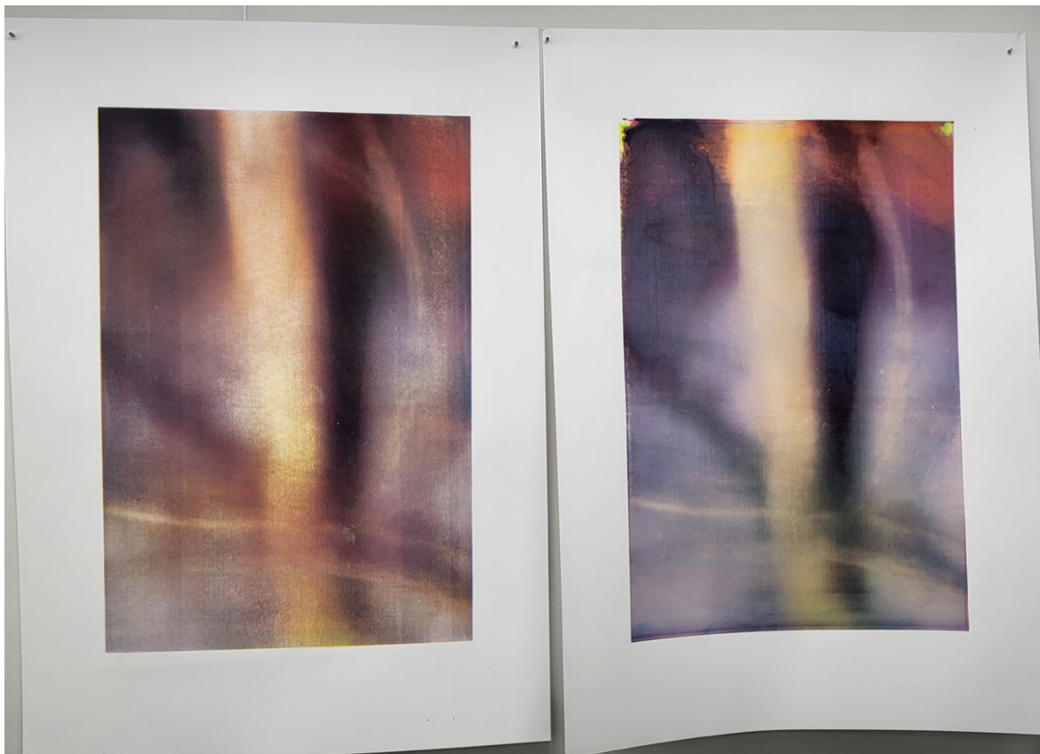
Kuva 6. Kokeiluja eri väreillä ja vedostusvirheet

painopöydältä kuivausreikkiin täytyi tehdä hallitummin. Kuivausreikki oli suurimman osan ajasta melko täynnä myös muiden vedoksia, joten minun täytyi nostella isoja paperiarkkeja melko korkealle. Tästä moniin vedoksiin aiheutui taitoksia reunoihin.