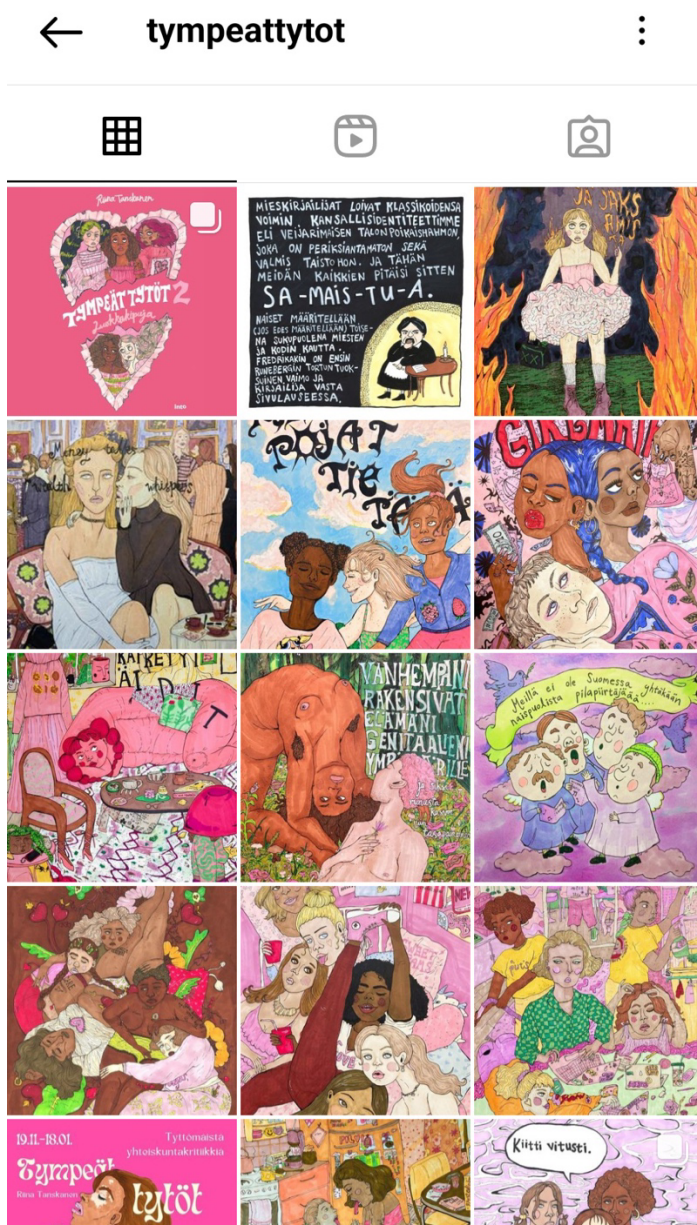
Kuva 2. Kuvakaappaus Tympeät Tytöt -tilistä