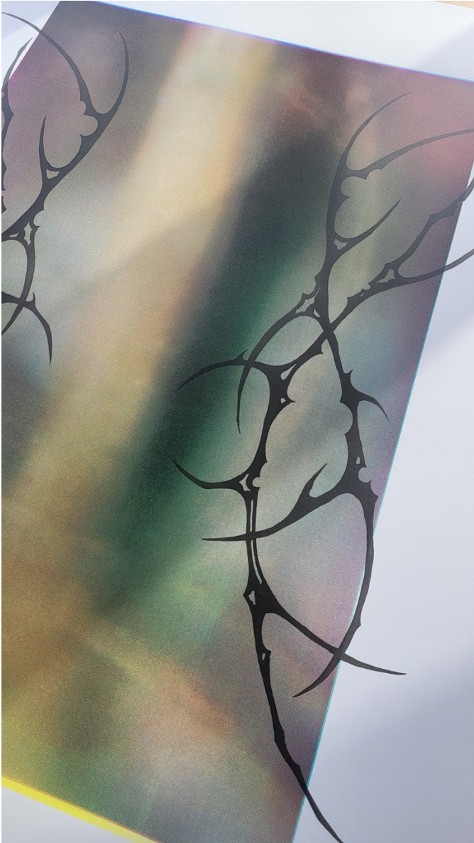
Kuva 9. Testi kuvioista mustalla värillä