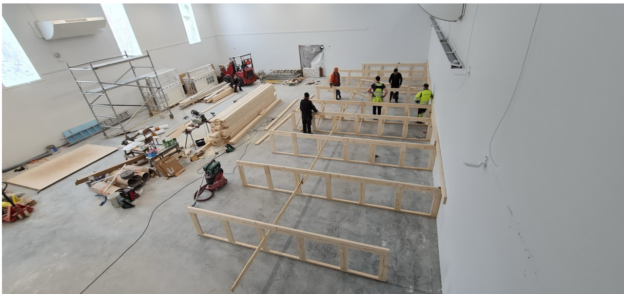
Kuva 1. Tuomiojan Nuorisoseurantaloon rakennus.

Seurantaloilla on merkittävä rooli myös seurojen toiminnan kannalta. Haastatteluissa nousi esille, että seurantalo on monelle toimijalle syy toiminnan jatkumiseen, hyväkuntoinen talo halutaan pitää elinvoimaisena ja käytössä. Koveron Nuorisoseura totesi, että ilman seurantaloa olisi heidän toimintansa mahdollisesti hiipunut jo aikoja sitten. Valmiit tilat omasta takaa kuitenkin mahdollistavat toiminnan ja innostavat jatkamaan. Talo on monelle seuralle myös tärkeä tulonlähde vuokratulojen kautta. Haastatteluissa seuroissa yksi yleisin vuokralainen seurojentaloilla on paikallinen kansalaisopisto, jonka erinäiset harrastusryhmät hyödyntävät tiloja viikoittain. Ulkopuolisten vuokraajien tapahtumiksi Nuorisoseurat luettelevat haastatteluissa mm. juhlat, harrasteryhmät, kokoukset, leirit, konsertit ja teatteriesitykset. Seurantalot siis tarjoavat myös muille toimijoille mahdollisuuden toimintansa toteuttamiseen. Talot ovat ainutkertaisia kokonaisuuksia ja monella alueella ainoita tarpeeksi suuria taloja mm. juhlien järjestämiseen. Haastatteluista seuroista jokaisen talo mahdollistaa vähintään 150 hengen tapahtumien järjestämisen. Vastaavia tiloja, jotka olisivat käytössä ympäri vuoden ja tarpeeksi suuria ja joista löytyisi yhtä hyvät tilat ja varustelut, ei haastateltavien seurojen läheltä löydy.