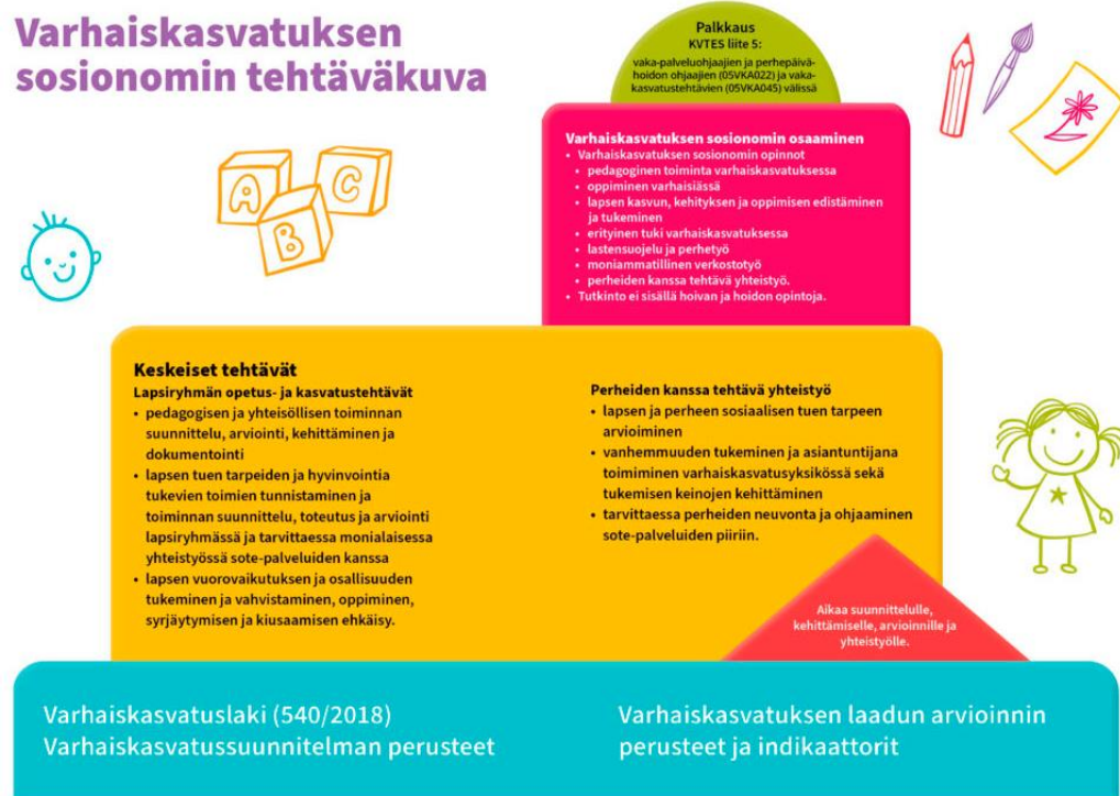
Kuvio 3: Varhaiskasvatuksen sosionomin tehtäväkuva (Talentia 2024).

moniammatillinen verkostotyö, jossa ollaan yhteydessä eri sote-palveluihin. Perheiden kanssa tehtävä yhteistyö, jossa arvioidaan lapsen ja perheen sosiaalisen tuen tarvetta, perhettä neuvotaan sekä ohjataan sote-palveluiden piiriin. (Talentia 2024).