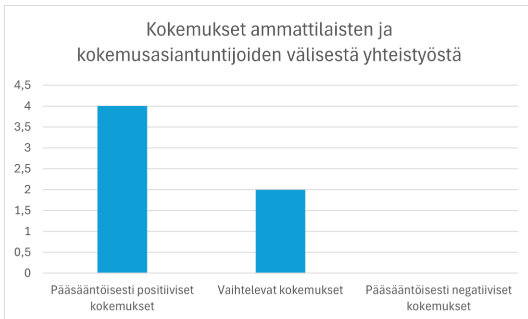
Kuvio 2. Alkuperäisartikkeleissa esiintyvien kokemusten lukumäärällinen jakauma