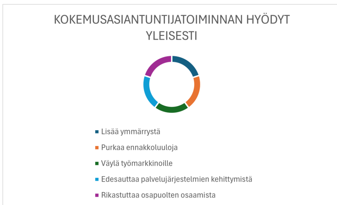
Kuvio 3. Kokemusasiiantuntijatoiminnan höydyt yleisesti