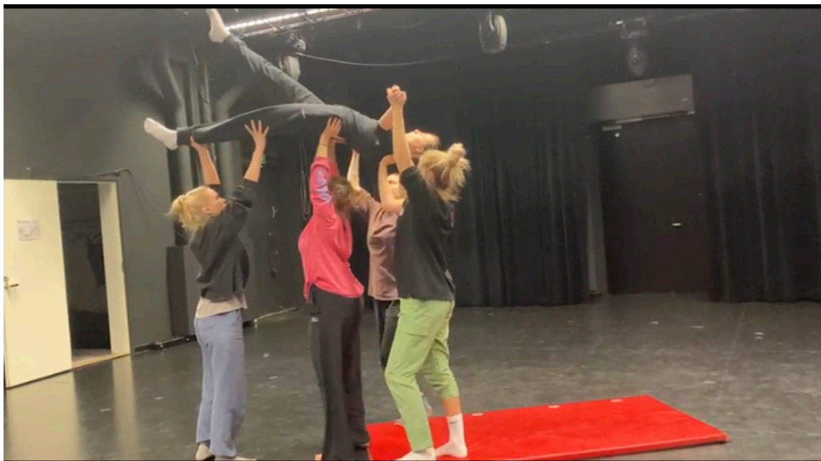
Kuva 3. Toiseen kohtaukseen sisältyi nosto, jota harjoiteltiin paljon ajan kanssa (Kokkonen 2024).

Kuten mainitsin luvun alussa, muusikoiden harjoitukset poikkesivat paljon tanssijoiden harjoituksista. Koska soitimme cover-kappaleita, ja olin päättänyt, että soitamme kappaleet alkuperäisten mukaan, jokaisella muusikolla oli mahdollisuus harjoitella omaa osuuttaan valmiin nauhoitteen kanssa itsenäisesti. Tekemistäni nuottilapuista he pystyivät lukemaan kappaleisiin tulleet mahdolliset rakenteelliset muutokset. Tästä syystä muusikoiden harjoituksissa keskityimme enemmän yhteissoiton hiomiseen ja käytimme aikaa joidenkin vaikeampien kohtien harjoitteluun. Teimme myös yhdessä sovituksellisia ratkaisuja. Päätimme esimerkiksi kuka soittaa tietyt kosketinsoitinosiot, joita minä en kyennyt itse soittamaan (luku 7.2).