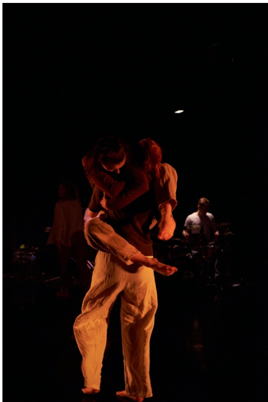
Kuva 2. Kolmannen kohtauksen kappaleen sanojen teema peilautui koreografiaan esimerkiksi toisen syliin hyppäämisenä (Hintsala 2024).

Voisiko sanallisellakin sisällöllä olla vaikutusta esiintyjien ja katsojien väliseen kinesteettiseen aukkoon? Musiikin sävelkorkeus, rytmi ja laatu saavuttavat katsojan tunteet, mutta sanat tavoittavat myös ajatukset. Teksti voi myös saada katsojan näkemään tanssin sanallisen sisällön mukaan. (Preston-Dunlop 2014, 162.) Eli sen lisäksi, että musiikki ja liike vahvistavat toisiaan ja luovat kokonaisuuden, myös sanojen kuuleminen voi vahvistaa katsojan kokemusta ja tulkintaa siitä mitä hän näkee.