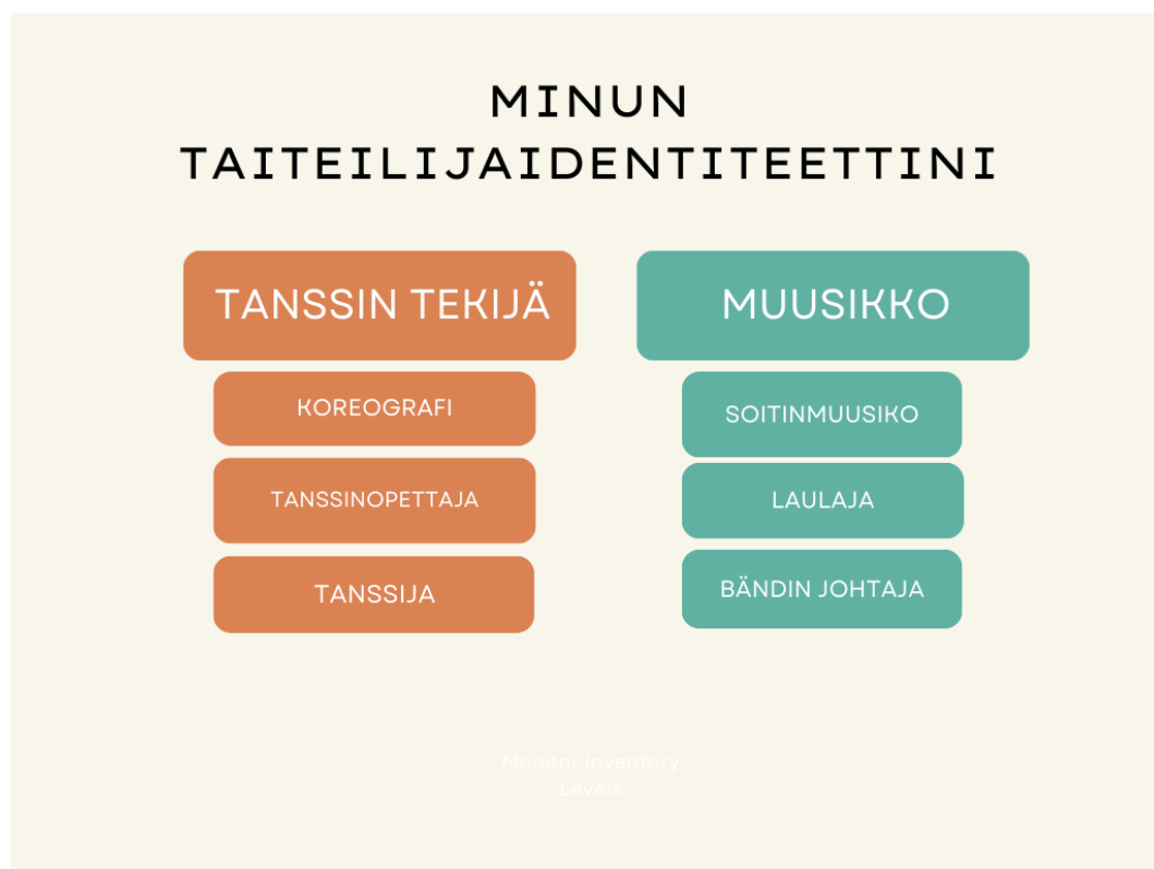
Kuva 1. Havainnollistava kuva oman taiteilija identiteettini osista (Kokkonen 2024).

toteaa myös, että nämä eri tavat lähestyä tanssia voivat auttaa ymmärtämään tanssia ja sen tekemistä monipuolisemmin. Ennen Jos voisin...-teosta, en koe kyenneeni hahmottamaan kuinka nämä kaksi roolia, muusikko ja tanssin tekijä, vaikuttivat ja keskustelivat toistensa kanssa. Kuitenkin teoksessa minulla oli hyvin konkreettisesti molemmat roolit esillä toimiessani sekä koreografina että muusikkona ja jouduin tietoisesti työstämään roolien vuorovaikutusta. Näin onnistuin mielestäni löytämään kokonaiskuvan omasta taiteilijaidentiteetistäni.