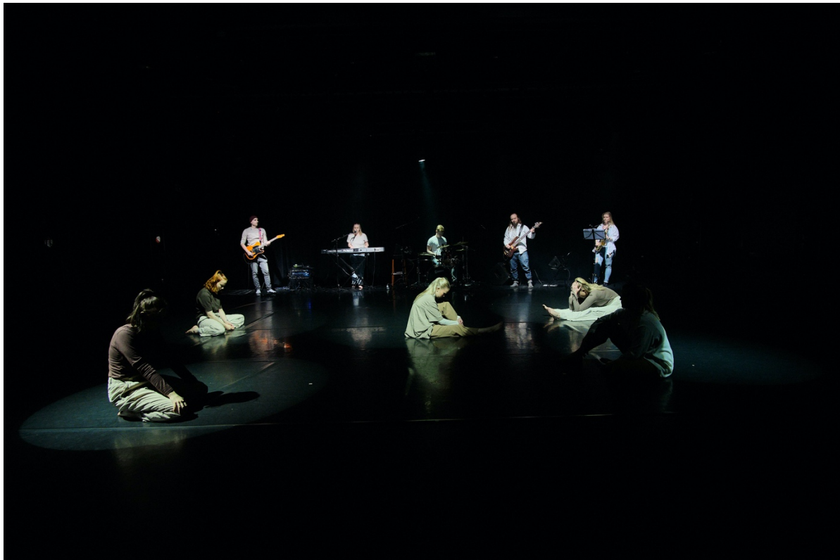
Kuva 4. Muusikot vaaleissa vaatteissa, rivissä lavan takaosassa (Hintsala 2024).

alaistin pitkään tätä ratkaisua. Jos tarkoituksenani oli tuoda lavalle muusikot ja tanssijat tasa-arvoisina osina teostani, toteutuiko tämä ajatus, jos tanssijat tulisivat olemaan konkreettisesti muusikoiden edessä? Päätin, että jokaisella muusikolla oli vaaleat vaatteet, jotta emme sulautuneet takaseinällä olevaan mustaan verhoon (kuva 4). Rivi-muodostelma teki bändistä myös yllättävän suuren elementin lavalle.