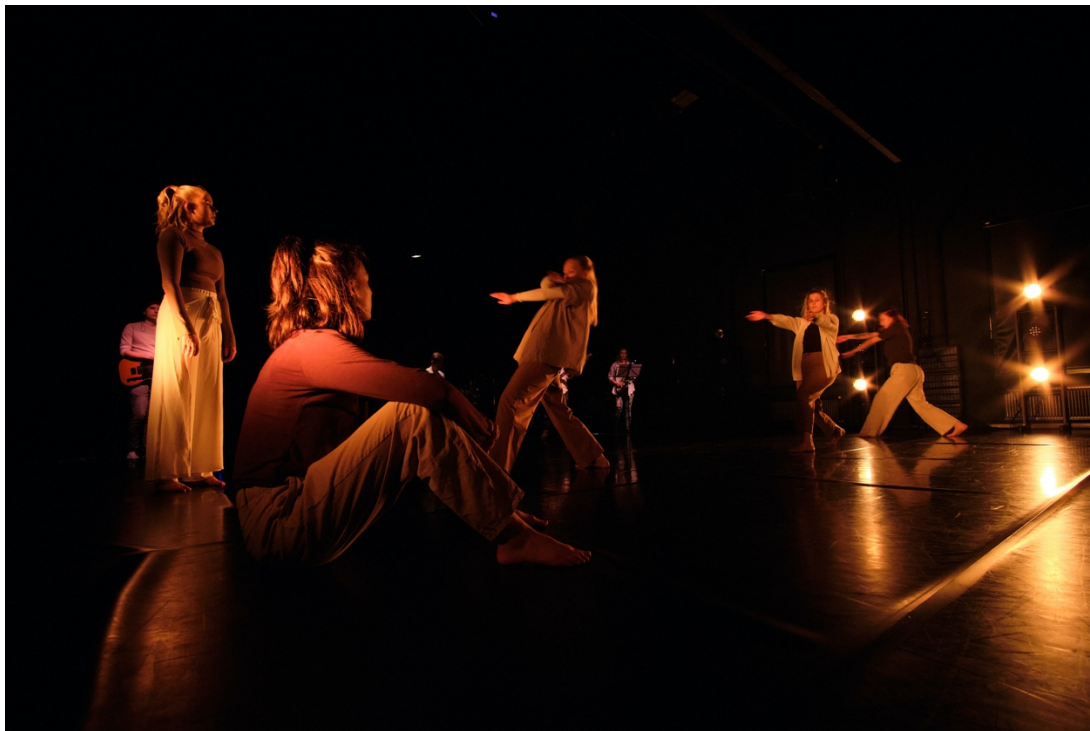
Kuva 5. Kaksi tanssijaa pysähtyneenä tarkkailemassa muiden tekemistä (Hintsala 2024).

Neljäs elementti oli jo kävelypelissä mainittu muiden tarkkailu. Koko kohtauksen ajan tanssijoilla oli lupa pysähtyä, istuen tai seisten, ja vain katsoa muiden tekemistä (kuva 5). Tämä liittyi myös keholiseen reflektioon, sillä myös pysähtyminen saattoi olla tarpeellista tanssijoiden kehoille. Kun kukakin ryhmän jäsen sai itse päättää, milloin liikkui, myös kohtauksen dynamiikkaan tuli luontevia muutoksia. Välillä lavalla saattoi olla useita päällekkäisiä tapahtumia, mutta ajoittain vain yksi tanssija saattoi liikkua muiden katsoessa.