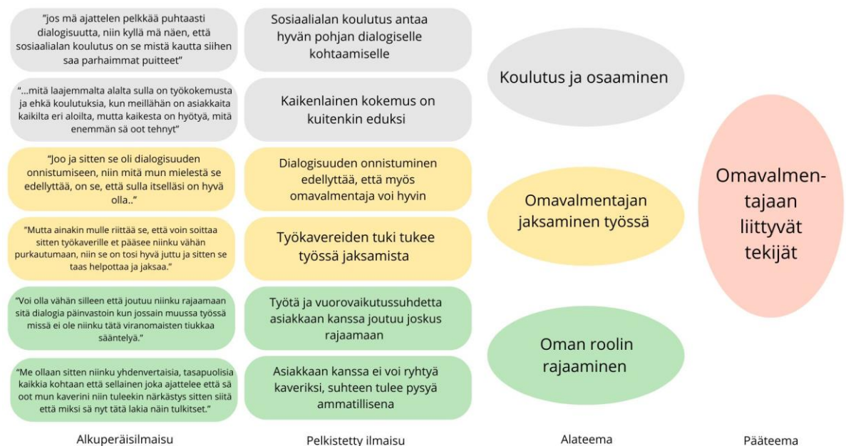
Kuvio 1: Teemoittelu, omavalmentajaan liittyvät tekijät

Teemoittelulle ominaista on eri haastatteluista saadun aineiston yhdistely. Aineiston analysoinnille teemoittelemalla tulee varata riittävästi aikaa. Osa rakentuvista teemoista voi pohjautua alun perin jo teemahaastattelun runkoon ja niissä oleviin teemoihin, mutta monesti aineistosta nousee myös täysin uusia teemoja. Esille nostettavien teemojen tulisi liittyä olennaisesti tutkimuskysymykseen sekä valaista tutkimusongelmaa. Yhteneväisiä teemoja ja ilmiöitä yhdistellään alakategorioiksi, jonka jälkeen yhteneväisistä alakategorioista muodostuu jokin yhteneväinen teema, jonka avulla alakategoriat muodostetaan oman yläkategorian alle. Teemoittelun avulla tutkijan on helpompi nostaa olennaiset tutkittavaan ilmiöön liittyvät seikat aineistosta ja tuoda ne selkeästi ilmi lopullisessa raportissa. Teemoittelussa hyödynnetään haastateltavien alkuperäisiä lainauksia aineiston autenttisuuden säilyttämiseksi. (Puusa 2020b, Analyysin eteneminen ja analyysimenetelmät.) Opinnäytetyössä teemoittelemalla saatiin yhdisteltyä kolmen haastattelun ja useiden vastaajien vastaukset. Teemat nousivat osittain jo haastattelun teemoista, mutta myös asioista, jotka muodostuivat tärkeiksi jokaisessa haastattelussa.