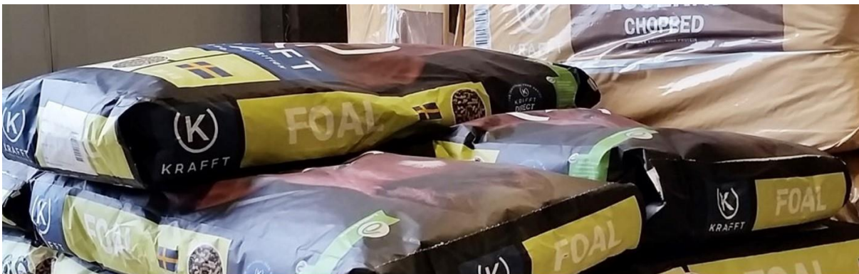
Kuva: Terhi Oksanen