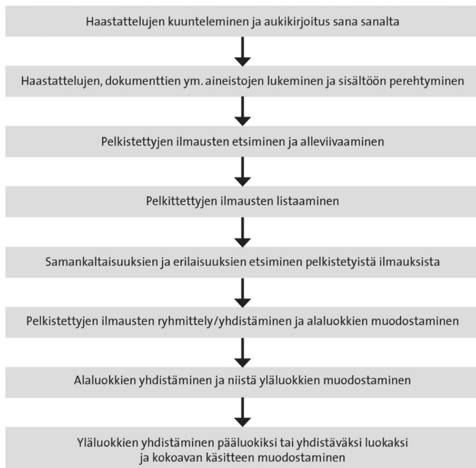
Kuvio 1 (Sarajärvi & Tuomi, 2018).

Aineistolähtöisen sisällönanalyysin vaiheet kuvattu kuvassa 1.