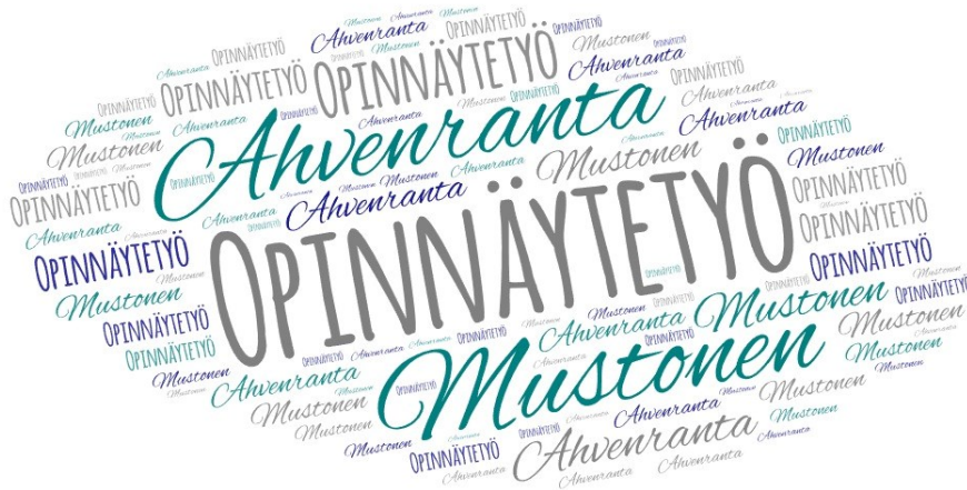
Kuva 3. Opinnäytetyön logo (kuva luotu ohjelmalla Word Art)

Tuotoksista tehtiin prototyypit, joita olivat teoriaohjaavaan analyysiin pohjautuva tiedollinen diasarja sekä aineistolähtöiseen analyysiin pohjautuvia diasarjoja tarinoiden ja kokemuksiin liittyen. Prototyypeistä pyydettiin palautetta työelämäkumppanilta ja pidettiin yhteinen palaveri aiheeseen liittyen. Tuotekehitystä jatkettiin saadun palautteen ja kehittämisehdotusten perusteella. Työelämäkumppanin toiveena oli saada oppimateriaaleista nousemaan esiin kosketavuutta, jotta niistä opitut asiat jäisivät vahvemmin mieleen. Tästä syystä päädyttiin lisäämään tarinallisiin ja kokemuksellisiin oppimateriaaleihin ääniraidat. Tuotettuja oppimateriaaleja oli lopulta useita, tiedollisia diasarjoja oli viisi ja lisäksi koonti avoimen kysymyksen vastauksista, tarinallisia ja kokemuksellisia diasarjoja oli yhteensä neljä. Oppimateriaalit kuvaillaan tarkemmin luvussa kuusi. Diasarjojen tuottamisessa huomioitiin niiden saavutettavuus. Tuotekehitysvaiheessa raportin kirjoittaminen kulki muun tekemisen rinnalla.