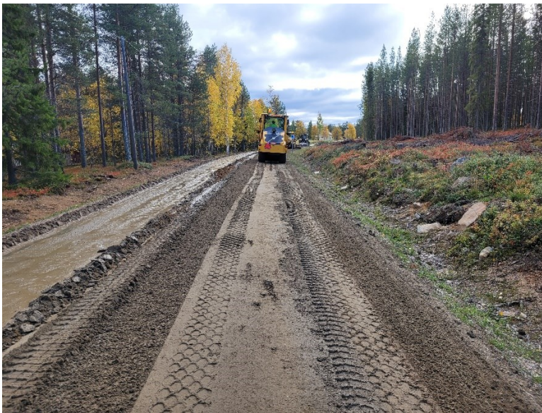
Kuvio 9. Tien tiivistäminen jyrällä (Annala 2022)

Höyläyksen jälkeen tie tiivistetään. Tiivistysvaihe voidaan suorittaa yksinkertaisimmillaan ajamalla testiosuudella hitaasti tasaista vauhtia esimerkiksi traktorilla tai kuorma-autolla. Niesintien kokeilussa käytettiin myös täryjyää työstöosuuksilla 2–4 (kuvio 9). Jyrällä tiivistettäessä kokeiltiin pelkkää valssausta ja kevyttä täryä. Jyrän käytöllä ei havaittu olevan merkittävää vaikutusta.