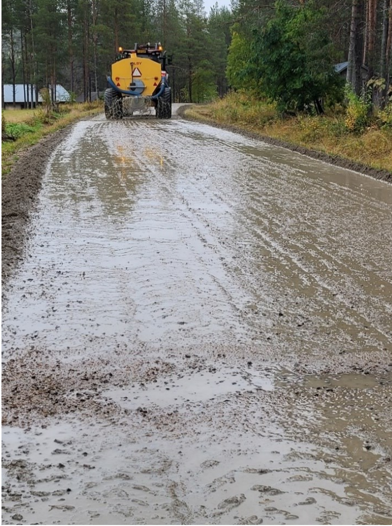
Kuvio 6. Liuoksen levitys (Annala 2022)

Liuoksen levityksen jälkeen tie jysyttiin traktorin perään kiinnitettävän kivijyrsimen avulla (kuvio 7). Kivijyrsin kääntää tien pintaa noin 10 cm syvyydeltä ja murskaa tien pintakunnon hoitoa haittaavat kivet (Huuskonen & Mäentausta 2021, 13). Jyrsinän merkitys on suuri, sillä se saa sekoitettua TapoFixin tasaisesti tien kulutuskerroksen kanssa, samalla murskaten kiviä, jotka saattaisivat myöhemmin alkaa aiheuttamaan tien pinnassa reikiintymistä.