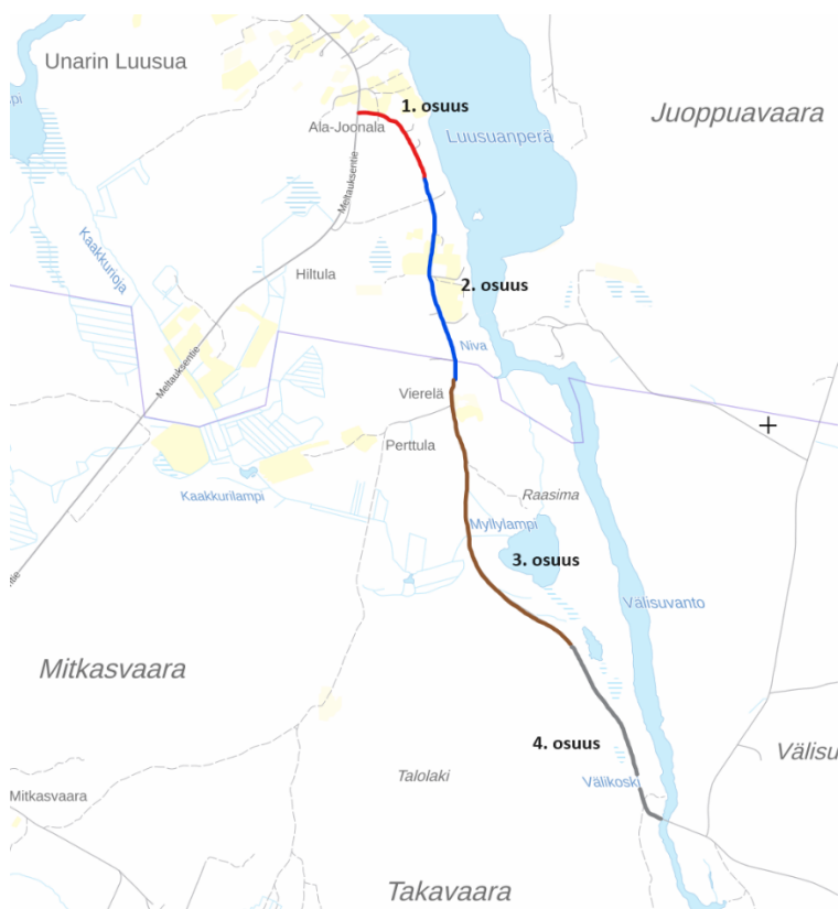
Kuvio 4. Tiekokeen työstöosuudet

Testiosuudelta otettiin ennen kokeilun alkua kantavuusnäytteet, jotta tien kantavuuden kehittymistä pystytään seuraamaan. Lisäksi tien pinnasta otettiin näytteet tien hienoainespitoisuuden selvittämiseksi. Näytteet lähetettiin laboratorioon ja niiden avulla määritettiin kokeilupätkälle sopiva konsentraatin laimennussuhde. Kokeilussa TapoFixin levittämiseen käytettiin 10 m 3 lietevaunua, johon täytettiin kerrallaan 3 m 3 konsentraattia ja 7 m 3 vettä.