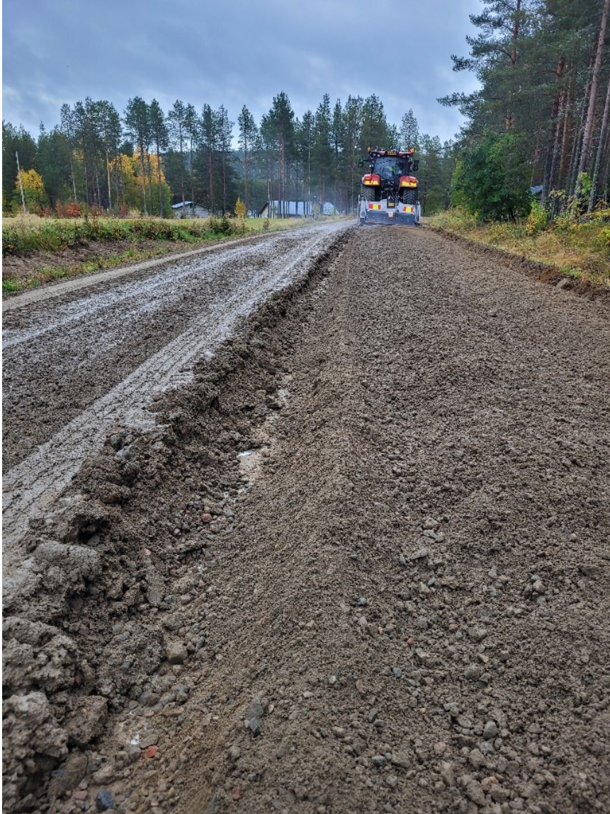
Kuvio 7. Sekoitus kivijyrsimen avulla (Annala 2022)

Sekoitusjyrsinnän jälkeen tie pyritään höyläämään heti lopulliseen muotoonsa (kuvio 8).