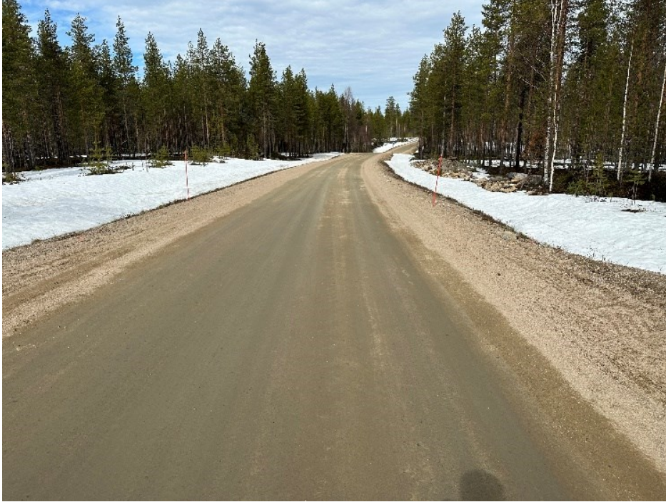
Kuvio 13. Tien pinta 11.5.2023

Muokkauksen yhteydessä tehtävä suolaus toteutettiin työstöosuuksittain eri suolamäärillä TapoFixin pölynsidontakyvyn testaamiseksi. Ensimmäiselle työstöosuudelle suolan annostus oli 0,5 tonnia kilometrille. Toiselle ja kolmannelle työstöosuudelle suolausta ei toteutettu lainkaan. Neljännelle osuudelle suolan määrä oli 1 tonni kilometrille. Ensimmäinen ja toinen osuus ovat keskenään vertailukelpoisia, koska asutus keskittyy niiden varrelle. Kolmas ja neljäs osuus ovat maaston ja liikenteen osalta keskenään vertailukelpoisia. Osuuksien välillä ei huomattu juurikaan eroa pölyävyydessä kesän aikana suolamäärän muutoksista huolimatta. Kesä oli sateinen, joten tien pölyämistä osuuksien välillä ei päästy vertailemaan toivotulla tavalla.