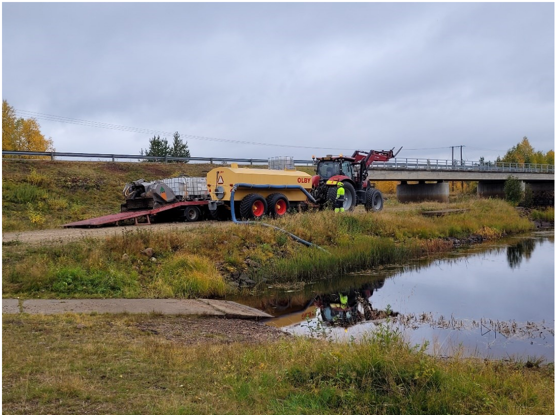
Kuvio 5. Veden lisäys lietevaunuun (Annala 2022)

Valmisteluvaiheen jälkeen aloitettiin kokeilun toteuttaminen. Ensimmäiseksi soratien pinta rikottiin tiehöylällä, samalla kasaten sitä reunapalteeeksi tien reunaan. Tämä tehtiin, jotta TapoFix saadaan tarttumaan tien pintaan paremmin, eikä se pääse valumaan ojiin. Seuraavaksi TapoFix-konsentraatti ja vesi imettiin pumpun avulla lietevaunuun levitystä varten. TapoFix tuotiin työmaalle 1 m 3 kokoisissa IBC- konteissa. Kontteja säilytettiin tiekoealueen läheisellä veneenlaskupaikalla, josta saatiin samalla imettyä kyytiin vaadittava määrä vettä (Kuvio 5).