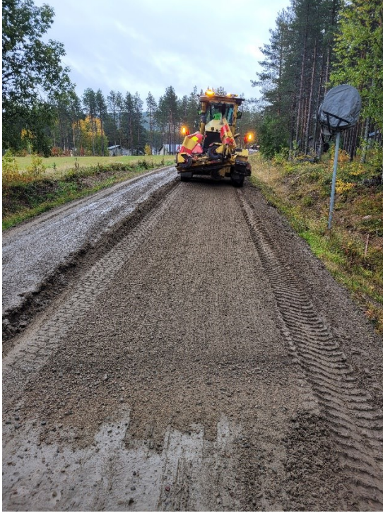
Kuvio 8. Tien muotoilu höylällä (Annala 2022)

Höyläyksen jälkeen tie tiivistetään. Tiivistysvaihe voidaan suorittaa yksinkertaisimmillaan ajamalla testiosuudella hitaasti tasaista vauhtia esimerkiksi traktorilla tai kuorma-autolla. Niesintien kokeilussa käytettiin myös täryjyää työstöosuuksilla 2–4 (kuvio 9). Jyrällä tiivistettäessä kokeiltiin pelkkää valssausta ja kevyttä täryä. Jyrän käytöllä ei havaittu olevan merkittävää vaikutusta.