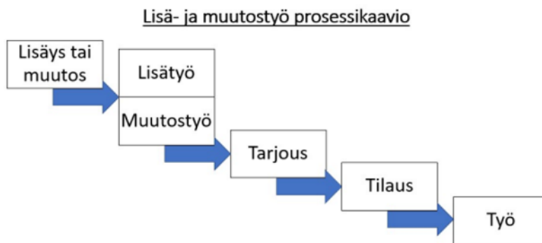
Kuva 3. Lisä- ja muutostyö prosessikaavio (Lisä- ja muutostöiden johtaminen rakennustyömaalla, Pirinen Eerik)

Toinen vaikuttava tekijä ovat kustannukset, jotka kasvavat lisä- tai muutostyön seurauksena. Muutostöistä sovittaessa on ensisijaisesti katsottava mitä sopimusasiakirjoissa on sovittu. Monesti sopimukseen on kirjattu, että työt tehdään yksikköhintaluettelon perusteella. Työt voidaan tehdä myös omakustannehintaan, joka on määritelty YSE 47§:ssa. Lisä- ja muutostöistä sovittaessa menettellään usein (kuva 2) mukaan. (Rakennussopimukset, s.165–167.)