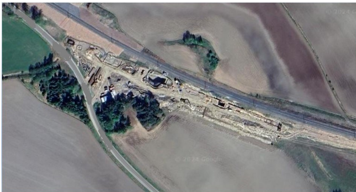
Kuva 4. Satelliittikuva urakka-alueesta.