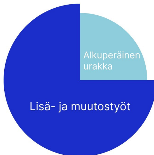
Kuva 2. Lisä- ja muutostöiden osuus voi olla alkuperäistä urakkaa paljon suurempi.

Kaikkia yksityiskohtia ei ole mahdollista erikseen määritellä tai kuvata urakkasopimus asiakirjoissa. Tämän vuoksi joudutaan työmailla usein tulkitsemaan sitä, kuuluuko jokin työvaihe urakkaan vai ei. (Rakennussopimukset, s.161–162.)