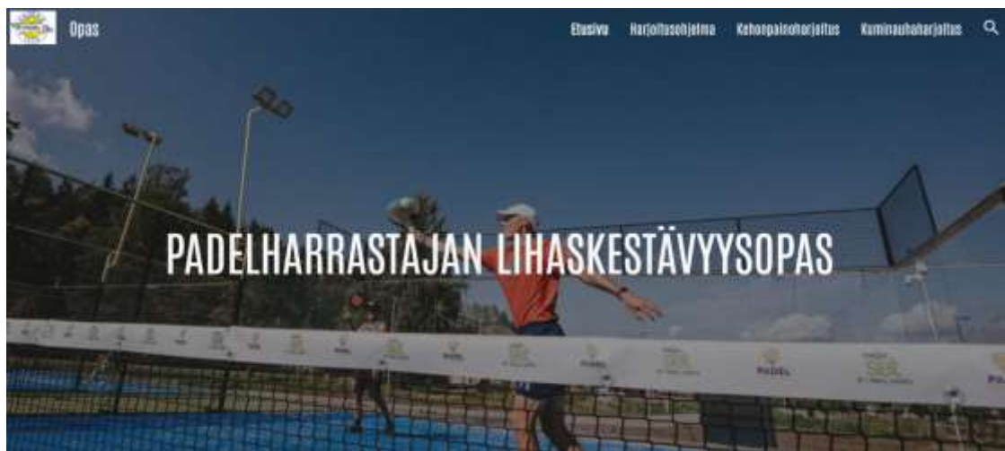
Kuva 4. Oppaan etusivu

Opas on kehittämisprosessimme tuotos (liite 3). Konkreettinen rakentaminen alkoi runsaan ideoinnin ja tietopohjan keruun jälkeen. Rakennusta ohjasi toimeksiantajan kanssa käydyt palaverit. Oppaasta päädyttiin tekemään digitaalinen, ja se sisältää yleistä tietoa lihaskestävyyden hyödyistä lajiin, kaksi progressiivista harjoitusohjelmaa, liikkeitä sekä ohjeistukset. Liikkeet on koostettu videomuotoon, jonka lisäksi näkyvillä on suoritusopasteet.