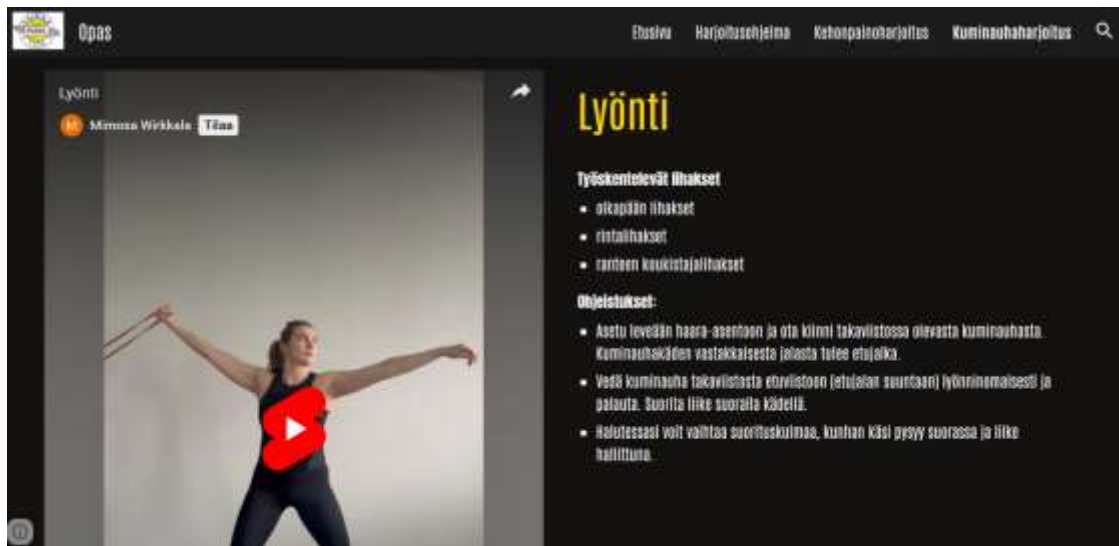
Kuva 6. Liikevideo ja suoritusohje kuminauhaharjoituksessa

Oppaan julkaisualustaa valittaessa tehtiin alustojen tutkintaa ja testausta, joka vaati ajallisia resursseja runsaasti. Lopulta päädyimme Google Sites -sivustoon. Pohjaan on mahdollista ladata videoita YouTube-sovelluksesta ja ne aukeavat helposti sivustoa tarkastellessa. Liikevideot ladattiin yksityisiksi videoiksi, jolloin ne näkyvät vain oppaan lukijoille.