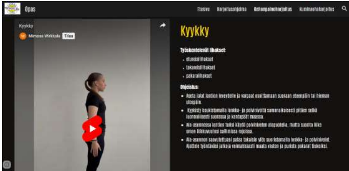
Kuva 5. Liikevideo ja suoritusohje kehonpainoharjoituksessa