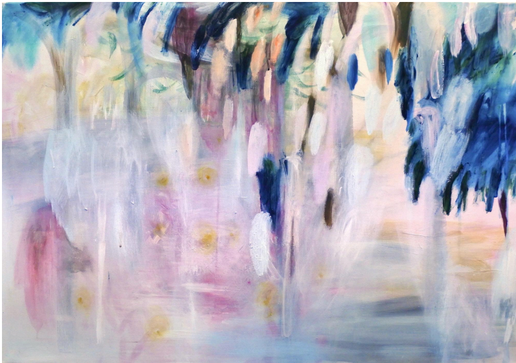
4. Eve Auerluoto, Pyhäkössä, akryyli kankaalle, 2017