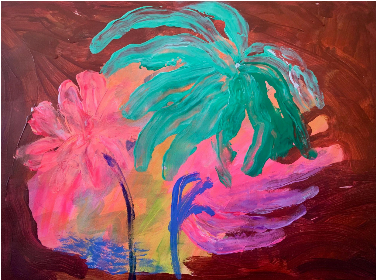
6. Akryyli paperille 30x40

Sen jälkeen aloin vahvistaa keskelle jääneiden raikkaampien värien seasta joitain muotoja. Tuttuja muotoja ilmaantui esiin, palmumaisia kasviaiheita, jotka kasvoivat paikoin maalauksen ruskean reunan yli. Tiesin kirkkaasti ja levollisesti, milloin maalaus oli valmis ja tykkäsin siitä yhtä paljon kuin sen maalaamisestakin. Halusin vielä jatkaa, joten tein toisenkin maalauksen, joka sujui yhtä kevyesti ja nautinnollisesti.