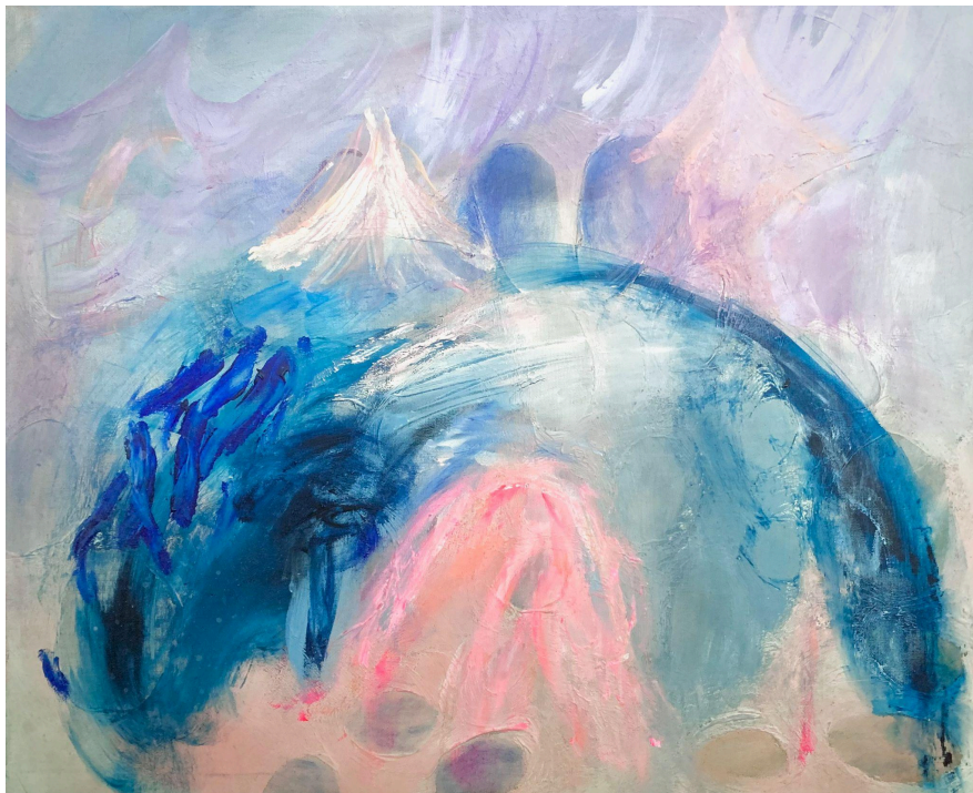
2. Eve Auerluoto, Linnoitus vuorella, sekatekniikka kankaalle, 2023