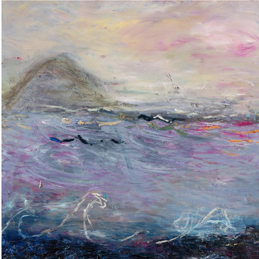
1. Nanna Susi, Vuoren koti, öljy kankaalle, 2022