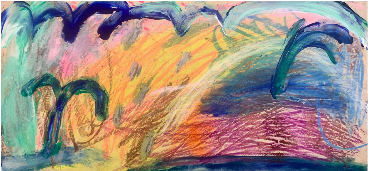
7. Sekatekniikka marmorille, 30x15cm

koko levy oli täynnä. Sen jälkeen, jälleen ennen kuin ehdin ajatella mitään, olin jo ottanut kirkkaankeltaisen maalin ja pienen sienen ja vetänyt piirroksen päälle keltaista reunoja lukuunottamatta. Maalaus tuli nopeasti, vaivattomasti ja olo taas keveni, kun sai vapaasti ilmentää sisäisyyttään. Maalauksesta tuli lopulta runsas, iloinen, villi maisemallinen pläjäys, josta tykkäsin kovasti. Tulin jälleen tehneeksi asiat eri tavalla kuin yleensä, avautuminen itselle ja intuitiolla vapautti totunnaisesta tavasta tehdä. Jatkoin maalaamista ilolla vielä kahden pienen laatan verran. Jäi hyvä fiilis. Alan jälleen rakastua maalaamiseen, kun kiinnostus siihen on viime aikoina ollut pahasti kateissa.