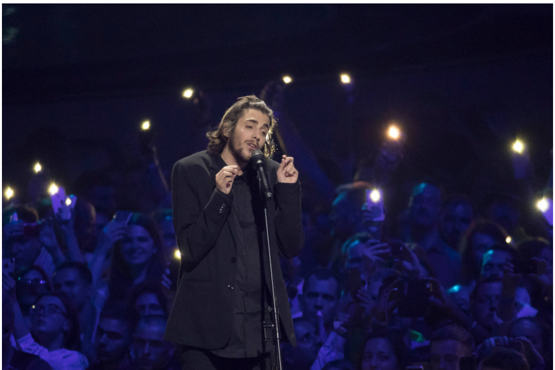
Kuva 2: Salvador Sobral vuoden 2017 Eurovision laulukilpailun finaalin harjoituksissa

Euroviisuja varten kappaleen ympärille luodaan sitä tukeva lavaesitys. Esityksissä on tänä päivänä paljon variaatiota aina minimalistisesta musiikintulkinnasta isoihin show-numeroihin. Esimerkiksi kuvassa 2 näkyvä vuoden 2017 voittaja Salvador Sobral luotti kappaleensa Amar Pelos Dois esityksessä yksinkertaisuuteen ja vähäeleisyyteen. Kuvassa 3 puolestaan räikeämmällä esityksellä vuoden 2023 hopeasijaan yltänyt Suomen Käärijä kappaleella Cha Cha Cha.