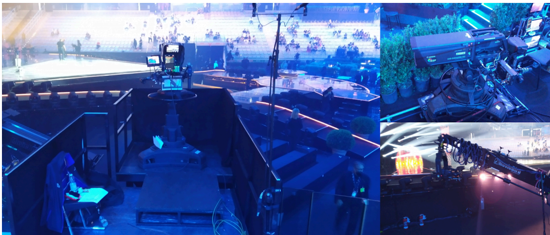
Kuva 6: Kameroita Torinon Pala olimpico -areenalla vuoden 2022 Euroviisuissa (Ahola, 2022)

Kilpailussa on kaikkiaan 37 osallistujamaata (2023), ja siihen lisättyä suoran lähetyksen kaikki muu sisältö, kuten avaus- ja väliaikamerot, laulukilpailun työ määrä on valtava. Tämän vuoksi Euroviisujen TV-lähetysten vastuu on yleensä jaettu useamman monikameraohjaajan kesken. Esimerkiksi Liverpoolissa 2023 ohjaajia oli kolme (Fernand's Live Show Show 2023.).