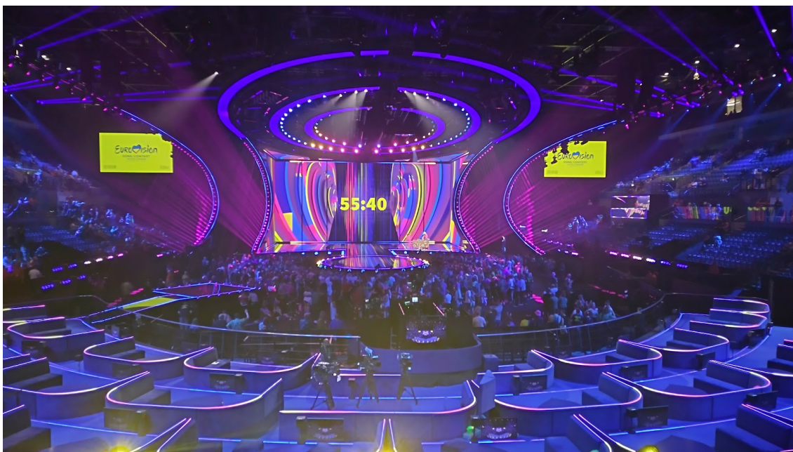
Kuva 4: Vuoden 2023 Julio Himeden suunnittelema euroviisulava Liverpoolissa ennen toisen semifinaalin kenraaliharjoituksen alkua (Ahola, 2023)