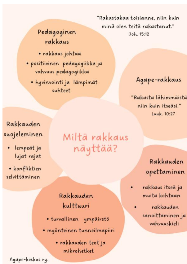
Kuva 2. Kuvakaappaus posterista.