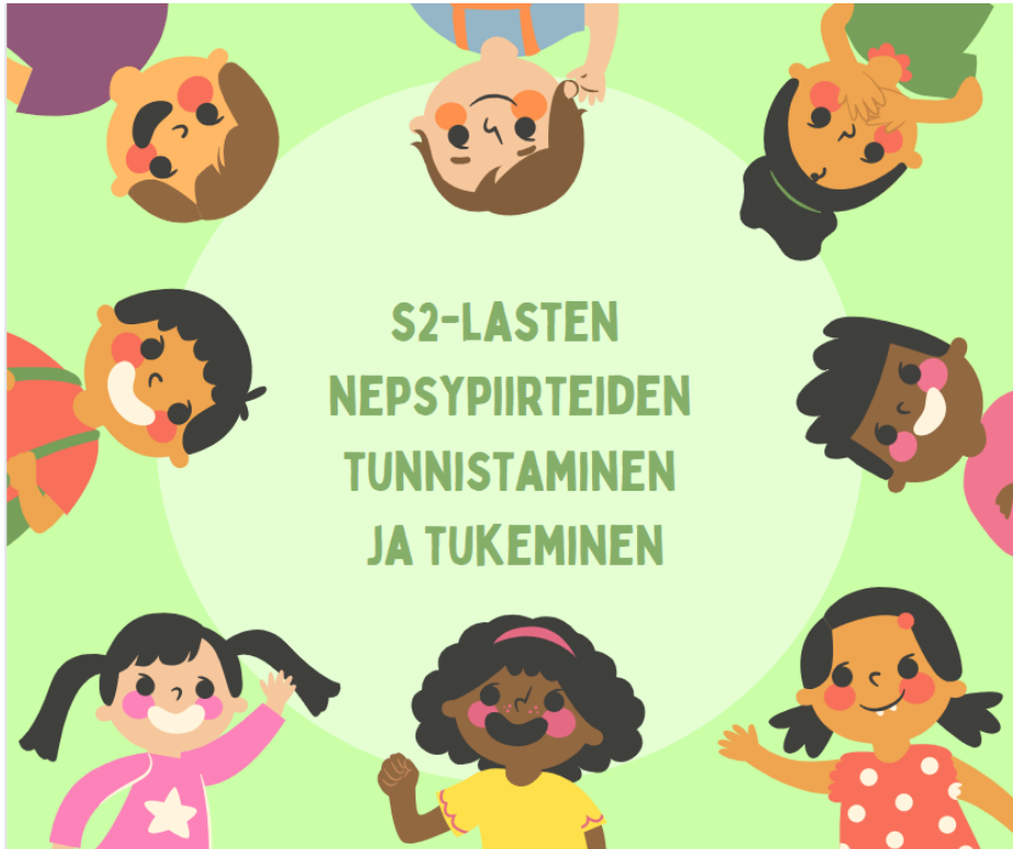
Kuva 2: Oppaan kansi