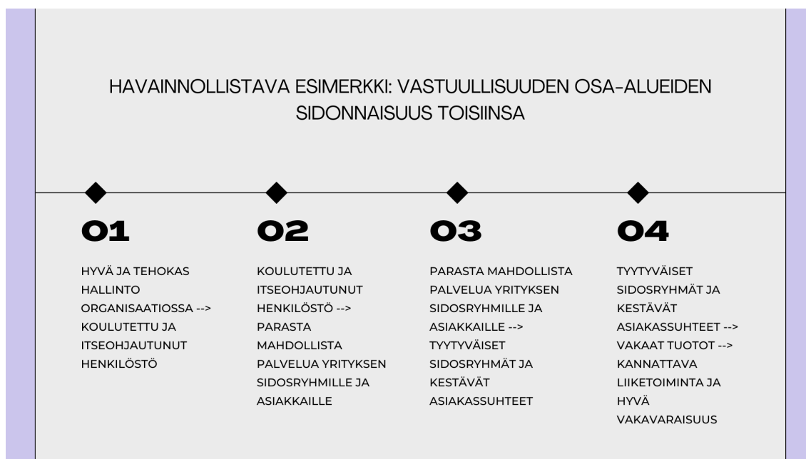
KUVA 4. Vastuullisuuden osa-alueiden sidonnaisuus toisiinsa.

Yrityksen vastuullisuusteemojen valinta ja niiden sopeuttaminen tulee lähteä yrityksen ydintoimintojen ja markkinan tunnistamisesta. Tämä tarkoittaa käytännössä sitä, että nämä vastuullisuusteemat tulee valikoitua ottaen huomioon toimiala, jolla yritys operoi sekä arvopohja, jolla yritys haluaa liiketoimintaansa toteuttaa. Finanssialan tapauksessa näitä ydintekijöitä ovat esimerkiksi tuloskeskeinen ja tiukan valvonnan alainen toimiala, jossa vallitsee kova kilpailu eri toimijoiden välillä. Lisäksi asiakkaiden merkitys korostuu tuottojen toteutumisessa, sillä finanssialalla tuotot koostuvat omista asiakkaista ja täten näiden asiakassuhteiden ylläpitäminen on elintärkeässä roolissa. Tarkastellaan seuraavaksi finanssialan toimijoista OP:n vastuullisuusohjelmaa ja sieltä esiin nousevia oleellisempia vastuullisuusteemoja.