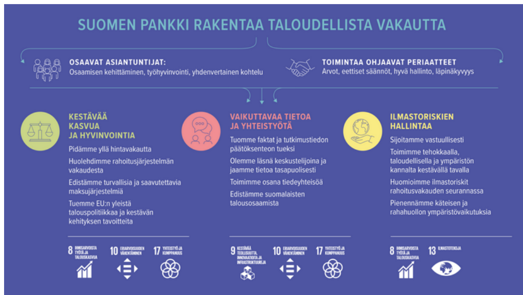
KUVA 3. Suomen Pankin vastuullisuuden kenttä. (Suomen Pankki n.d..)

Suomen Pankin vastuullisuusohjelmasta käy ilmi selkeästi kaikkien vastuullisuuden osa-alueiden näkyvyys. Ympäristövastuun näkökulmasta keskitytään ennen kaikkea ympäristön kestävyttä ylläpitävään sekä tehokkaaseen liiketoimintaan, joka toteutuu muun muassa vastuullisen sijoittamisen periaatteiden sekä käteisrahan ympäristövaikutuksen pienentämisen kautta. Myös rahoitusratkaisujen ilmastovaikutuksia pyritään tarkkailemaan sekä tarjoamaan mahdollisimman kestäviä rahoitusvaihtoehtoja. Taloudellinen vastuullisuus näkyy pyrkimyksenä ylläpitää tasainen hintataso eli maltillinen inflaatio, toteuttaa liiketoimintaa EU:n yleisen talouspolitiikan mukaisesti sekä taata rahoitusjärjestelmän kestävyys ja vakaus. Sosiaalisen vastuullisuuden osa-alueen piirteistä nousee esiin läpinäkyvä ja faktapohjainen päätöksenteko toiminnan tukena, johdonmukainen ja tasapuolinen tiedonkulku sidosryhmien välillä sekä jatkuva tietotaidon kehittäminen ja ylläpitäminen kaikille suomalaisille. Toiminta pyritään pitämään vastuullisena sen ollessa läpinäkyvää sekä hyvän hallinnon ja eettisten periaatteiden mukaista. Myös osaamista halutaan ylläpitää sen jatkuvan kehittämisen, yhdenvertaisuuden sekä työhyvinvoinnin kautta. (Suomen Pankki n.d..)