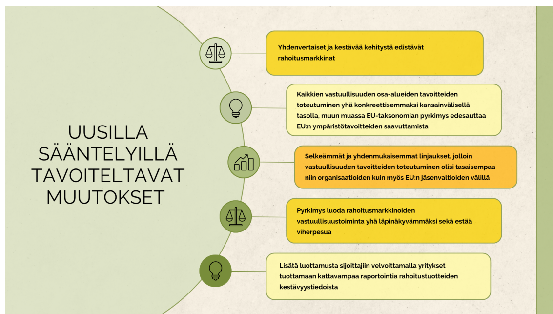
KUVA 6. Uusilla sääntelyillä tavoiteltavat muutokset.

Finanssialalla taksonomia-asetukseen varautumiseen on syytä kohdentaa re- sursseja riittävästi. Asetuksen koskiessa rahoitustuotteiden kestävyttä, monet sijoittajat varmasti pitävät taksonomiaa todella odotettuna muutoksena. Kulutta- jien ja sijoittajien keskuudessa vihreät arvot ja kestävyys ovat nousseet viime vuosina trendiksi, jolla on entisestään kasvava merkitys kuluttajavalinnoissa sekä sijoituspäätöksissä. Sijoittajien näkökulmasta on osoitettu kokonaisvaltaista mie- lenkiintoa EU:n taksonomia-asetusta kohtaan ja monet sijoittajat haluavatkin tie- toja sijoitustuotteiden taksonomialuokituksen mukaisesta kestävydestä sijoitus- päästösten tueksi (Ramboll n.d.). Tästä syystä finanssialan organisaatioiden olisi elintärkeää tarkastella omaa rahoitus- ja sijoitustuotevalikoimaansa sekä ottaa selvää tuotteiden kestävydestä taksonomialuokituksen kriteerien mukaisesti. Mikäli asetuksen mukana tulevaan muutokseen ei varauduta riittävän huolelli- sesti, voi se johtaa sijoittajien lähtemiseen toiselle finanssialan toimijalle ja sitä kautta näkyä negatiivisena vaikutuksena tuotoissa sekä yrityksen liiketoiminnan tuloksessa.