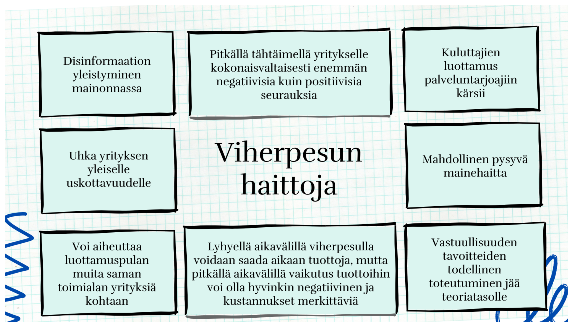
KUVA 5. Viherpesun haittoja organisaatiolle.

Viherpesu on merkittävä uhka vastuullisuuden todelliselle toteutumiselle, sillä sitä hyödyntävät yritykset luovat uhan yleiselle uskottavuudelle vastuullisuuden suhteen. Monet kuluttajat haluavat nykyaikana kannattaa yrityksiä ja toimijoita, joiden toiminta todella nojaa vihreisiin arvoihin ja täten tuoda oman panoksensa ympäristön säilyvyyteen sekä ilmastonmuutoksen pysäyttämiseen. Markkinoinnissa viherpesu näyttäytyy esimerkiksi tietynlaisten sanavalintojen painottamisena yrityksen markkinoinnissa. Työ- ja elinkeinoministeriö (TEM) kokosi vuonna 2022 selvityksen yhdessä Suomen Ympäristökeskuksen (SYKE) kanssa, jossa selvitettiin yleisimpiä monitulkintaisia sekä harhaanjohtavia termejä. Selvityksessä monitulkintaisina termeinä nousivat esiin muun muassa termit vastuullinen, vihreä ja hiilineutraali. Harhaanjohtaviksi termeiksi taas arvioitiin esimerkiksi vastuullinen, päästötön sekä ekologinen. Näissä termeissä keskeisenä ongelmana nähdään se, että ne viittaavat ympäristönäkökulman lisäksi myös vastuullisuuden taloudelliseen sekä sosiaaliseen puoleen, eivätkä ne täten yksiselitteisesti viittaa ainoastaan ympäristöön. Kokonaisuudessaan kyseisen selvityksen mukaan mainonnassa käytetyistä ympäristötermeistä jopa 56 % arvioitiin harhaanjohtaviksi. (Asikainen 2022.)