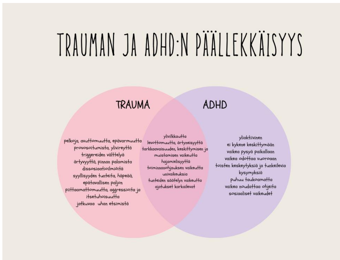
Kuva 1: ADHD:n ja trauman yhteys.

Diagnosoinnin tekee kuitenkin vaikeaksi se, että ne esiintyvät samanaikaisesti ja niillä on monia päällekkäisiä piirteitä. Samankaltaisuuksia näiden kahden välillä ovat mm. keskittymis- ja tarkkaavaisuushäiriöt, yliherkkyys, tunteiden säätelyvaikeudet sekä muistivaikeudet. Alla olevassa kuviossa on esitelty tarkemmin ADHD:n, traumaperäisen stressihäiriön sekä niiden päällekkäisiä piirteitä. (Neff, M.2024.)