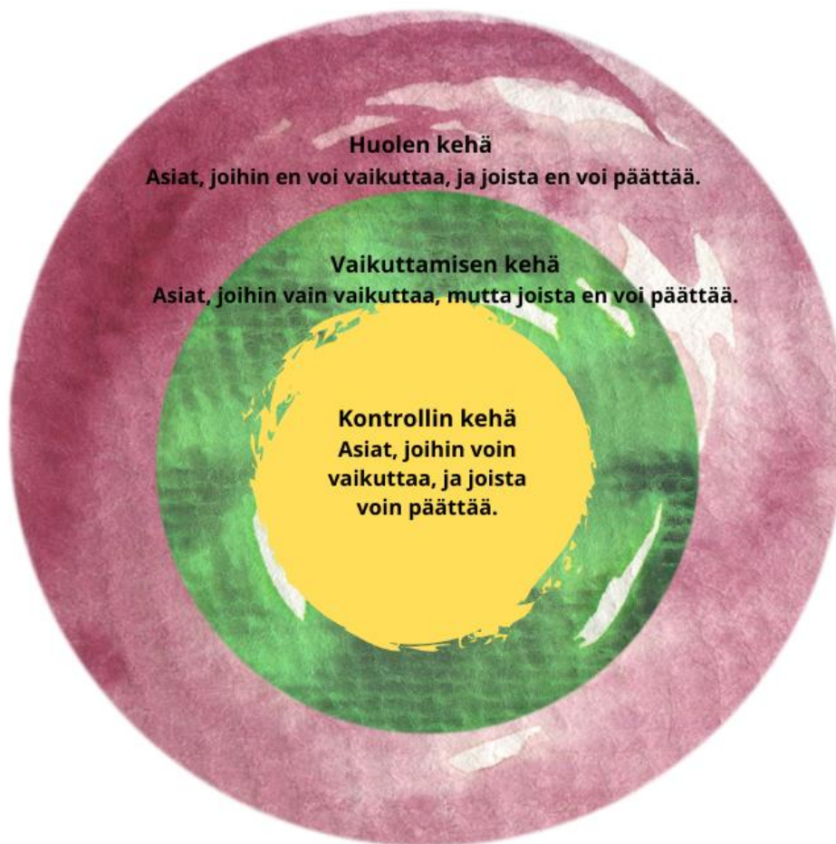
Kuva 3: Vaikuttamisen kehä

energiaansa käyttää ja, minkä asioiden pohtimiseen kannattaa käyttää mahdollisimman vähän omia voimavarojaan. Kun selkiyttää ne asiat, joihin ei voi itse vaikuttaa, vähentää se mielen kuormittumista ja voi keskittyä sisimmäisen kehän asioihin. Kehille sijoitettavat asiat voivat olla konkreettisia tekoja, omia asenteita, suhtautumista tai myös tunteita. Parasta on muistaa, että tapahtuipa maailmassa mitä vain, voit aina valita miten itse suhtaudut siihen. (Noponen, K. 2024.)