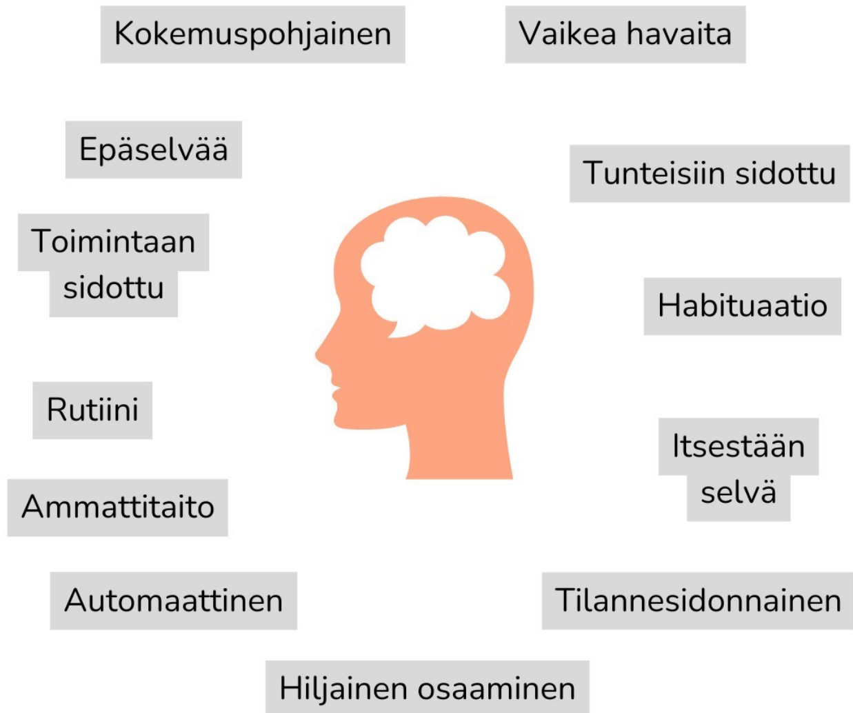
Kuvio 1. Hiljaisen tiedon monimuotoisuus

Nykyään asiantuntijaorganisaation tärkeimpänä osana pidetään henkilöstön tietotaitoa ja henkistä pääomaa, erityisesti hiljaisen tiedon muodossa. Hiljaisen tiedon ylläpitämä osaaminen onnistuu lähes ilman tietoista ajattelua, eli se on niin sanotusti automatisoitunutta. Sen takia sen selittäminen muille tai jopa sen tunnistaminen itse voi olla haastavaa. (Kupias & Salo 2014, 231.) Esimerkiksi henkilön on mahdollista tunnistaa toisen ihmisen kasvot tuhansien tai jopa miljoonien joukosta, mutta se, miten kyseiset kasvot on mahdollista tunnistaa voi olla haastavaa selittää (Toom