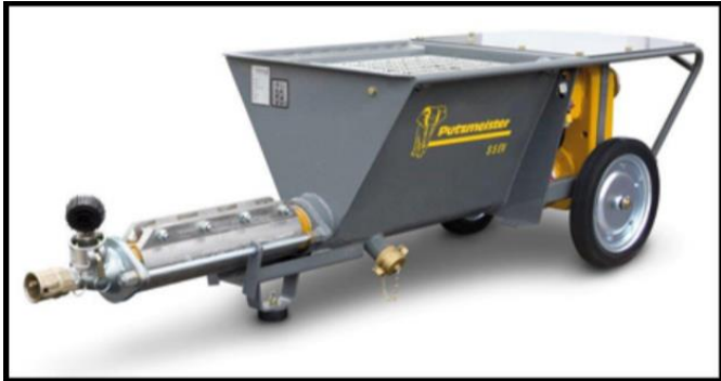
KUVA 4. Sementti-injektioinnissa käytettävä ruuvipumppu (Tornokone 2019.)

Pumppujen osalta sementti-injektioinnissa käytetään erilaista laitteistoa, kuten mäntäpumppuja tai ruuvipumppuja, joilla pystytään pumppaamaan suuria määriä massoja. Ruuvipumpussa on säiliö massan sekoittumista varten sekä lieriön muotoinen putki, josta massa kulkee letkuun, jolla injektointi suoritetaan (kuva 4). (Väylävirasto 2016, 37.)