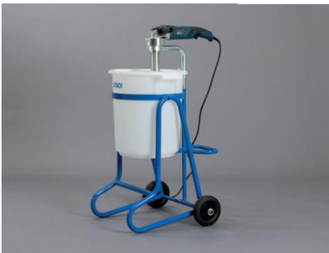
KUVA 5. Sementtilaastia sekoitettaessa käytettävä kolloidisekoitin (Väylävirasto 2016, 37.)

Injektointireiät porataan sementti-injektioinnissa säännöllisin välein, yleensä 30–60 cm välein. Injektointitulppina käytetään suurempia tulppia, jotka kiristetään paikalleen kumitiivisteellä. Mikrosettilaasti sekoitetaan yleensä suurikierroksisella kolloidisekoittimella (kuva 5). Injektointilaasti pumpataan yleensä käsipumpulla ja matalalla paineella, yleensä 0,1–0,5 MPa. (Väylävirasto 2016, 37.)