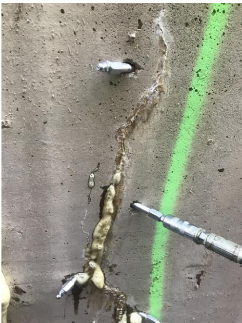
KUVA 9. Kosteuteen reagoanut massa tulee ulos halkeamasta (Jyrkkä 2023.)

Halkeaman molemmin puolin asennetuista manseteista on syytä aloittaa alimmasta ja siirtyä järjestelmällisesti ylöspäin mansetti kerrallaan, jotta koko halkeama täyttyy ja kosketus poistuu sen sisältä. Pumpatessa pyritään saada kosteuteen reagoanut massa tulemaan ulos halkeamasta, mutta on syytä seurata myös halkeaman ympäristöä ja rakennetta yleisesti, koska massa leviää helposti rakenteen sisällä muuallekin, kuin haluttuun halkeamaan. (kuva 9) Jos massa pääsee ulos muualta kuin halkeamasta tai rakenne alkaa esimerkiksi halkeilla on syytä keskeyttää pumppaus ja vaihtaa pumpattavaa mansettia tai jopa porata uusi reikä, josta jatkaa pumppaamista. (Kähkönen 2023.)