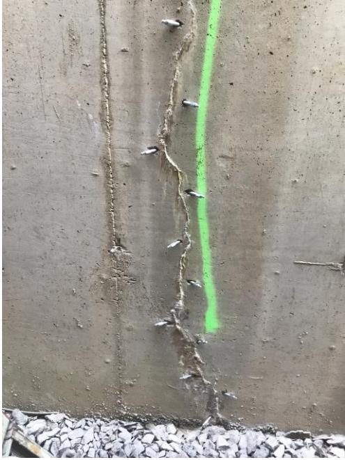
KUVA 8. Mansettien asennus betonirakenteeseen (Jyrkkä 2023.)