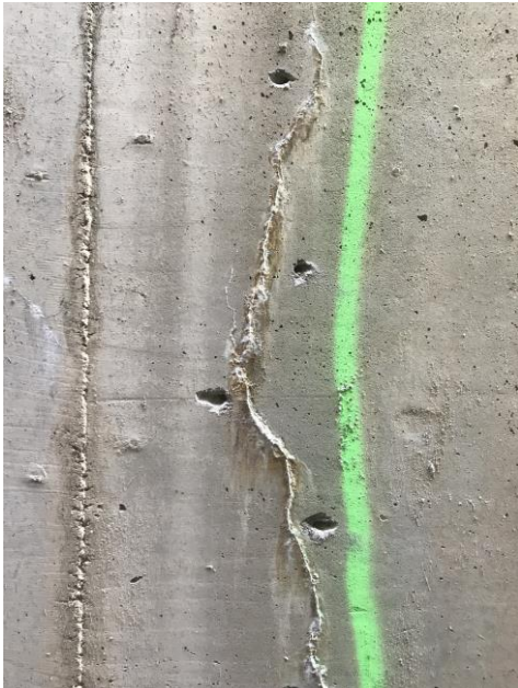
KUVA 7. Reikien poraaminen (Jyrkkä 2023.)

Kun massa on valittu ja aikataulu suunniteltu, voidaan aloittaa varsinaiset työvaiheet. Ensimmäisenä pitää porata rakenteeseen reikiä molemmin puolin halkeamaa noin 20 cm välein, jotta varmistetaan massan leviäminen koko halkeaman alueelle (kuva 7). (Kähkönen 2023.)