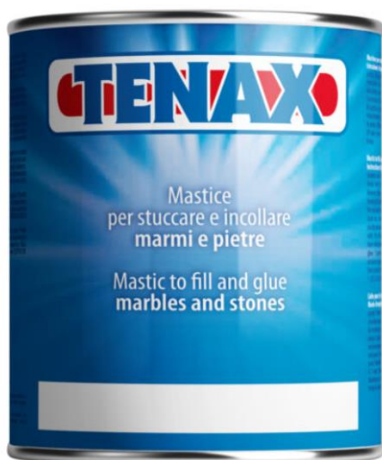
KUVA 3. Kivikitti, jota käytetään sulkuaineena epoksi-injektoinneissa (Levanto 2022, 1.)

Sementti-injektointi eroaa pääpiirteittäin epoksi-injektoinnista, eli yhdestä muovi-injektoinnin osasta (kuva 2). Sulkumateriaalina käytetään yleensä sementtipohjaista laastia, joka ruiskutetaan halkeaman pintaan. Epoksi-injektoinnissa käytetään puolestaan sulkuaineena kivikittiä (kuva 3). (Väylävirasto 2016, 37.)