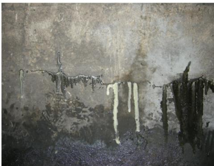
KUVA 6. Polyuretaani on reagoinut veden kanssa ja tunkeutuu ulos halkeamasta (Väylävirasto 2016, 36.)

Polyuretaani-injektointi on yksi muovi-injektionin osa-alueista ja siinä pyritään ensisijaisesti saavuttamaan vesitiiviys ja tarvittaessa myös lisäämään rakenteen lujuutta. Erityisesti kosteuden tai veden kanssa reagoiva polyuretaani soveltuu hyvin kohteisiin, joissa esiintyy vesivuotoa, eikä veden tuloa tarvitse pysäyttää ennen injektointia. Polyuretaanin vaikutus näkyy lähes välittömästi injektoinnin jälkeen ja se pumpaaminen on keskeytettävä, kun polyuretaania alkaa pursuta runsaasti halkeamasta ulos (kuva 6). (Väylävirasto 2016, 35, 36.)