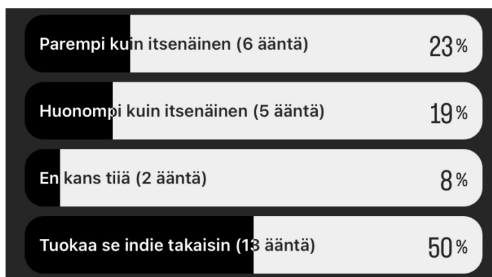
Kuva 3. Seuraajieni mielipide sanasta "riippumaton".

Suurin ongelma sanan ”indie” käytössä muodostui olemaan se, että se mielletään omakustanteen lisäksi myös musiikin genreksi. Sosiaalisessa mediassa tekemäni kyselyn mukaan suurin osa piti indietä genrenä, eikä omakustanteena (Kuva 2). Tästä syystä viimeistään päätin jättää käyttämättä kyseistä termiä podcastini nimessä.