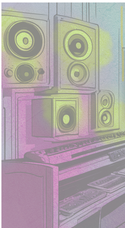
Kuva 6. Jesse Mäläskän suunnittelema kuva sosiaalisen median tarinoita varten.

Mäläskä suunnitteli pyynnöstäni myös kuvataustan (Kuva 3.), jota voin käyttää pohjana sosiaalisen median tarinat-toiminnossa julkaistessani sisältöä Omakustanneartistit-podcastista.