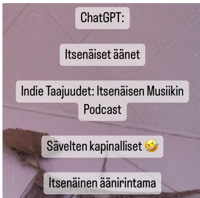
Kuva 4. ChatGPT:n ehdotukset.

Ristiriitaa herätti myös se, että seuraajani vastasivat kuitenkin haluavansa sanan ”indie” takaisin, kun kysyin heidän mielipidettään sanoista ”riippumaton” ja ”itsenäinen” (Kuva 3). Tästä syystä päätin lopulta lopettaa kyselemisen ja keksiä itse jotain aivan muuta.