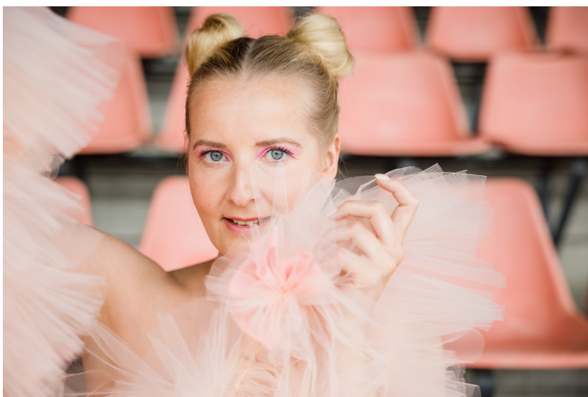
Kuva 10. Eroma.