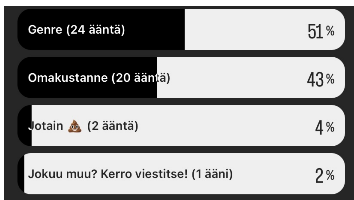
Kuva 2. Mitä seuraajillani tulee mieleen sanasta "indie".

Ensimmäinen nimiehdotukseni podcastille oli ”Ihan indienä!”. Muita vaihtoehtoja olivat muun muassa ”Indiecast”, ”Indie-elämää”, ”Riippumattomat” ja ”Itsenäinen artisti”. Yllätyin saamastani palautteesta liittyen sanan ”indie” käyttöön. Monet omakustanneartistit mielsivät tämän termin ristiriitaiseksi ja jopa halvan kuu- loiseksi, kun taas toiset nimenomaan halusivat käytettävän tätä termiä.