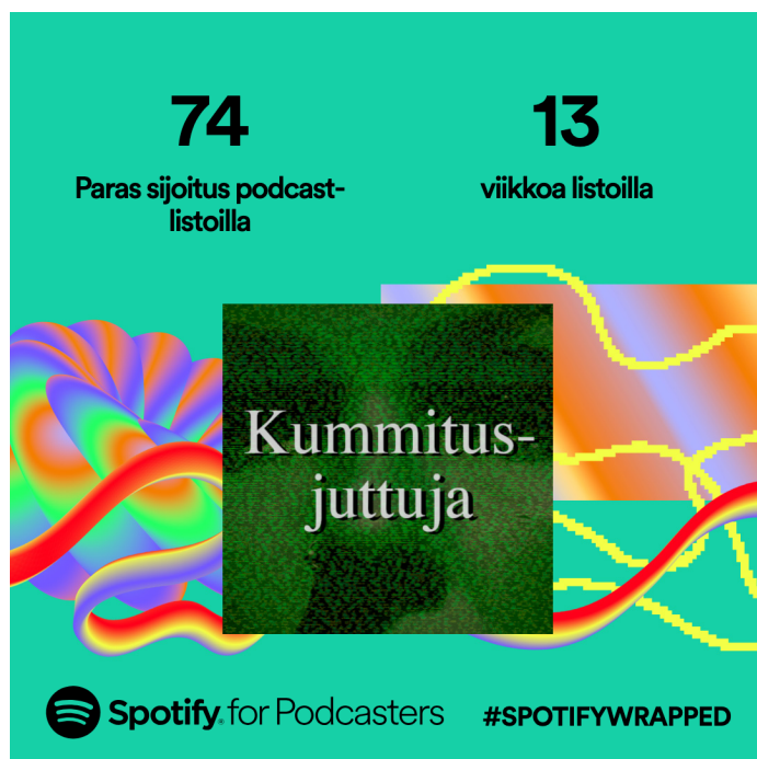
Kuva 1. Spotify wrapped 2023.

Kummitusjuttuja-podcastin kohdalla saavutin yllätyksekseni melko nopeasti kat- tavan kuulijakunnan, ja podcast lähti menestymään niin Spotifyn top 200 - listalla, kuin Podimossakin. Kummitusjuttuja oli vuonna 2023 Spotifyn top 200- listalla yhteensä 13 viikkoa.