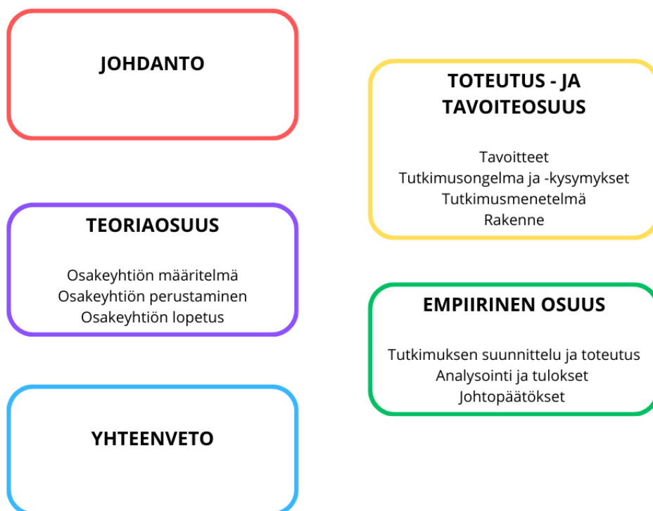
Kuvio 1. Opinnäytetyön rakenne

Opinnäytetyön rakenne koostuu johdannosta, toteutus- ja tavoiteosuudesta, teoriaosuudesta, empiriaosuudesta ja yhteenvedosta (Kuvio 1).