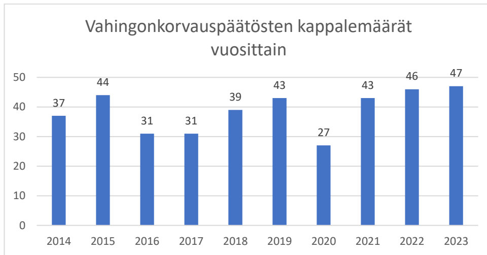
Kuvio 1. Sisä-Suomen poliisilaitoksen vahingonkorvauspäätösten kappalemäärät vuosina 2014–2023

%). Seuraavassa kuviossa on kuvattu Sisä-Suomen poliisilaitoksen vahingonkorvauspäätösten kappalemäärät vuosien 2014–2023 aikana.