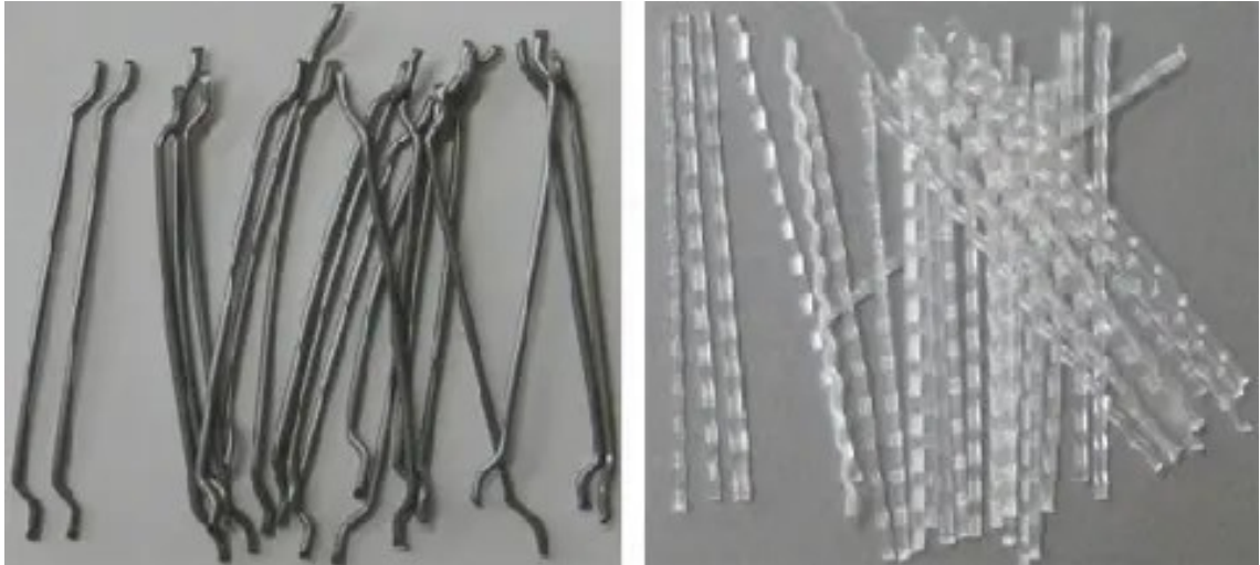
Kuva 3. Betonissa käytettävä teräskuituja (vasemmalla) ja makropolymeerikuituja (oikealla). [11.]