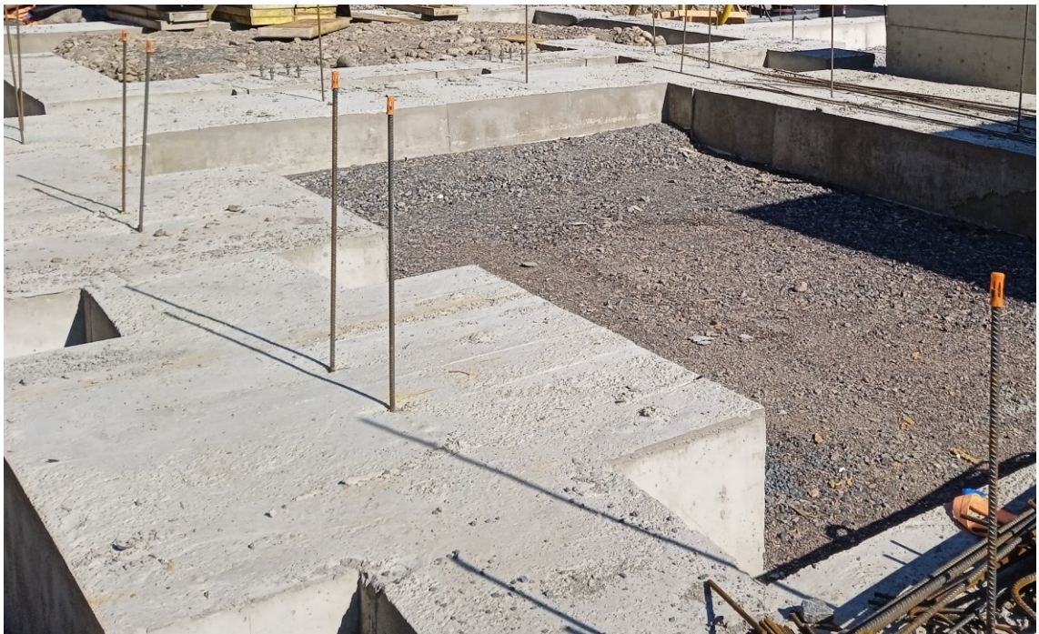
Kuva 7. Raudoituksen suojaus muovisuojuksilla. [8.]

Raudoituksen suhteen on valvottava, että rauditus ei aiheuta vaaraa työntekijöille. Pystytartuntaraudat, jotka ovat halkaisijaltaan alle 12 mm, on hyvä taivuttaa työmaalla vaakaan tai valmiiksi suunnitella U-muotoisina. Paksummat raudat, jotka ovat pystyasennossa tulee suojata esimerkiksi muovisuojuksilla, kuten kuvassa 7. [2, s.297.]