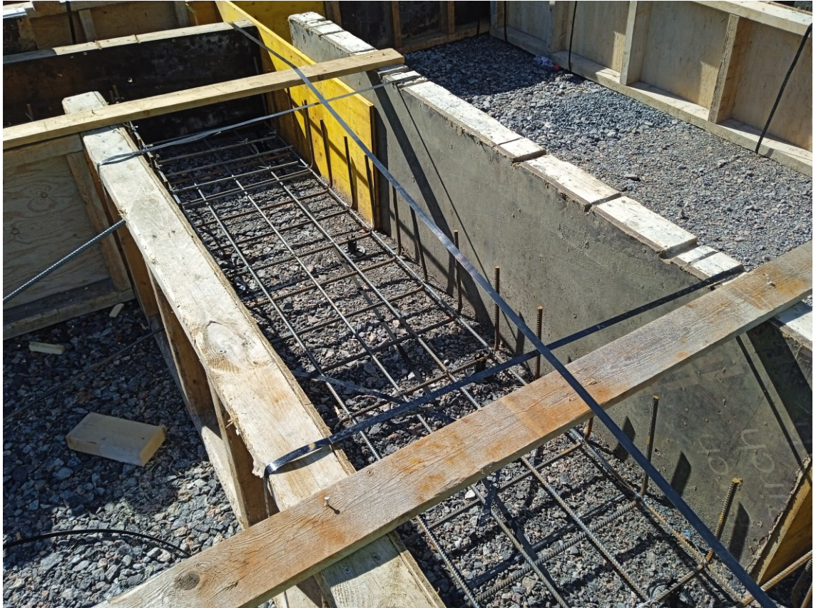
Kuva 4. Asuinkerrostalon anturan muotti- ja raudoitustyö. [8.]

Betonin raudoituksen toteutuksen tyyli ja määrä riippuu sen käyttökohteesta ja siihen kohdistuvista voimista. Palkeissa raudoitus koostuu pituussuuntaisesta raudoituksesta ja poikkisuuntaisista haoista. Palkkien raudoitus tehdään yleensä 12–32 mm:n paksuisista terästangoista. Laattojen raudoituksessa, raudoitus asennetaan kahdessa eri suunnassa. Laattojen raudoitus voidaan tehdä valmiiksi hitsatusta raudoitusverkosta tai irtotangoista. Laattojen raudoituksessa käytettävän tangon paksuus on yleensä 6–12 mm. Pilarien raudoituksessa asennetaan päätangot betonin ulkoreunan lähelle ja niitä ympäröi haot. Haoilla estetään päätankojen nurjahtamista. Pilareissa käytettävien päätankojen paksuus on yleensä 16–32 mm. 40 mm käyttö on myös mahdollista eurokoodin mukaan. Pilareissa käytettävien hakatankojen paksuudet ovat yleensä 6–10 mm. Seinien raudoitus toteutetaan, siten että molemmilla pinnoilla on pystysuuntaiset tangot ja niiden ulkopuolelle asennetaan vaakatangot, joilla saadaan estettyä seinää nurjahtamasta. [2, s.263–264.]