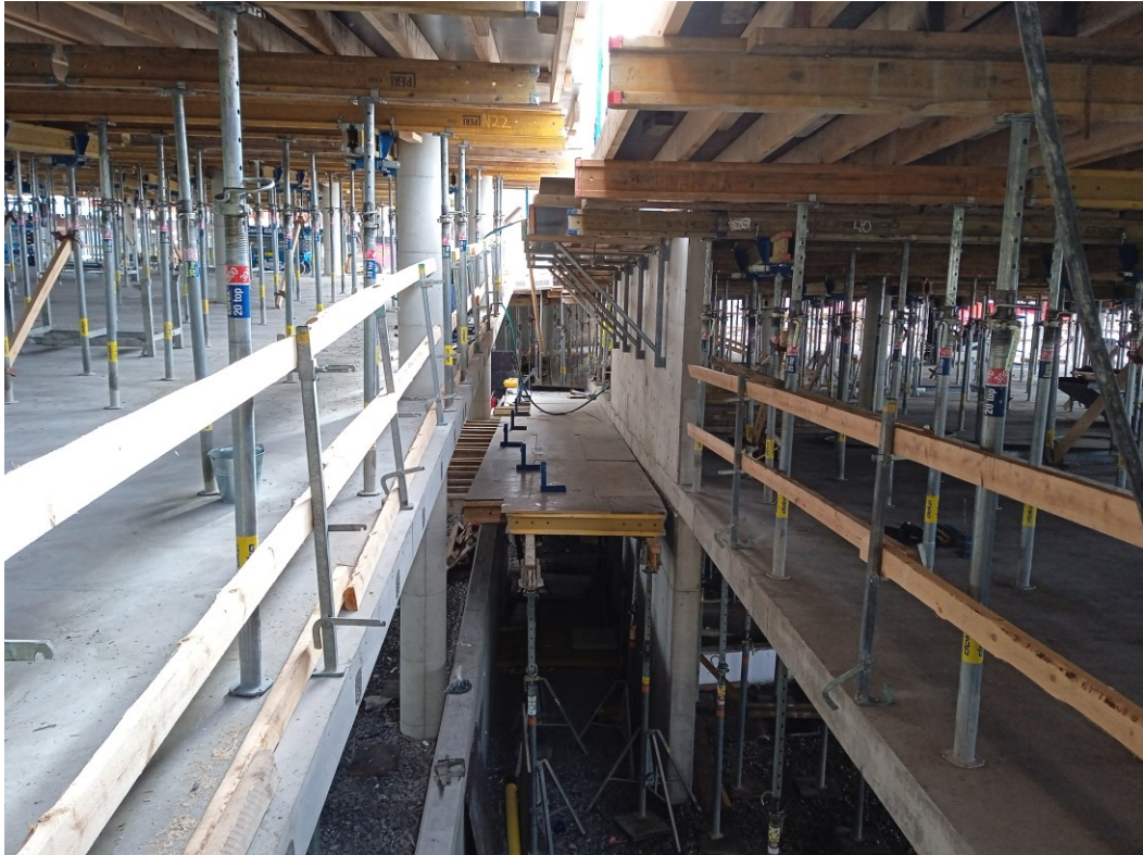
Kuva 6. Pysäköintitalon holvimuotti, joka on toteutettu vakiopalkeilla. [8.]

Suurissa hankkeissa muottikaluston valinnan suunnittelu on isossa roolissa. Muottivalinta vaikuttaa suuresti moniin asioihin. Valintaan vaikuttaa työmaan lähtötiedot, esimerkiksi laatuvaatimukset betonille ja resurssien, kuten aika, raha ja nosturin kapasiteetti. Rakennusvalvonnan kannalta on tärkeää, että valvoja tietää eri muottimenetelmien haitat ja hyödyt, jotta hän voi konsultoida ja auttaa urakoitsijaa, että tilaajaa. [2, s.248–251.]