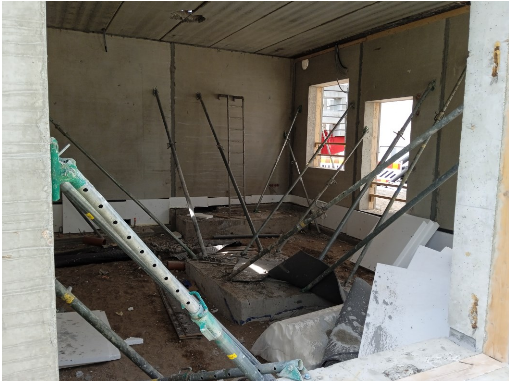
Kuva 5. Seinäelementtien tuenta asuinkerrostalotyömaalla elementtituilla eli tönäreillä. [8.]

Seinäelementtejä asennettaessa on huomioitava seinäelementtien tuenta. Tuennan pitää olla riittävän vahva, että betonielementti ei pääse kaatumaan. Sauvalut tulee pyrkiä tekemään mahdollisimman nopeasti asennuksesta, jotta tuilla jäykistettäisiin mahdollisimman vähän kerroksia. Asuintalorakentamisessa yleensä käytetään elementtitukia eli tönäreitä. Näitä käytetään yleensä kahta joista seinäelementtiä varten, kuten kuvassa 5. [2, s.475.]