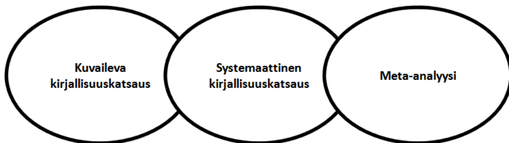
Kuva 2 Kirjallisuuskatsauksen tyypittely [12, s. 6].

Kirjallisuuskatsaus voidaan jakaa menetelmällisesti erilaisiin kirjallisuuskatsaustyyppeihin, jotka on esitetty kuvassa 2. Tässä tutkimuksessa käytetystä tutkimusmenetelmästä käytetään nimitystä kuvaileva kirjallisuuskatsaus. Tutkimusmenetelmänä se tarjoaa tietoa aiheesta yleiskatsauksen omaisesti ilman tiukkoja raameja. Tutkittavaa ilmiötä saadaan kuvattua laajasti sekä tarpeen tullen jopa luokiteltua ilmiön ominaisuuksia. [12, s. 7.] Vaikka narratiivisessa kirjallisuuskatsauksessa, josta tässäkin on käytetty, ei täytä erityisen systemaattista seulaa, mutta antaa se ajantasaista tietoa tutkitusta ilmiöstä. Tällä tutkimusmenetelmällä saadaan tukea ja tietopohjaa tutkimuksen johtopäätöksiin. [12, s. 7.]