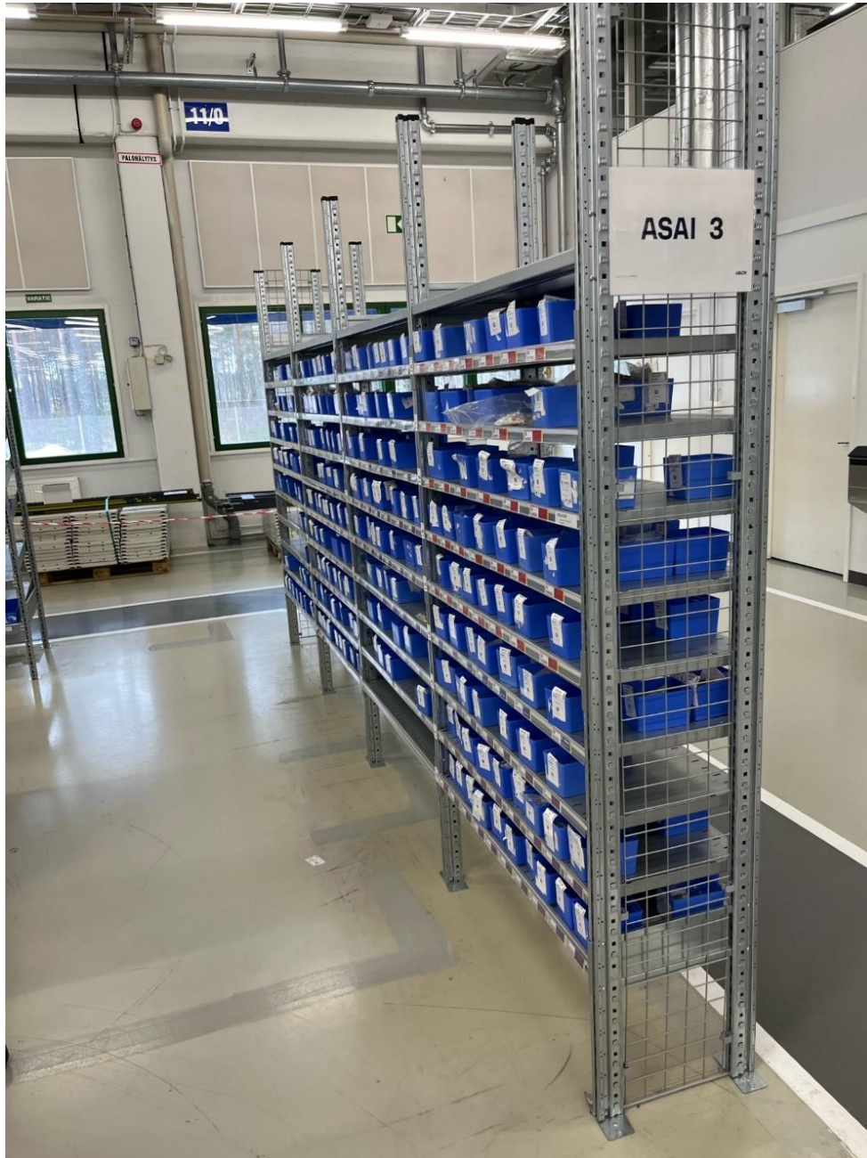
Kuva 5. Kanban-hyllyjen kapeampi hyllytyyppi. (Kuva: Peetter Härkönen).

Abloylla Kanban-hyllyt ovat käytössä kokoonpano- ja pakkausosastolla. Abloyn Kanban-hyllyt ovat sijoitettuna kokoonpano- ja pakkausosaston ympärillä, josta työntekijöillä on niihin helppo pääsy.