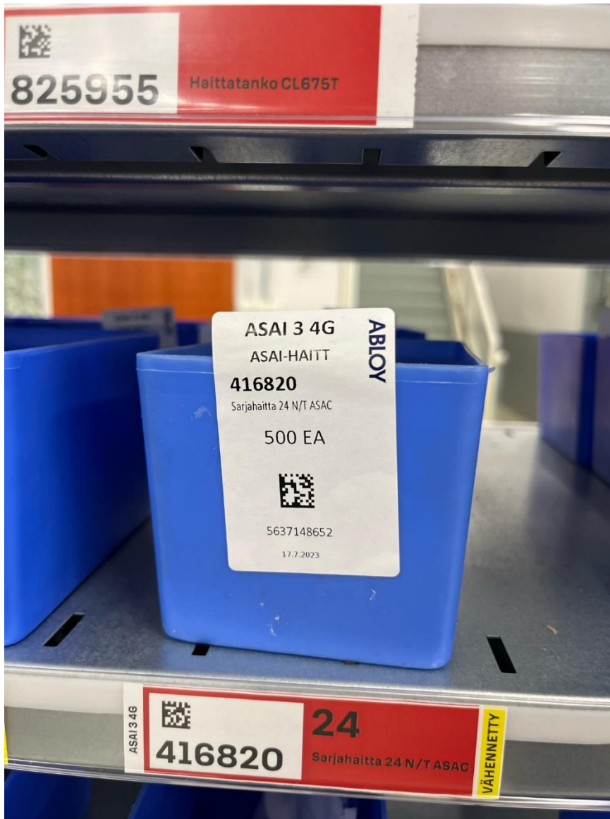
Kuva 6. Abloylla käytössä olevat Kanban-kortit ja merkinnät. (Kuva: Peetter Härkönen).

Kanban-hyllyissä on lähes 500 nimikettä eli laatikkoa. Osien koko ja määrä vaihtelee, minkä mukaan ne sijoitetaan erikokoisiin laatikoihin. Kanban-korttien tarkoituksena on ilmaista logistiikalle, mihin hyllyyn ja hyllypaikalle nimike vietään.