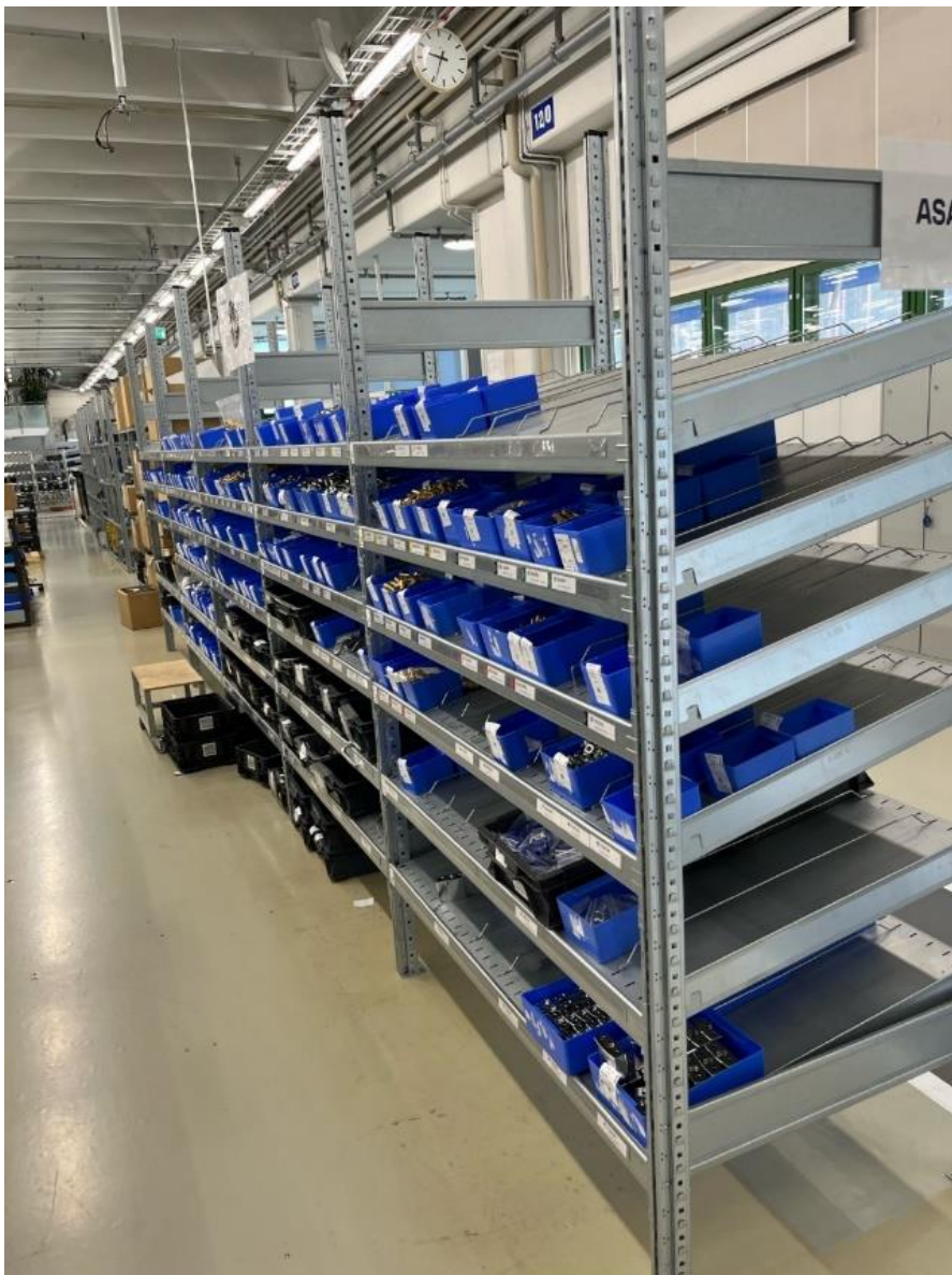
Kuva 4. Kokoonpano-osaston Kanban-hyllyt. Kallistettu hylly tehostaa läpivirtausajatusta. Tämä on perinteisempi läpivirtaushyllymalli. (Kuva: Peetter Härkönen).

Abloylla on käytössä Kanban-hyllyt eli toiselta nimeltään läpivirtaushyllyt (Kuva 4. ja 5.) Kokoonpano-osastolla on käytössä kahta erityyppistä hyllyä. Näitä käytetään useilla eri työpisteillä ja etenkin kokoonpanossa. Hyllyjen täyttö tapahtuu hyllyjen takapuolelta, josta ne läpivirtaavat kokoonpanoa varten. Hyllyjen täyttöä hoitaa Abloyn logistiikkaosasto.