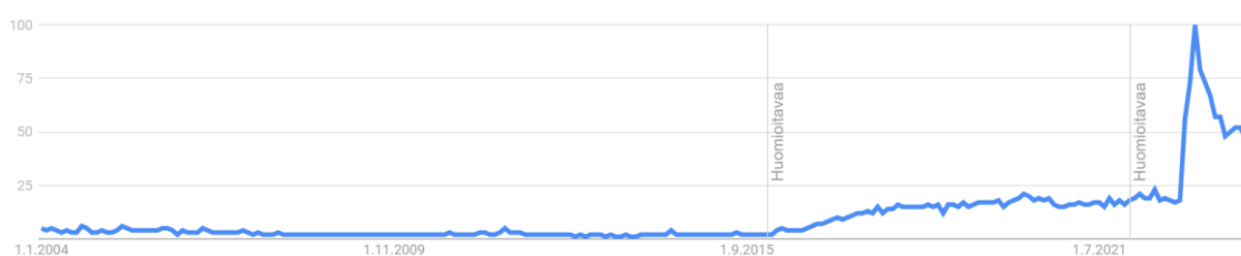
KUVIO 1: Google Trends hakusanalla ”chatbot” ajanjaksolla 1.1.2004 – 1.1.2024.