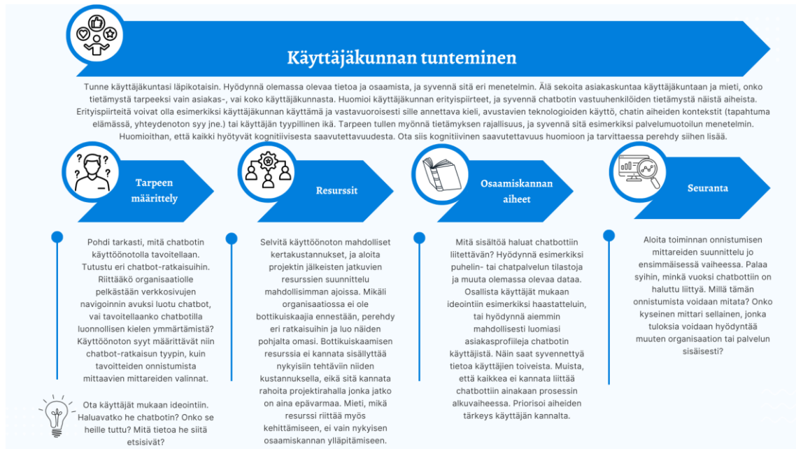
KUVIO 6: Ehdotus alan ammattilaisille tai chatbotin käyttöönottoa harkitseville organisaatioille.