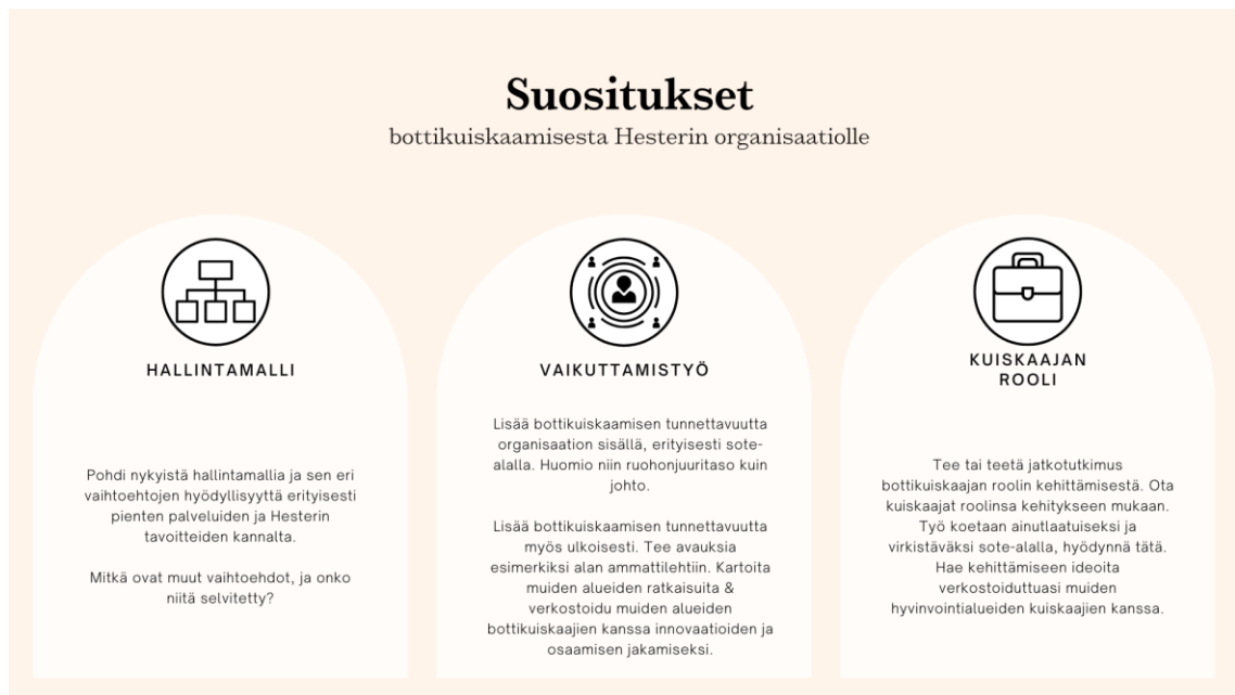
KUVIO 6: Suositukset bottikuiskaamisesta Hesterin organisaatiolle.