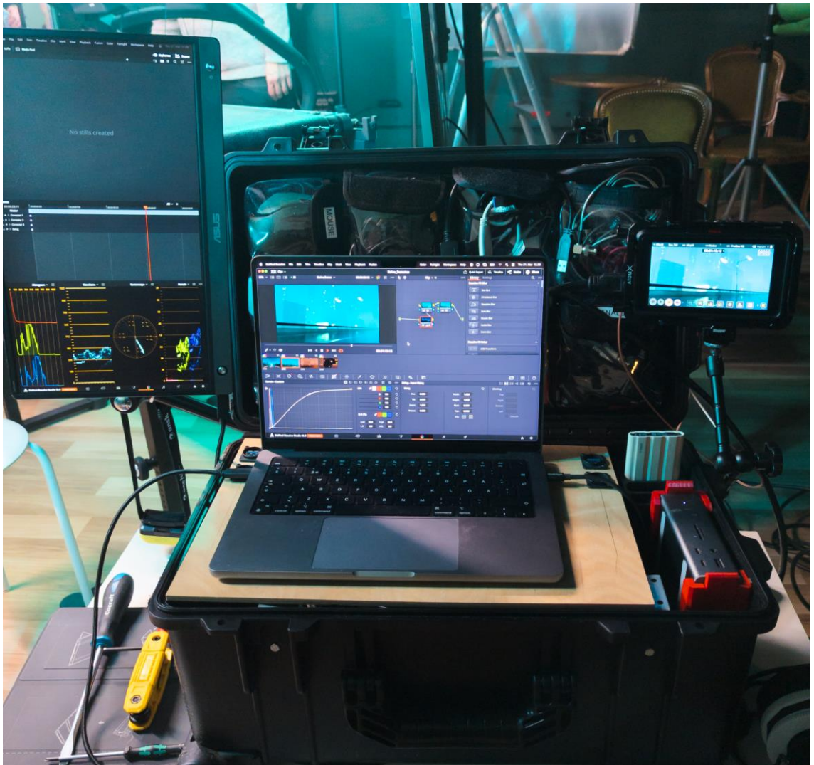
KUVA 1. Liikkuva työpiste.