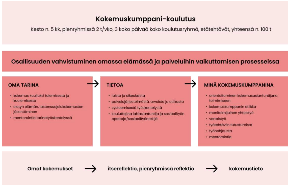
Kuva 4 Kokemuskumppanikoulutus (Perhekuntoutuskeskus Lauste, Asiakkaasta kumppaniksi -hanke 2023)

Yllä Perhekuntoutuskeskus Lausteen kokemuskumppanit.fi -sivustolta lainattu kuva havainnollistamaan kumppanien koulutusta ja osallisuuden ja ammattitaidon vahvistumista niin omassa elämässä, kuin lastensuojelun palveluissa Lausteen kumppaneiden koulutuskokonaisuudessa.