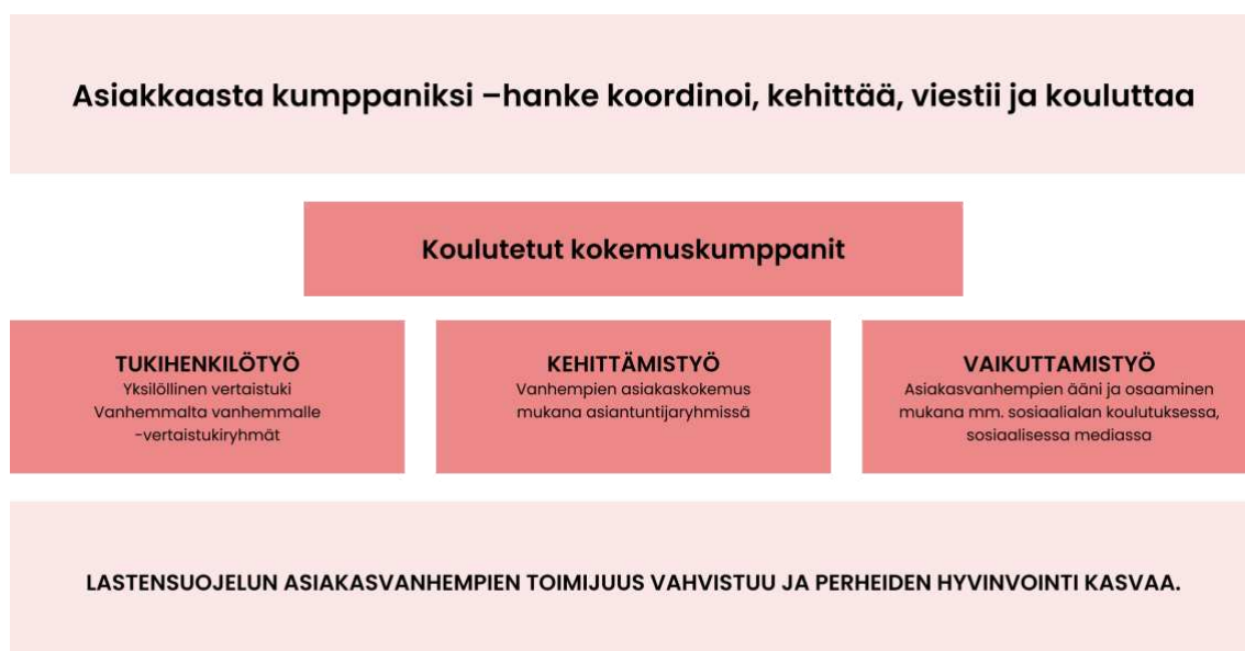
Kuva 3 Kokemuskumppanit osana Lausteen lastensuojelun palveluita (Perhekuntoutuskeskus Lauste 2023)

Alla otos Perhekuntoutuskeskus Lausteen kokemuskumppanit.fi -sivustolta otettu kartoitus Asiakkaasta kumppaniksi -hankkeesta, jossa havainnollistetaan itse hanketta ja koulutettujen kumppaneiden työnkuvaa ja työn sisältöä: