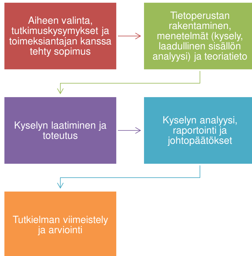
Kuva 1 Tutkimuksen eteneminen

Aloitimme tutkimuksen määrittelemällä tutkimuskysymykset ja tavoitteet. Keskustelimme toimeksiantajan kanssa mahdollisista muutoksista ja tutkielman teemasta, ja päädyimme lopulta kokemuskumppanuuteen sijaishuollon perhetyön näkökulmasta. Halusimme selvittää kokemuskumppaneiden, eli kokemusasiantuntijoiden, omia ajatuksia työstään ja sen vaikuttavuudesta. Keräsimme tutkielmaa varten tarvittavaa tutkimusta ja aineistoa niin teoreettisen tietoperustan kuin haastattelujenkin kautta. Päätimme tehdä haastattelut anonyymeinä yksilöhaastatteluina, joko Microsoft Teams-sovelluksen tai suorien sähköpostivastausten kautta.