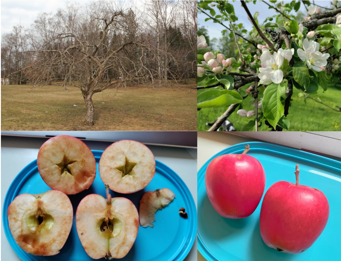
Kuva 3. Bergius talviasussa, puun kukinnot ja hedelmät.

keskiosassa, avoin ja syvä. Siemeniä on yksi tai kaksi yhdessä lokerossa, mutta jokaisessa lokerossa ei ole siementä. Siemenet ovat tummanruskeita, lyhyitä ja pulleita. Hedelmän malto on kuoren ja johtojänteiden ympäriltä punaista ja muuten vaaleaa. Rakenteeltaan se on mureaa, mausteisen hajuista ja aavistuksen jauhoista. Maku on samaan aikaan kirpeähkö ja imelä.