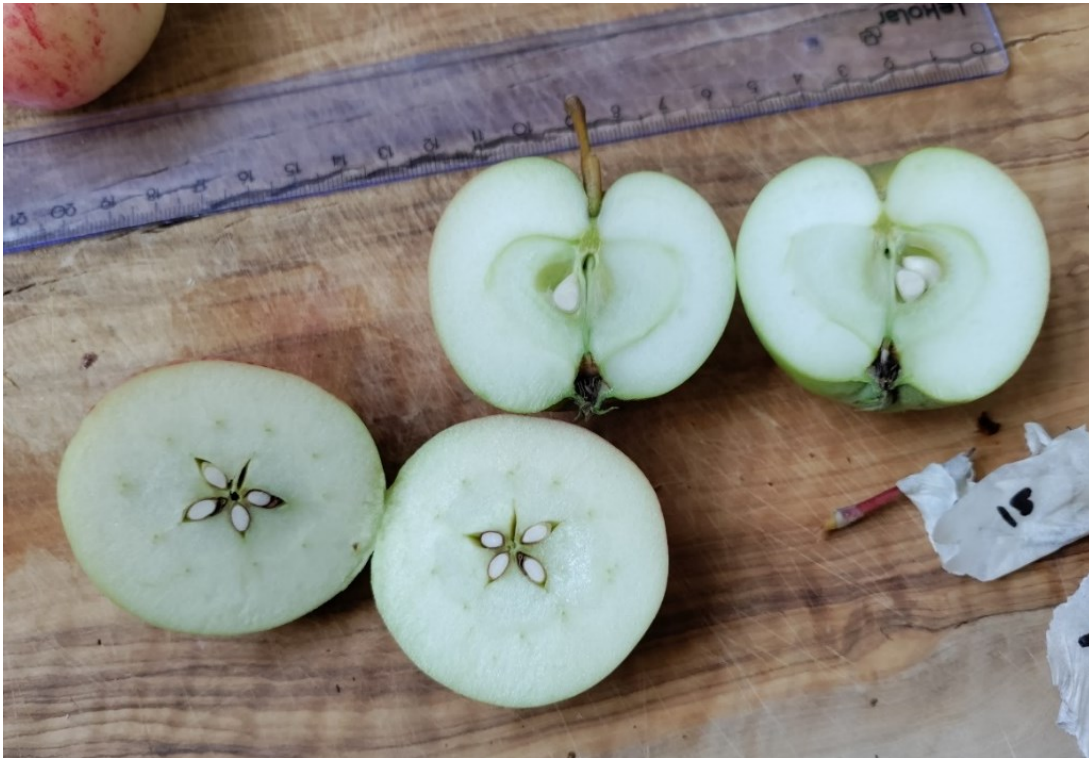
Kuva 1. Hedelmän sisäisiä tuntomerkkejä pitkittäis- ja poikittaissuunnassa halkaistuissa hedelmissä.

Lajikkeen tunnistaminen hedelmistä vaatii useamman yksilön tutkimista. Ihanteellista olisi, jos kustakin puusta voitaisiin tutkia noin kymmenen sille puulle tyypillistä yksilöä. Vain muutamasta omenasta ei voida muodostaa täysin luotettavaa aineistoa, sillä hedelmät ovat aina yksilöllisiä. Samoin olisi hyvä, jos puita ja sen satoa olisi mahdollista seurata useamman vuoden ajan. Tämä auttaa sulkemaan pois esimerkiksi poikkeuksellisten kesien aiheuttamat muutokset hedelmien värissä ja koossa. (Krannila & Paalo, 2010, s.104)