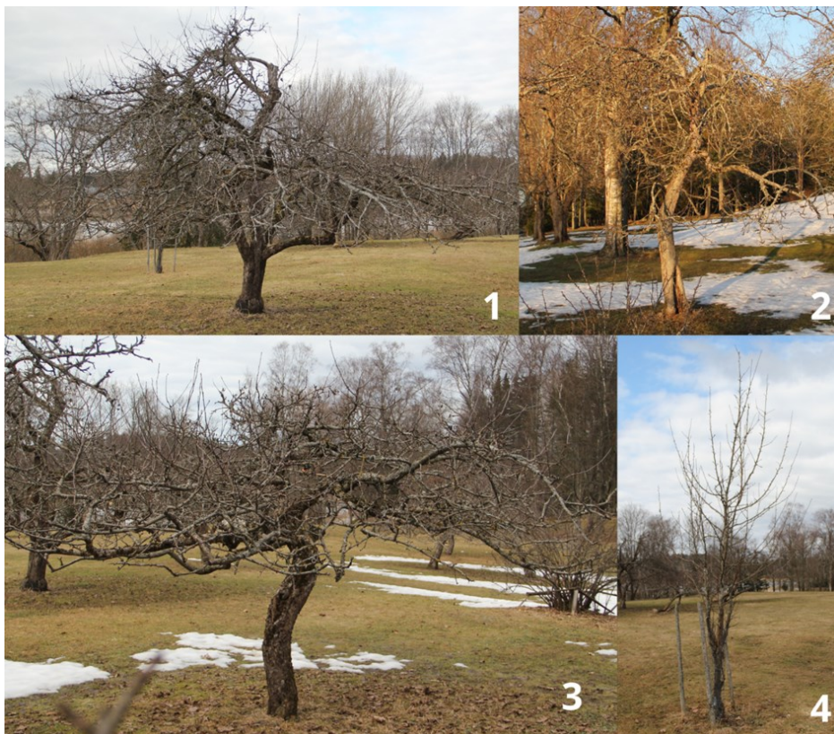
Kuva 2. Tarhan puiden neljä ikäryhmää.

Puista oli lopulta morfologisten tuntomerkkien perusteella erotettavissa neljä ikäryhmää, jotka on esitelty Kuvassa 2. Ikäryhmät olivat ennen pakkastalvia 1929–1942 istutetut puut, eli ryhmä 1, pakkastalvien 1939–1942 jälkeen istutetut puut, noin 1980-luvulla istutetut puut, eli ryhmä 3, sekä vuosien 2000 ja 2010 välillä istutetut puut, eli ryhmä 4. Suurin osa tarhan puista edustaa ikäryhmiä 1 ja 2. Ryhmän 3 puita on tarhassa kolme ja ryhmän 4 neljä kappaletta.