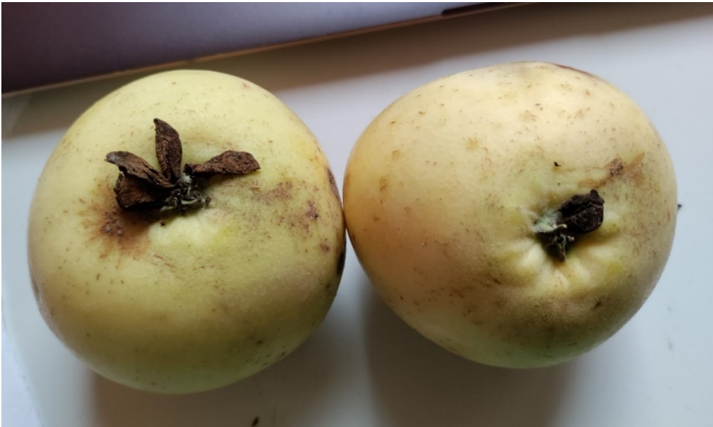
Kuva 5. Kuituneita terälehtiä puun 21 hedelmissä.