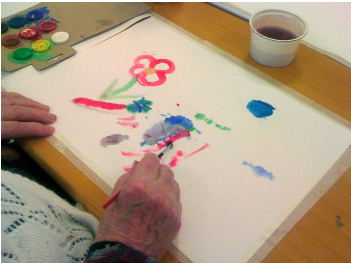
KUVA 1: Taidetuokion osallistuja maalaamassa.

Kuvat kertovat enemmän kuin tuhat sanaa. Esimerkiksi kuvakortteja käyttämällä on mahdollista käsitellä hankalia asioita tai viestiä, kun siihen ei enää kyetä sanoin. Kuvat voisivat olla arvokas apuväline, kun ollaan tekemisissä passivoituneen ja masentuneen potilaan kanssa.