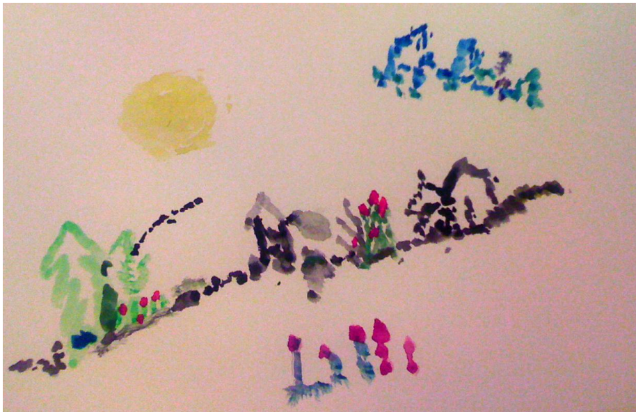
KUVA 3: Taidetuokiossa tuotettu maalaus

Taidetuokio ei edennyt ihan suunnitelman mukaan. Maalausaiheita oli aluksi valittuna kaksi. Ensimmäinen työn piti olla kokeellinen työ, jonka tarkoituksena olisi tutustuttaa tekijät maaleihin ja muotoihin ja maalaamaan vapaasti vailla varsinaista päämäärää. Pääasia olisi saada jonkinlaista jälkeä aikaiseksi ja voittaa pelko tyhjää paperia kohtaan. Toisen työ oli tarkoitus olla kaikkien yhteinen: "Värien joki". Koetin asetella papereita vierekkäin, jotta vierustoverit voisivat jatkaa maalauksiaan toistensa papereihin, mutta pöytien kokoerojen kanssa tuli ongelmaa, eikä papereita saanut aseteltua saumattomasti yhteen. Huomasin myös että pyörätuolit veisivät todella paljon tilaa, mikä tekisi vierekkäin maalaamisesta haastavaa. Luovuin tässä vaiheessa yhteisestä työstä ja asettelin pöydille papereita osallistujamäärän mukaan. Hoitajat toivat osallistujat saliin ja jäivät valvomaan tapahtumaa.