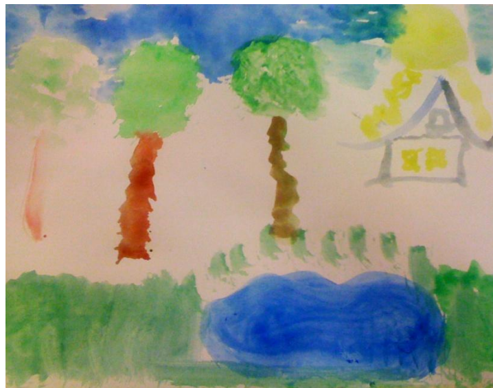
KUVA 2: Taidetuokiossa tuotettu maalaus.

Taidetoiminnalla, kuten muunkin tyyppisellä viriketoiminnalla on suurta merkitystä sosiaalisuuden ja vuorovaikutuksen edistäjänä. Yksinäisyys on hyvin yleinen ongelma ikääntyneiden kesken. Erityisesti laitoshoidossa olevat henkilöt tuntevat yksinäisyyttä verrattuna kotona asuviin. Yksinäisyys voi parhaimmillaan olla toivottavaa ja omaehtoista, mutta kielteiseen yksinäisyyden kokemukseen liittyvät usein menetykset, oman toimintakyvyn heikkeneminen ja kodin lopullinen jättäminen palvelutaloon siirtyessä. Haastavaksi ikäihmisen yksinäisyyden kokemuksen tekee se, että yksinäisyyden tunnetta pidetään usein häpeällisenä ja siitä on vaikea puhua, vaikka juuri yksinäisyydestä puhumisen on havaittu lievittävän tätä kokemusta. Ryhmätoiminnasta on positiivisia kokemuksia vanhusten yksinäisyyden lievittämisessä, etenkin kun ryhmät itse ovat saaneet vaikuttaa toiminnan sisältöön. (Voutilainen & Tiikkainen 2008. 184-193.)