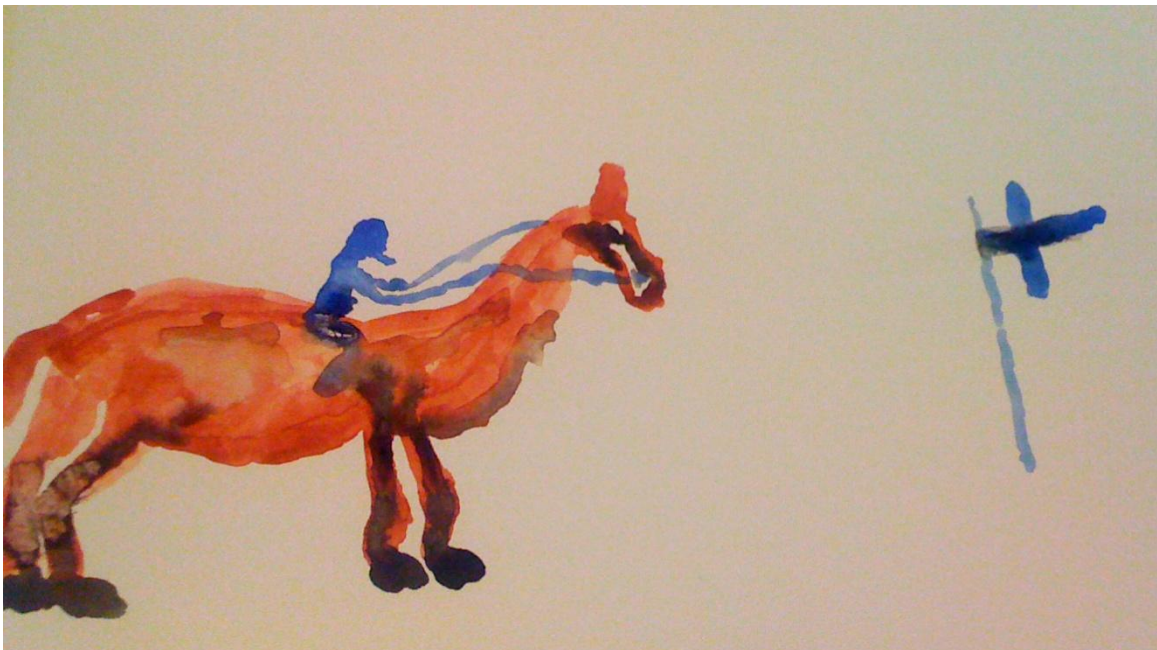
KUVA 5: Taidetuokiossa tuotettu maalaus.

Ensimmäiset osallistujat tulivat noin kymmenen minuuttia ennen sovittua aikaa, enkä ollut ehtinyt saada tapahtumapaikkaa täysin valmiiksi. Joka tapauksessa päätin antaa tulijoille luvan kokeilla taidetarvikkeita vapaasti, sillä osa vaikutti jo todella innokkaalta. Sitä mukaa kun osallistujia tuli lisää, ohjasin heitä tarttumaan siveltimeen ja maalaamaan mitä päähän juolahtaa. Hämmästyin nähdessäni miten spontaanisti useimmat osallistujat alkoivat tuottaa taidetta (Kuvat 1-6). Suosittuja aiheita olivat kukat, talot ja muut luontoaiheet. Joku maalasi aidonnäköisiä ruusuja, toinen korean sateenkaaren. Vain yksi osallistuja ei halunnut maalata lainkaan. Kysyttäessä asiasta hän sanoi että hänellä ei ollut lainkaan lahjoja, eikä häntä asia edes kiinnostanut. Hän kuitenkin sanoi katselevansa mielellään toisten työskentelyä. Ehdotin valmiita aiheita vain niille osallistujille, jotka eivät keksineet mitään. Kolmea autoin näyttämällä mallia. Eräs taiteilija yritti laittaa maalia suuhunsa siveltimellä, mutta hänkin sai lopulta tehtyä paperille kuvioita kun häntä autettiin kädestä alkuun.