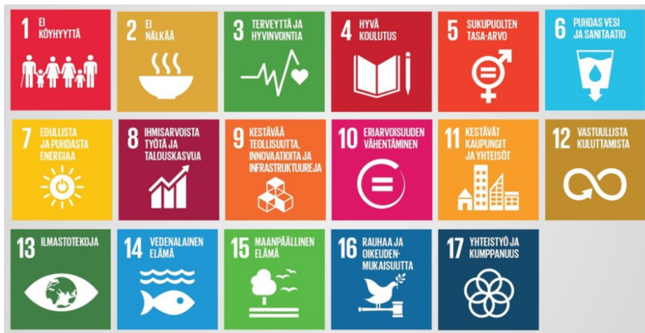
Kuva 1 Agenda 2030 tavoitteet

YK:ssa sovittiin vuonna 2015 kestävän kehityksen toimintaohjelmasta, Agenda 2030:sta, joka ohjaa kaikkien maailman maiden kestävän kehityksen työtä. Kyseinen toimintaohjelma sisältää 17 tavoitetta, jotka tulisi saavuttaa vuoteen 2030 mennessä. Kaikki 17 tavoitetta näkyvät kuvassa 1. Kaikille maille on asetettu samat tavoitteet, mutta niiden painotus vaihtelee maiden kehitystasosta riippuen. Maiden hallitukset vastaavat tavoitteiden saavuttamisesta ja ovat sitoutuneet laatimaan myös suunnitelmia siitä, miten tavoitteisiin päästään. Suomessa hallituksen toimenpiteet tavoitteiden saavuttamiseksi on esitelty valtioneuvoston Agenda 2030- selonteossa. (Valtioneuvoston kanslia.)