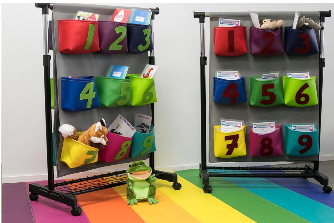
Kuva 1. LeaDon taskusto.

Perusopetuksen opetussuunnitelman perusteissa (Opetushallitus 2014) on seitsemän laaja-alaista oppimisen kategorialla: 1. ajattelu ja oppimaan oppiminen; 2. kulttuurinen osaaminen, vuorovaikutus ja ilmaisu; 3. itsestä huolehtiminen ja arjen taidot; 4. monilukutaito; 5. tieto ja viestintäteknologian osaaminen; 6. työelämätaidot ja yrittäjyys sekä 7. osallistuminen, vaikuttaminen ja kestävän tulevaisuuden rakentaminen. LeaDo -oppimiskeskuksessa on täydennetty näitä seitsemää kategorialla vielä kahdella kategorialla: 8. luovuus ja voimavarat sekä 9. unelmat ja toiveet. Nämä yhdeksän kategorialla toimivat LeaDon toiminnanohjausjärjestelmän ja siihen liittyvän taskuston perustana (kuva 1).