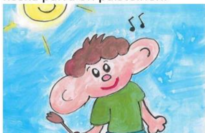
Kuva 8. Tunneloru iloisesta Rolle Röllistä

Rolle Rölli on iloinen Iloista Rollea naurattaa iloisena Rolloa aina laulattaa. Rolle Rölli on iloinen koska päivä on paisteinen.