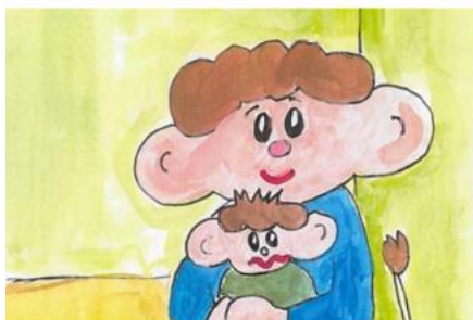
Kuva 11. Kun Rollea pelottaa -tunneloru

Kun Rollea pelottaa silloin isä lohdutta pelko pois katoaa kun isä sylissään heijaa. Kertoa kun pelkonsa saa mieltä se rauhoittaa.