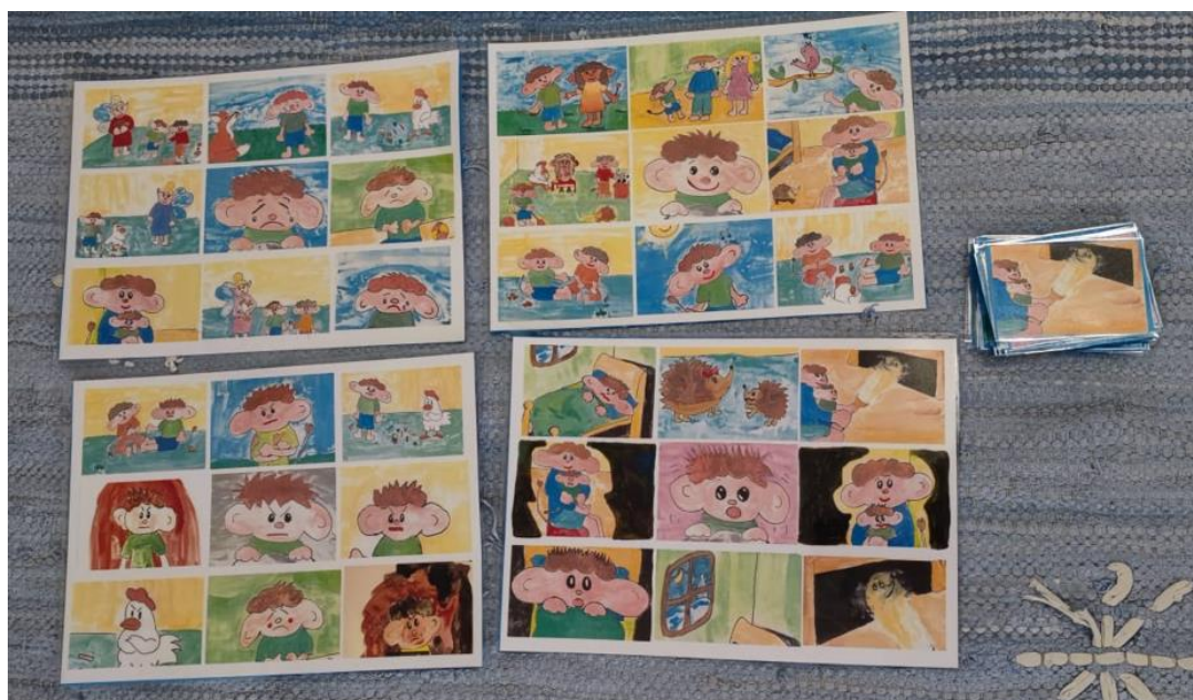
Kuva 15. Rolle Röllin Lotto-peli

Aivoriihessä nousi idea, että Lotto-peli voisi olla pienille lapsille helpompi kuin muistipeli. Toteutimme siis pelialustat ja -kortit Lottoon käyttäen satujen ja lo-rujen kuvia. Lotto-alustaan tuli kuhunkin 9 Rolle Röllin kuvaa. Pelialustojen koko on A4. Päiväkoti voi myöhemmin oman tarpeensa mukaan toteuttaa myös muistipelin, sillä heillä on sähköiset versiot kuvista.