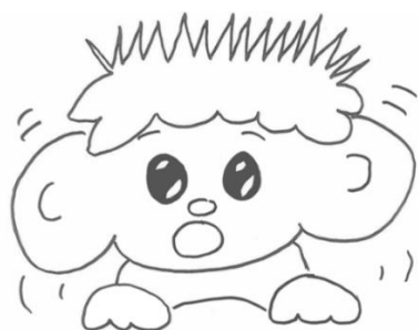
Alkuperäinen pelko kuva väritysversiona

Materiaali tarjosi luontevan väylän lasten keskinäiselle ja lasten ja ryhmän aikuisten väliselle tunnekeskustelulle. Lapsilta oli esimerkiksi kysytty, milloin heillä on surullinen olo (samalla näytetty surullista Rolle Rölliä), johon lapset olivat vastanneet, että silloin kun on ikävä äitiä tai isää. Parannettavaa materiaalissa oli pelkokuva. Pelkotunnekuva oli herättänyt muutamassa tilanteessa kysymyksiä, eivätkä kaikki lapset olleet yhdistäneet Rolle Rölliin ilmettä pelon tunteeseen, vaan se oli sekoitettu ihmetykseen tai jännitykseen. Ajattelemmme materiaalien tekijöinä, että on hyvä ymmärtää, että eri tunteet saattavat eri ihmisillä näyttäytyä erilaisina kasvoniilmeinä. Teimme kuitenkin pelkokuvasta parannellun version ja toimitimme sen päiväkotiiin. Kuva 16 havainnollistaa kuvan muokkauksen.