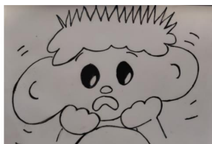
Uudistettu pelko kuva väritysversiona