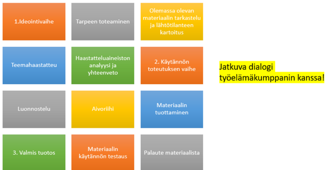
Kuva 1. Tunnekasvatusmateriaalin tuotekehitysprosessin vaiheet (mukailien Windahl & Välimaa 2012, 10)

Tuotekehityksen prosessi lähtee liikkeelle tavoitteesta kehittää uusi tuote (Jokinen 2001, 9), joka meidän tapauksessamme on tunnetaitomateriaali alle 3-vuotiaille lapsille varhaiskasvatukseen arkeen. Tulevaa tuotetta saatetaan Windahlin ja Välimaan (2012, 12) mukaan lähteä ideoimaan esimerkiksi, sillä perusteella, että nykyisellä tuotteella ei pystytä vastaamaan asiakastarpeisiin. Meidän tapauksessamme päiväkodin senhetkiset tunnetaito materiaalit eivät vastanneet alle 3-vuotiaiden ryhmän tunnetaito kasvatukseen tarvetta. Tästä tarpeesta aloitimme ideoimisvaiheen tuotekehityksessä (kuva 1).