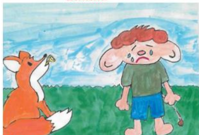
Kuva 9. Tunneloru surullisesta Rolle Rölistä

Rolle Rölli on surullinen Rolle Rölliä itkettää siksi Rolle itkeä pillittää. Niin on Rollella paha mieli kun kettu Rollen avaimen nieli.