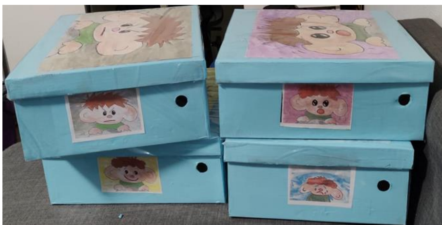
Kuva 3. Tunnetaitomateriaalien laatikot

Meidän tunnetaitomateriaalimme rakennettiin neljän perustunteen ilo , suru , pelko ja viha ympärille. Kullekin tunteelle teimme oman laatikon, jonka sisälle koostimme kunkin tunteen kanssa työskentelyyn tarkoitettut materiaalit. Toive laatikoista ja laatikoiden koosta tuli materiaalien tilaajalta. Saimme laatikot lahjoituksena ja muokkasimme niiden ulkoasua tunnemateriaalien teemaan sopivaksi liimaamalla laatikoihin Rolle Röllin tunnekuvia. Laatikoiden koon kriteereitä oli kaksi: niiden tuli sopia niille tarkoitettuun hyllyyn ryhmän toimintatiloihin ja laatikkoon piti mahtua A4-kokoisia materiaaleja.