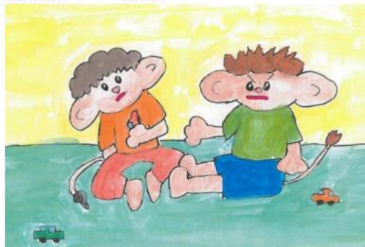
Kuva 10. Tunneloru vihaisesta Rollesta

Rolle Rölli suuttui ja naama ihan punaiseksi muuttui pikku auton kädestä otti Rollen ystävä Totti.