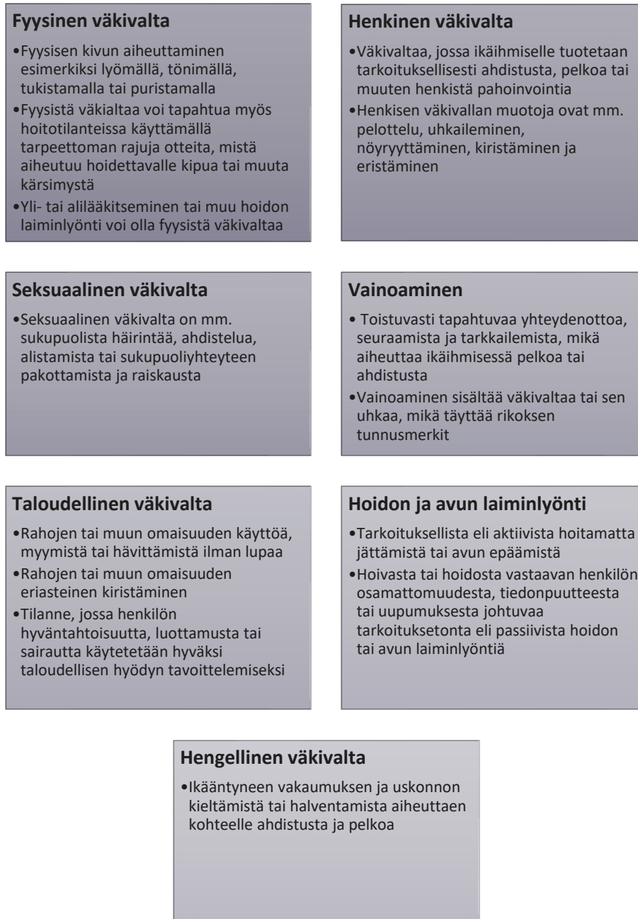
Kuvio 3. Kaltoinkohtelun muodot (mukaillen Suvanto ry, 2023).

THL:n (2023c) määritelmän mukaan kaltoinkohtelu ja laiminlyönti liittyy lapsen, vanhuksen tai vammaisen henkilön hoidon tai avuntarpeen laiminlyömiseen tilanteissa, joissa kaltoinkohtelun uhri on niistä riippuvainen. Kaltoinkohtelu voi sisältää myös toisen ihmisen vahingoittamisen esimerkiksi lääkkeillä tai päihteillä. Storey (2020) toteaa kaltoinkohtelun määritelmän olevan vielä epäselvä, mutta määrittelee tekijöitä, mistä kaltoinkohtelun voidaan tunnistaa. Kaltoinkohtelu sisältää yksittäisen tai toistuvan väkivallan teon tai laiminlyönnin, teko tapahtuu