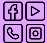
Kuva 2. Negatiiviset ilmiöt sosiaalisessa mediassa, haastattelukysymykset