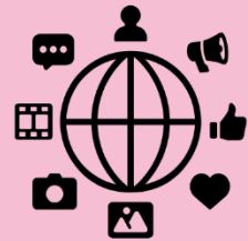
Kuva 2: Negatiiviset ilmiöt sosiaalisessa mediassa, haastattelukysymykset

Haastateltavilta tiedustelimme, mitä negatiivisia ilmiöitä he tietävät sosiaalisessa mediassa olevan ja mitä se aiheuttaa. Haastateltavat toivat päälimmäisenä esille nettikiusaamisen ja seksuaalisen häirinnän. Kiusaaminen näkyy haastateltavien mielestä esimerkiksi sovellusten ryhmistä poistamisena. Keskusteluissa ilmeni myös vanhempien huoli siitä, että vaikka nuori ehtisi poistaa oman julkaisunsa niin joku voi ottaa kuvakaappauksen ja jakaa sen omille kontakteilleen, jolloin julkaisu jatkaa koko ajan leviämistään eikä sitä saada enää pysäytettyä.